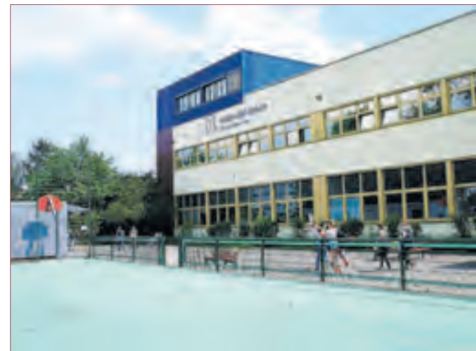
SABINE-BALL-SCHULE mit Sportplatzgelände.

nen Tür beginnt mit der wichtigen Einführungsveranstaltung um 11:00 Uhr. Die Schulleitung stellt die pädagogische Konzeption der Schule