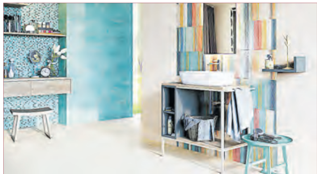
URLAUBSFEELING für zu Hause.

bare Edelstahl-Elemente oder Styrodur-Nischen als Regale und erhalten Sie somit Extraplatz für eine Vielzahl von Utensilien oder persönlichen Dekorationsideen. Wer sich bei der Duschfläche für Bodenfliesen entscheidet, hat nicht nur den