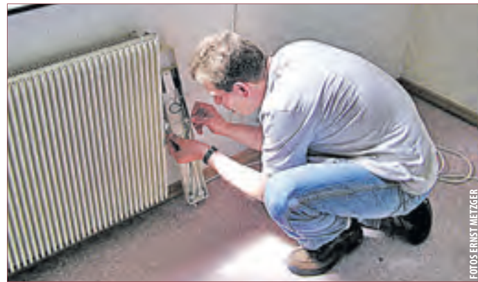
MONTAGE VOR ORT: Innerhalb eines Tages ohne Baustelle.