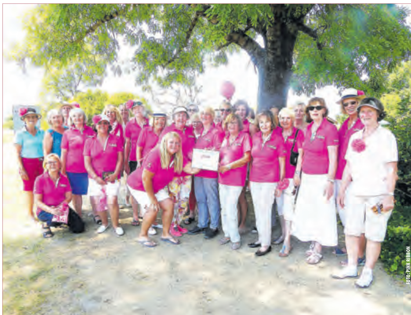
Die Damen des Kiawah Golf Parks spielten einen erfolgreichen Tag im Zeichen der pinkfarbenen Schleife.

Dieser Patient wurde während des Eingriffs zu Bewegungen animiert, denn der Tumor drückte bei ihm auf den Hirnbereich, der für die Motorik zuständig ist. „Auch dieser Eingriff ist sehr gut verlaufen. Ohne diese Operationstechnik hätte der Patient die Tumorentfernung sicher nicht ohne schwere Defizite überstanden“, so Dr. Geletneky. (Klinikum)