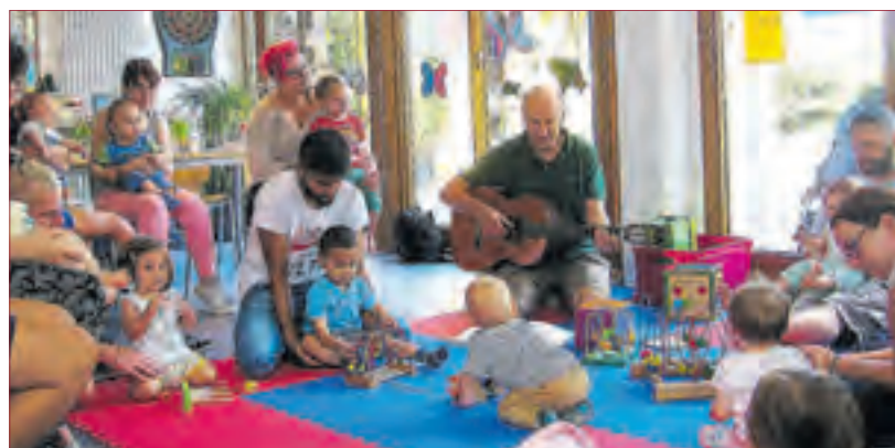
DER OFFENE TREFF LÄDT EIN: Er findet mittwochs 9:00 bis 11:00 Uhr im Jugendraum des Bürgerheims Eschollbrücken für Familien mit Kindern von 0-3 Jahren statt.

Offener Treff in Pfungstadt-Eschollbrücken für Austausch von Eltern und deren Kleinkinder