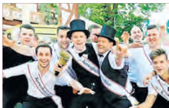
SEE'MER KERWEBORSCH: Alle sind willkommen zur Eröffnung am Kerbfreitag um 18:00 Uhr mit dem Musikzug Seeheim.

wird es um 11:00 Uhr ein Musik-Frühchoppen mit dem Musikzug Seeheim geben und ab 14:00 Uhr wieder einen Umzug mit zahlreichen Vereinen und Musikzügen. Getreu dem Motto „Altbewährtes währt am längsten“ findet die diesjährige Kerweredd wieder am Sonntagmittag um 16:00 Uhr statt. Montags wird die Kerb mit dem bekannten Frühschoppen ab 10:00 Uhr in den Gaststätten verabschiedet. Die See'mer Kerweborsch wünschen schon heute allen Kerwegästen der Gemeinde Seeheim-Jugenheim und rund herum eine schöne, unvergessliche Veranstaltung bzw. Seem'er Kerb 2017!!! Vielen Dank! hier seien die aktuellen und Neuzugänge der See'mer Kerweborsch erwähnt: Christian Heppenheimer (Kerwedder), Björn Sturm (Kerwglöckner), Sven Cröbmann (Kerweborsch), Sebastian Dieter (Kerweborsch), Silas Halsinger (Kerweborsch), Florian Dingeldein (Kerweborsch), Alexander Dingeldein (Kerweborsch), Christopher Schneider (Kerweborsch), Kevin Heisler (Kerweborsch), Andy Bielz (Kerweborsch) und Till Gassmann (Kerweborsch) die Kerweborsch-Neuzugänge 2017 sind Markus Roßmann, Luc Kümle und Riccardo Riversa.