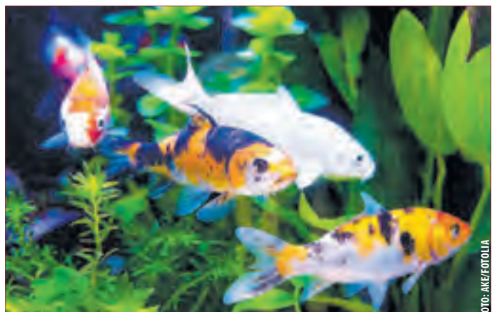
DAS FASZINIERENDE LEBEN DER KOIS im Teich miterleben - das ist mit der Teichkamera von Goldenitz möglich. Sie liefert einen Livestream direkt aufs Tablet oder Smartphone. (tm)

Erfahrung von Koi-Spezialist Goldenitz. Die Entwicklung in die Kamertechnik geht einher mit dem Wissen aus der groß angelegten Koi-Zucht auf Schloss Goldenitz. Der renommierte Online-Händler weiß: Die Zierfische sind empfindlich gegenüber Parasiten, einer Wunde oder einem Infekt. Nur wenn die Umgebung stimmt, können sie sich in aller Pracht entfalten. Hier sorgt die innovative Technik von Goldenitz für mehr Sicherheit in der Haltung der fernöstlichen Schönheiten. Mit dem Einbau der Kamera kann genau kontrolliert werden, ob es den schuppigen Freunden gut geht. Dabei hilft auch eine Bewegungserkennung, die den Halter per App informiert und die gewünschten Videos anzeigt. Vorzüge, von denen jeder Teichbesitzer profitiert. Wissenswerte Infos zur Koi-Zucht und Kamertechnik gibt es online unter www.goldenitz.com. (tm)