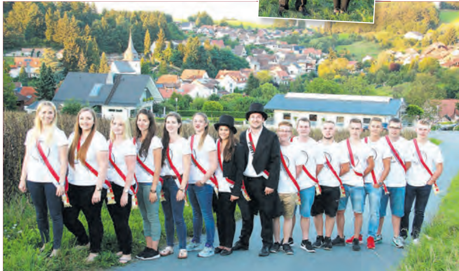
TRADITIONELL BEGINNT DIE KERB am Freitag um 19.00 Uhr mit dem Aufstellen des Kerwebaums.

chen sich auf in den Wald, um Birken zu schlagen und damit anschließend die Straßen zu schmücken. Gegen Abend beginnt der große Kerwenzug unter freiem Himmel mit Tanzmusik aus den 80igern, 90igern und das Beste von heute. Für gute Stimmung und Live Musik wird die Sunshine-Music-Band sorgen. Am Sonntagmorgen um 10.00 Uhr startet der Kerwezug und bahnt sich seinen Weg durch ganz Ober-Beerbach. An der Kreuzgasse angekommen, wird die Kerb vom Kerweausschuss ausgegraben. Dieses Jahr, so munkelt man, wird es ein ganz besonderes Highlight geben, seid gespannt! Im Anschluss