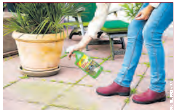
FINALSAN AF WEGE- & FUGENREIN: Das Mittel wurde speziell zur effektiven Beseitigung von Grünbelägen und Algen auf Wegen, Terrassen und Mauerwerk entwickelt.

alle grünen Pflanzenteile sowie auf Algen wirkt. Einfach die betroffene Fläche gründlich mit dem Grünbelagsentferner einsprühen, sobald die Beläge getrocknet sind gegebenenfalls abbürsten - fertig. Nach nur drei Stunden ist die Wirkung sichtbar, zudem beugt das Mittel der Neubildung von Belägen langfristig vor. Die Fugen bleiben sauber und Wege und Terrassen wirken neu und gepflegt. Pflanzenschutzmittel vorsichtig verwenden. Vor Verwendung stets Etikett und Produktinformation lesen. Biozidprodukte vorsichtig verwenden. Vor Verwendung stets Etikett und Produktinformation lesen. (tm)