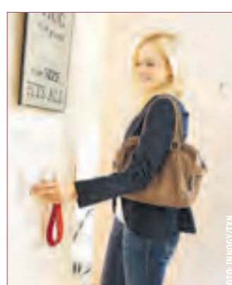
EINFACH MAL ABSCHALTEN: Fernseher, Drucker oder auch die Espressoemaschine...

In einem Smart Home System lassen sich Stand-by-Geräte über Zwischenstecker (z. B. innogy) mit einem zentralen Wandschalter vernetzen. Beim Verlassen des Hauses reicht es, diesen einen Schalter zu betätigen und alle Geräte mit verstecktem Stromverbrauch werden abgeschaltet. (tm)