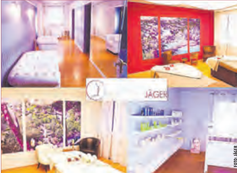
INSTITUT JÄGER: auf 250qm exklusiven Räumlichkeiten finden Behandlungen statt.

Unsere Haut ist oft belastet durch sichtbare und spürbare Ablagerungen. Schlacken- und Schadstoffe wie Pestizide in Nahrungsmitteln, Hormone und Anti-