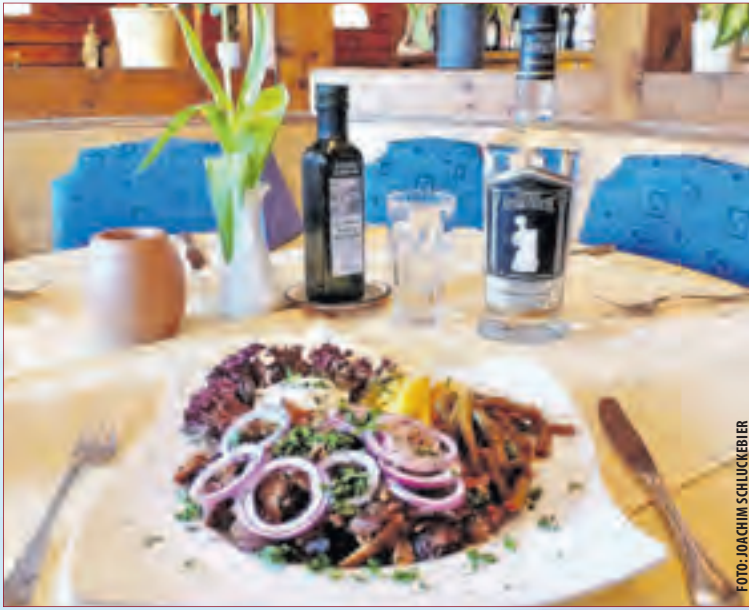
GYROS AM DREHSPIESS: Kosten Sie unbedingt diese Spezialität des Hauses!