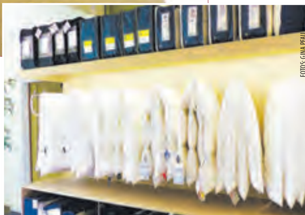
GERADE FÜR DIE SOMMERZEIT bietet die Matratzenwelt ein breites Angebot an verschiedenen Bettdecken.

spielen Vorerkrankungen, Körpergröße und Gewicht eine große Rolle. Durch regelmäßige Schulungen sind die Mitarbeiter der Matratzenwelt in der Lage