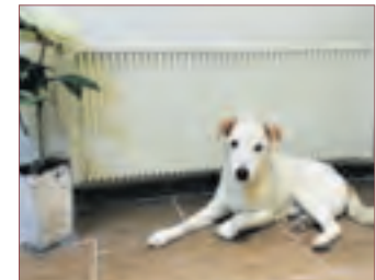
DA FÜHLT SICH auch der Jack-Russel einfach pudelwohl!