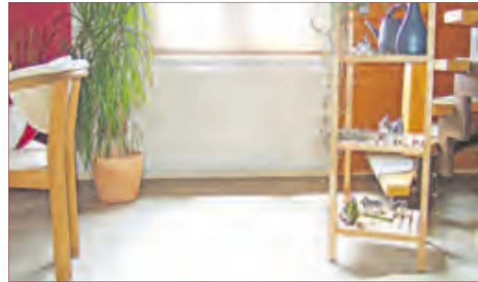
OPTISCH MODERNE, sparsame und hocheffiziente Elektroheizung.