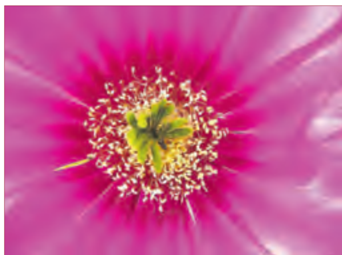
SILVIA DRESCHER: Aktivierungshilfe der Ressourcen eigener Fähigkeiten.