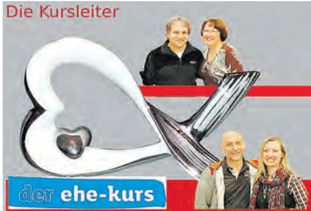
DER NÄCHSTE EHEKURS startet am Freitag den 25. August 2017 um 19:00 Uhr. Alle sind herzlich willkommen!

Hat der Alltag Ihre Ehe auch erreicht? Jeden Tag das Gleiche, keine Highlights mehr, alles nur Gewohnheit?