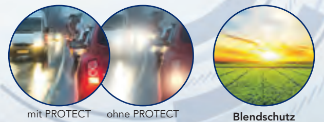
mit PROTECT ohne PROTECT Kontraststeigerung auch bei Nacht