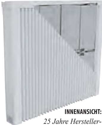
INNENANSICHT: 25 Jahre Herstellergarantie auf Heiz- und Speicherelemente.

chern möglich war. Sofort einsatzbereit ohne lange Vorzuheizen