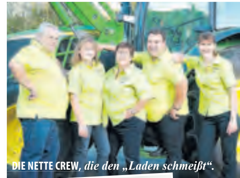
DIE NETTE CREW, die den „Laden schmeißt“.