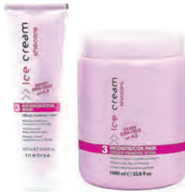
DI E RICHTIGE TIEFENPFLEGE für ein sprödes, ausgetrocknetes Haar nach den sonnigen Sommermonaten.

Der Sommer bedeutet für uns: Entspannt in der Sonne liegen und genießen. Viele erfreuen sich hierbei an ihrem Balkon oder der Terrasse, andere flüchten in wärmere Urlaubsgebiete wie Spanien, Italien oder Kroatien. Vor allem in den warmen Sommergebieten vergessen wir oftmals die richtige Pflege unseres Körpers und der Haare. Die UV-Strahlen können die im Haar enthaltenen Proteine aufspalten und das Haar stumpf und kraftlos wirken lassen. Diese Schäden sind in den äußeren Bereichen des Haarschaftes am stärksten, sodass Menschen mit dicken Haaren von Natur aus besser gegen UV-Strahlen