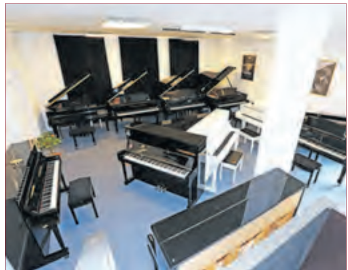
PIANO NEUFELD BIETET EIN VIELFÄLTIGES ANGEBOT verschiedener Piano-Marken und schon ab 1 Euro pro Tag können Sie ein Instrument mieten.

Piano Neufeld Inhaber Alexander Neufeld Hévizstraße 8, 64319 Pfungstadt Öffnungszeiten nach telefonischer Vereinbarung Telefon: 06157-9168133 eMail: info@piano-neufeld.de Homepage: www.piano-neufeld.de