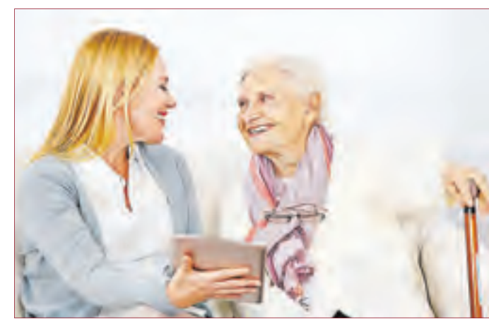
INTENSIVPFLEGE im häuslichen Umfeld gibt Sicherheit.

8:30 bis 13:00 Uhr. Am 23. August 2017 öffnen wir von 13:00 bis 17:00 Uhr unsere Türen für alle Kunden und Interessenten, um die neuen Räumlichkeiten vorzustellen. Bei Fragen erreichen Sie uns unter der Ihnen bekannten Telefonnummer 06151-50 14 00 oder per Fax 06151-50 14 02 oder per E-Mail über die info@pflegedienst-hessen-sued.de