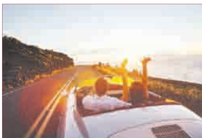
MIETWAGEN im Ausland: Wer mit einem Mietwagen unterwegs ist, sollte seinen Haftpflichtschutz um die sogenannte Mallorca-Police erweitern, um im Ernstfall finanziell auf der sicheren Seite zu sein.