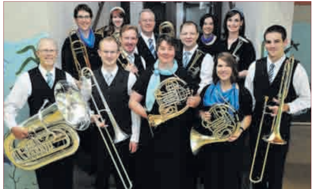
12 PROFI-MUSIKER aus den USA und Deutschland bieten Bläsermusik der Spitzenklasse.