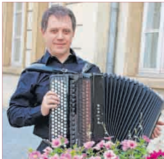
STAS VENGLEVSKI AUS USA gibt am 16. Juli ein Solo-Konzert im Dorfgemeinschaftshaus Bensch.-Schwanheim; Organisator ist der Akkordeon-Club „Blau-Weiß“ Bensheim. Mit brillanter Akustik und musikalischer Virtuosität eröffnet er seinem Publikum neue musikalische Dimensionen.

trag für das Instrument Akkordeon/Bajan. Stas Venglevski spielt weltweit Solokonzerte, konzertiert mit verschiedenen Orchestern und Ensembles wie dem Chicago Symphony Orchester, dem Tacoma Symphony Orchester, dem Flöten Ensemble Paris, dem Victory Theater in New York od. dem New York Metropolitan Ensemble u.v.m. Sein riesiges Repertoire umfasst Werke von Mozart, Vivaldi, Bach bis zu zeitgenössischen und zahlreichen eigenen Kompositionen. Durch seine brillante Artistik und musikalische Virtuosität eröffnet Stas Venglevski seinem Publikum neue musikalische Dimensionen. Sein äußerst gefühlsvolles und ausdrucksreiches Spiel auf höchstem Niveau begeistern u. fin-