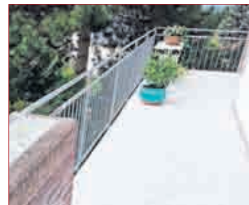
TOP SANIERTER BALKON nach Glanzner-Methode.

Kunstharz getränkt. Abschließend wird eine Endversiegelung, welche in allen RAL-Farben möglich ist, aufgebracht", sagt Wolfgang Glanzner. So entsteht eine fugenfreie, pflegeleichte Oberfläche, die garantiert