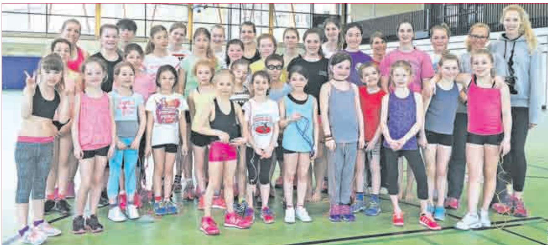
MÄCHTIG INS SCHWITZEN kamen die Rope Skipper des Turnvereins Seeheim und die Sportakrobaten der FTG Pfungstadt bei ihrem ersten gemeinsamen kleinen Trainingscamp in den Osterferien. Während für die Sportakrobaten Koordination, Springkraft und Schnelligkeit als Trainingsziele im Vordergrund standen, galt es für die Rope Skipper, ihre akrobatischen Fähigkeiten und Fertigkeiten zu perfektionieren. Dass dies keine einmalige Sache war, darüber sind sich Sportler und Trainer einig.