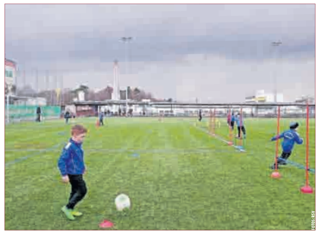
DRINGEND WANTED: Trainerinnen und Trainer oder einfach auch Personen zur Trainingsunterstützung.