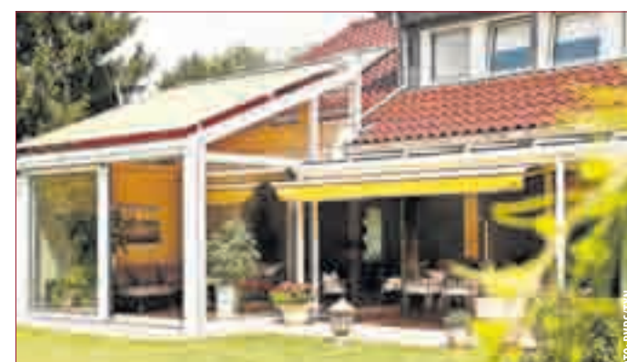
EIN WINTERGARTEN steigert die Wohnqualität. Und eine passende Markise verhindert zur warmen Jahreszeit das übermäßige Aufheizen des Innenraumes.

die Wintergartenkonstruktion montiert werden. Die Fachleute aus den Rollladen- und Sonnenschutzfachbetrieben passen Markisen individuell auf die Dach- und Seitenflächen der Wintergärten an. Das Ergebnis ist wohlthuender Schatten auf Knopfdruck. Die Experten können die motorisierte Markise auch mit Sensoren ausstatten, sodass sie bei Sonne selbstständig aus- und bei Regen und Sturm wieder einfährt.