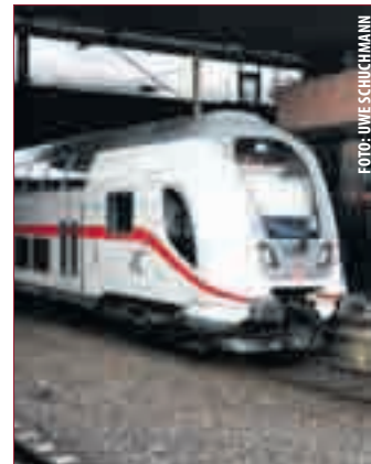
DOPPELSTOCKZÜGE sollen das Platzangebot und den Komfort auf der Odenwaldbahn verbessern, fordert der VCD.

MÜHLTAL | Der Verkehrsclub Deutschland (VCD) begrüßt die Ankündigung des RMV zu ersten Massnahmen zur Kapazitätssteigerung auf der Odenwaldbahn.