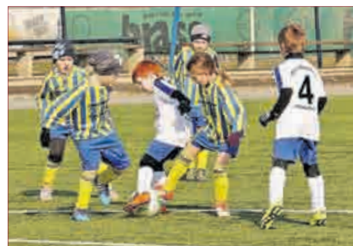
TRAINIEREN IM TRADITIONSVEREIN in Pfungstadt: RSV Gernania lädt alle Interessierten ein zum kostenlosen Reinschnuppern. „Trau Dich!“