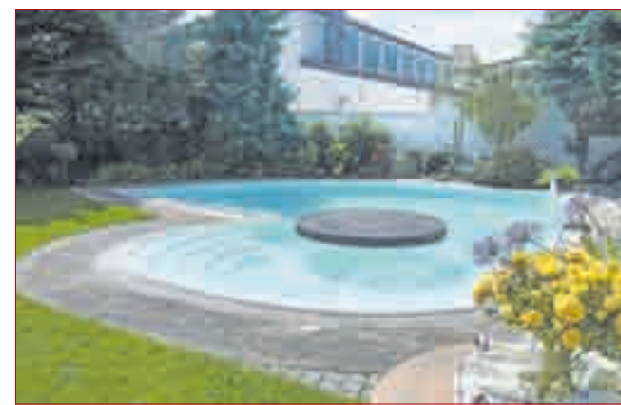
EINLADUNG zum Relaxen: Der beschichtete Swimming-Pool.

"Die vorhandene Fläche wird abgeschliffen und mit einer Grundierung versehen. Anschließend werden die Glasfasermatten aufgelegt und mit