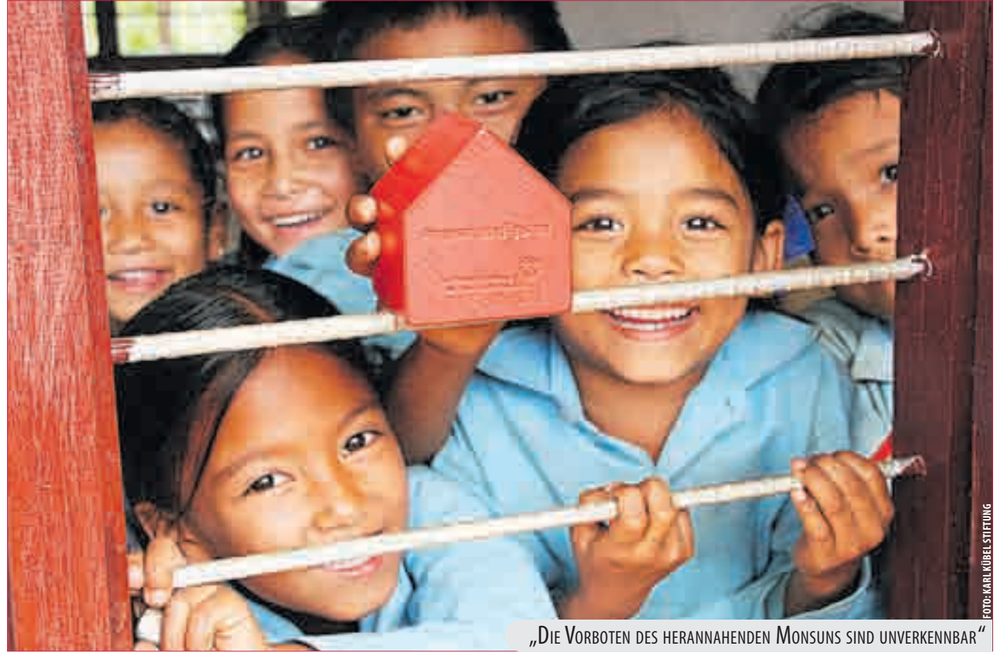
„DIE VORBÖTEN DES HERANNAHENDEN MONSUNS SIND UNVERKENNBAR“