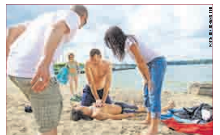
GEFAHREN IM WASSER: 488 Menschen ertranken im Jahr 2015.