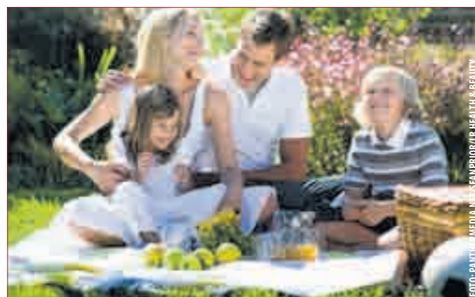
MIT DER GANZEN FAMILIE die Natur genießen - auf einen guten Hautschutz mit Aloe Vera sollte dabei nicht verzichtet werden.

Beim Toben im Garten kommt es immer wieder zu Kratzern oder Mückenstichen. Bei solchen kleinen Notfällen hilft das LR Aloe Vera Emergency Spray sofort. Per Knopfdruck legt