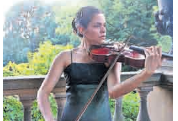
ÜBERZEUGENDES KONZERT für die jungen Meisterschüler und das Publikum.