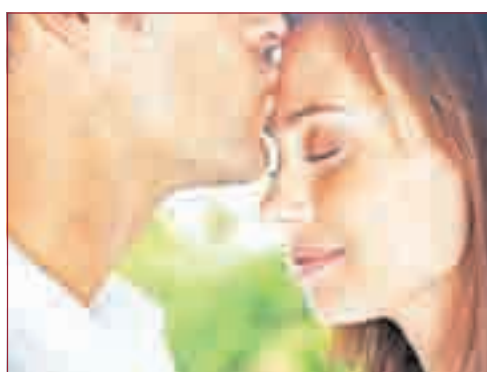
DAUERHAFT GLÜCKLICHE PARTNERSCHAFT: Schritt für Schritt zum Glück.

den Kindern von den Eltern geschenkt. Ihre Partnerschaft erlebt das Kind zuerst und damit ist auch das Verhältnis der Eltern zum Kind inklusive. Dieses Zusammenleben der Herkunftsfamilie im besten Fall mit Vertrauen, Respekt, Eigenverantwortung, einem liebevollen Umgang und Liebe als Basis der Partnerschaft und in der Familie prägt das Kind als allererstes und sehr tief. Wenn die o.g. Eigenschaften nicht vorherrschend sind in der Verbindung der El-