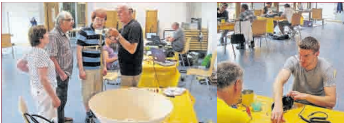
DAS NÄCHSTE REPAIR-CAFÉ findet nach der Sommerpause am Samstag, den 17. September statt.

und Vorsorgevollmacht, Hausnotrufsystem, die spezielle Betreuung von Senioren, 24 Stunden-Intensivpflege, Hauswirtschaftliche Versorgung u.v. m. Die Öffnungszeiten sind täglich von 9-13 Uhr, außer mittwochs. Ambulanter Pflegedienst Naake Büro Pfungstadt, Pfarrgasse 32 64319 Pfungstadt Tel. 06157-9374556 Fax 06157/9374704 info@pflegedienst-naake.de