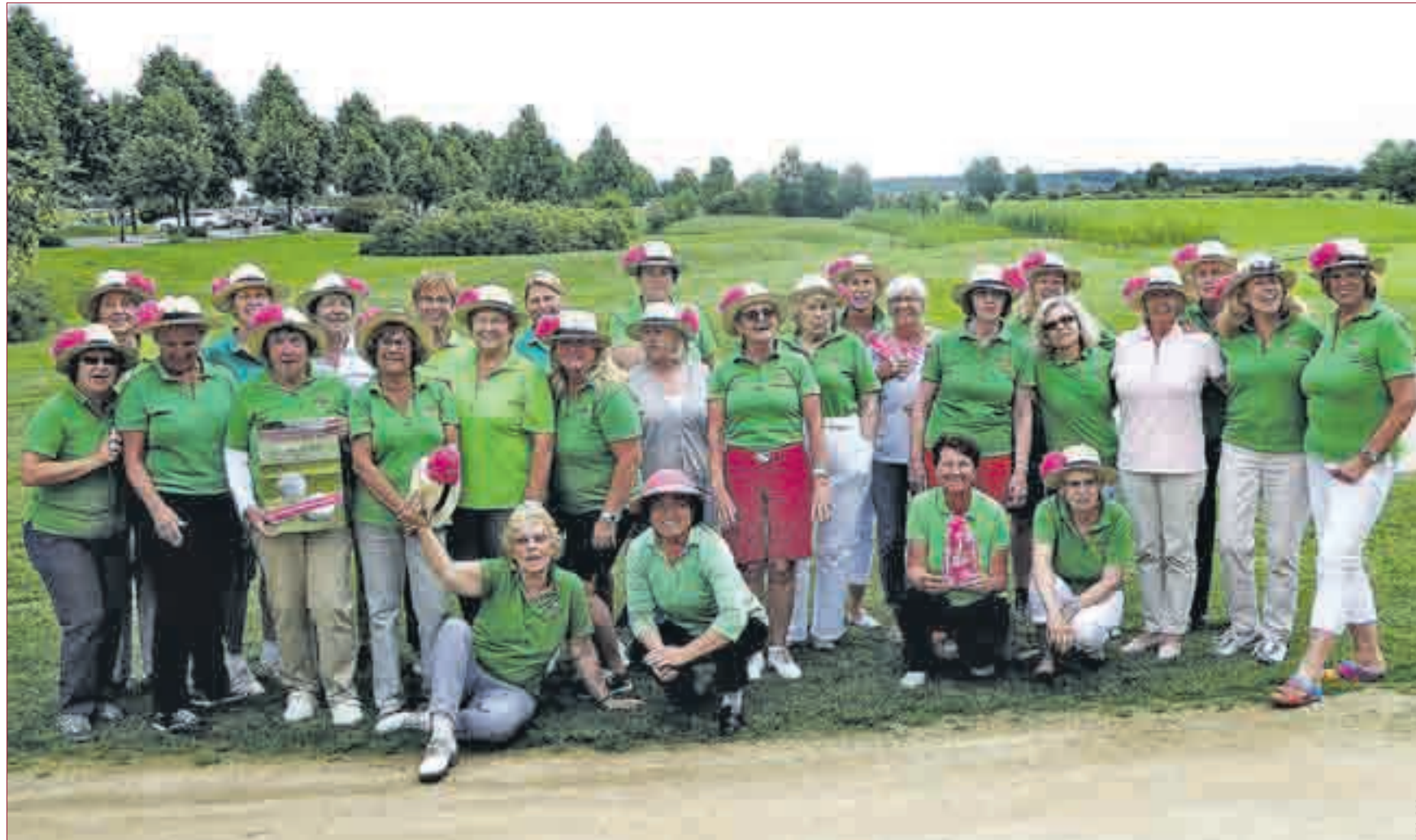
OPTIMALES GOLFWETTER im Kiawah Golf Park. 720 Euro wurden für Pink Ribbon Deutschland erspielt.

WÜRZBURG | Ende Mai fand im Kiawah Golf Park einer von insgesamt über 90 Pink Ribbon Deutschland Damentagen 2016 statt.