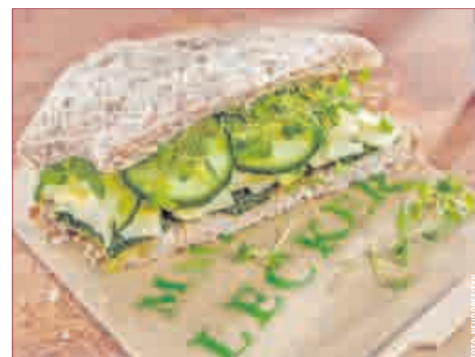
SANDWICH MIT GEHEIMZUTAT: Grünes Pesto aus eigenem Anbau eignet sich nicht nur als pikanter Brotaufstrich, sondern ist in der gesunden Küche vielfältig einsetzbar, wie z.B. zu Soßen, Salaten und Fleischgerichten.

ches: 1 Scheibe Vollkorn-Toast diagonal durchschneiden. Eine Hälfte mit 1 TL grünem Pesto bestreichen. 1 Scheibe Bergkäse in Streifen schneiden und auf dem Pesto verteilen. 1 Stück Salatgurke in Scheiben teilen und auf den Käse geben. Die andere halbe Toastscheibe oben drauflegen und bei Bedarf mit einem Holzspieß fixieren. Tipp: Die WildgärtnerGenuss Samenmischungen gibt es in acht verschiedenen Varianten. Als Topping für das Sandwich, aber auch für Pizzen und Fleischgerichte bieten sich die „Jungen Wilden“ an, die erntefrisch drübergestreut werden. Weitere Rezepte und Ideen finden sich unter www.neudorff-wildgaertner.de .