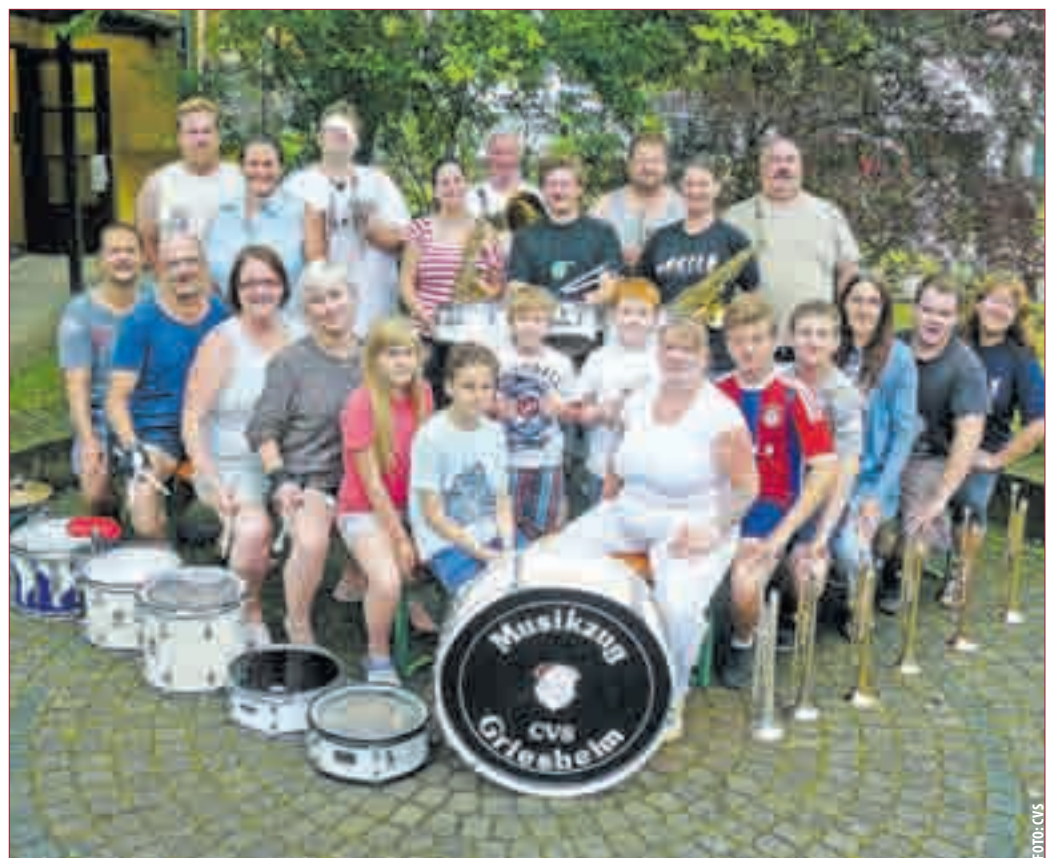
JEDE MENGE SPASS bei den Proben für die anstehende Kerbkampagne 2016/2017.