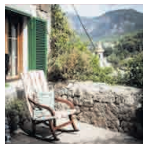
URLAUB von der Pflege für Angehörige.

den kann, damit die oder der pflegende Angehörige auch mal Urlaub von der Pflege machen kann. Anspruchsberechtigt ist jeder, der eine Pflegestufe hat (auch PS 0) und seit mindestens sechs Monaten von einer privaten Pflegeperson überwiegend betreut wird.