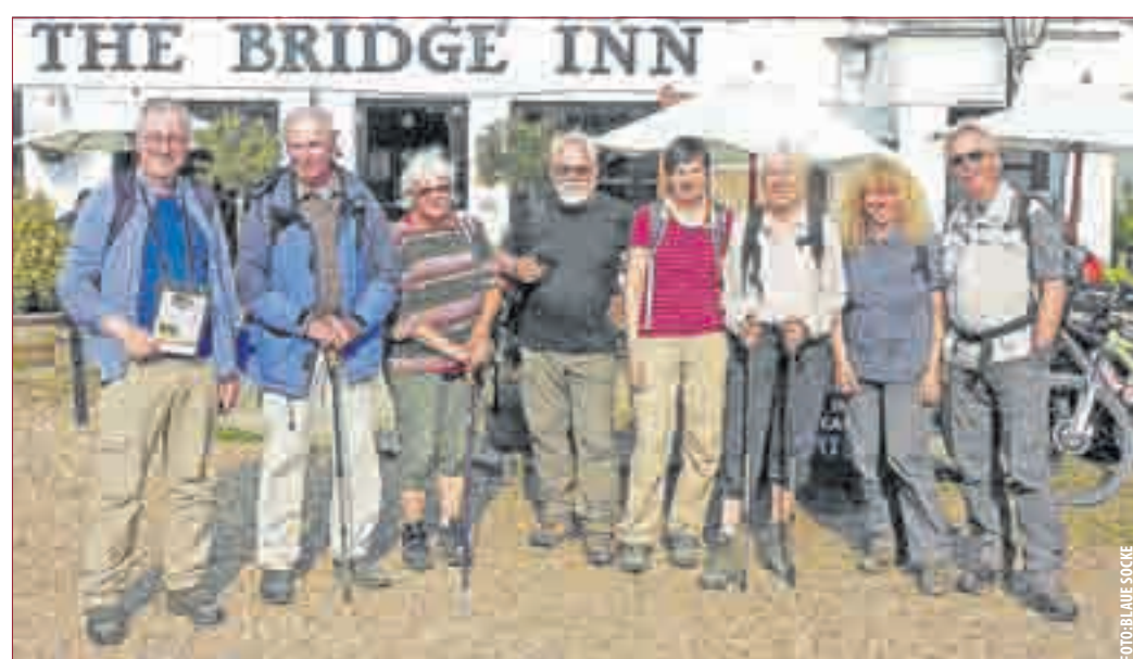
ENDE DER ETAPPE nach 209 km in Amberley/Sussex. Die Wandergruppe kehrte wohlbehalten mit guter Laune zurück.

th Downs National Park“ über die Strecke von 160 km bis nach Winchester führt. Auf diesem Weg sind wir ab jetzt geblieben und sind so die ersten 100 km dieses Fernwanderweges in Hastings, einer der vielen südeinglichen Badeorte mit einem zentralen in das Meer ragenden Pier und Hotels und Häusern vergangener Pracht von Ende des 19. Jahrhunderts. Von dort führte uns der Weg entlang der nun flachen Küste bis in den kleinen Ort Pevensey Bay. Am 5. Tag durchquerten wir dann auf der Uferpromenade die Stadt Eastbourne, den nächsten historischen Badeort mit einem zentralen Pier. Am Ende der Stadt begann der bekannter „South Downs Way“, ein südeinglicher Fernwanderweg, der von Eastbourne durch den gesamten „Sou-