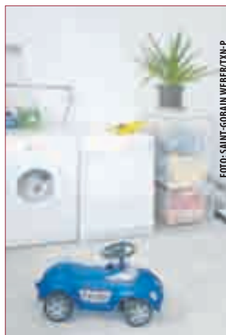
WERTVOLLER NUTZRAUM: Aus dem feuchten Keller wird dank Horizontalsperre und mineralischer Innendämmung wertvoller Nutzraum.

Wer ein älteres Haus besitzt, kennt ihn meist noch, den muffigen, feuchten und kalten Keller. Sogar leichten Schimmelbefall nehmen viele Eigenheimbesitzer hin - denn schließlich war das schon immer so. Eine fatale Entscheidung, denn Ge-