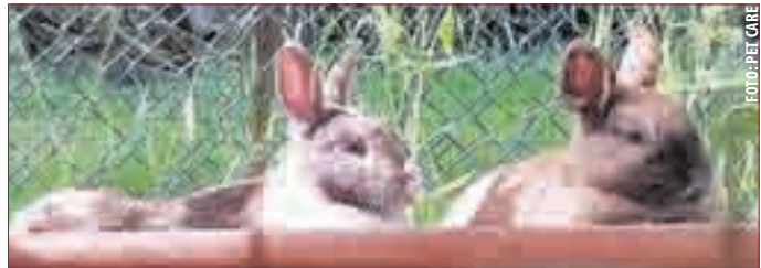
NEUES ZUHAUSE für Kaninchen auf „Bunnyland“ oder Vermittlung in artgerechte Tierhaltung, dieses Ziel verfolgt der Lebenshof.

kurzem in ein neues artgerechtes Zuhause umziehen. Doch es gibt auch traurige Fälle, wie die von „Keks“ und „Barny“ welche vor dem Tod als Schlachtenfutter gerettet wurden und nun schon seit August 2015 auf der Suche nach einem schönen Zuhause sind. Mit diesen beiden winzigen Kerlchen fing alles an, die Betreiber von Pet Care Modau GbR konnten das Leid der Kaninchen nicht länger mit ansehen und retten die beiden vor dem sicheren Tod und schon wenige Wochen später war der Kaninchenlebenshof in voller Planung. Nach langen Bauarbeiten und viel Bürokratie konnte der Lebenshof dann Anfang April endlich in Betrieb gehen. Der Kaninchenlebenshof finanziert sich ausschließlich durch Spenden und freiwillige Helfer, daher wird Hilfe immer benötigt. Wer mehr über dieses tolle Projekt erfahren möchte oder aktive bzw. passive Hilfe leisten will oder auch gerne ein Tier adoptieren möchte, kann unter: www.petcaremodau.de/Bunnyland weitere Informationen bekommen. (Pet Care)