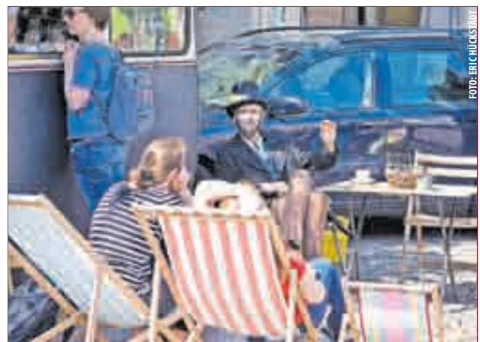
DATTERICH höchstpersönlich beim Fräulein Zuckertopf Team.

DARMSTADT | Am 04. Juni war wieder „Datterichs Wochenmarkt“. Von 8 bis 14 Uhr konnten am Stand der Firma Küchenmeister fachmännisch Messer geschliffen werden.