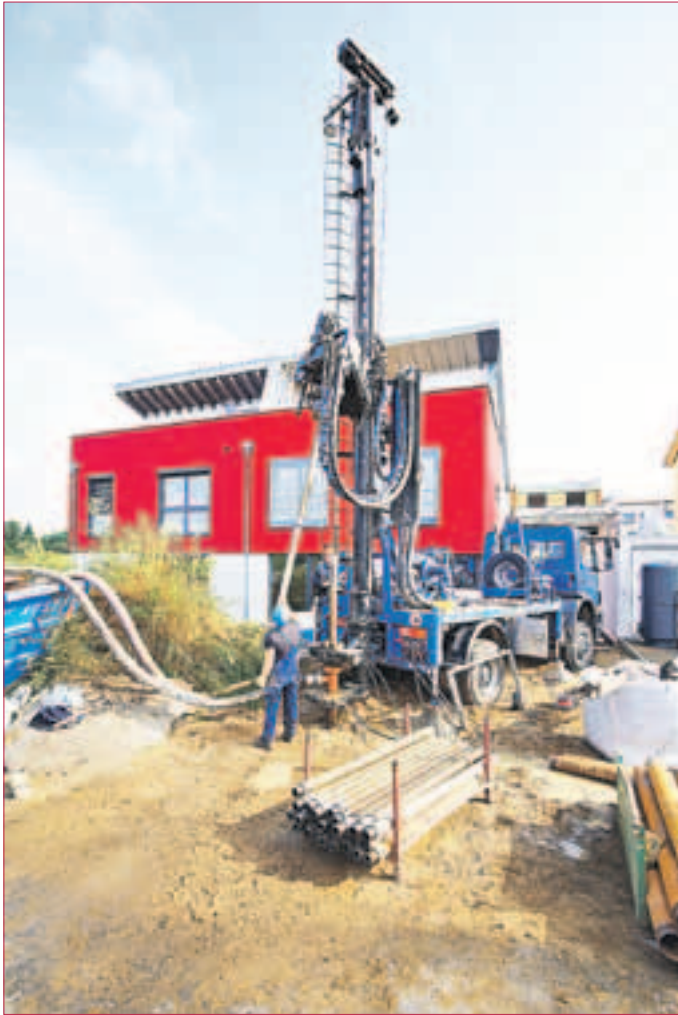
BOHRUNG für Vaillant.

Geothermie ist die Nutzung von Erdwärme. Erdwärme ist in Deutschland beinahe überall zugänglich. Unabhängig von Sonne, Wind, Wasser und nachwachsenden Rohstoffen ist Erdwärme mit einem überschaubaren Aufwand zu jeder Jahres- und Tageszeit zu gewinnen. Geothermie dient zur Strom-, Wärme- und Kälterzeugung. Unterschieden wird zwischen der oberflächennahen Geothermie und der Tiefengeothermie. Es beginnt mit einer sorgfältigen Planung sowohl bei Neubauten wie auch bei Bestandsbauten. Wie ernst auch die Regierung diese Energiequelle nimmt, zeigt sich auch daran, dass das BAFA (Bundesamt für Wirtschaft und Ausführungskontrolle) seit dem 1. April 2015 für