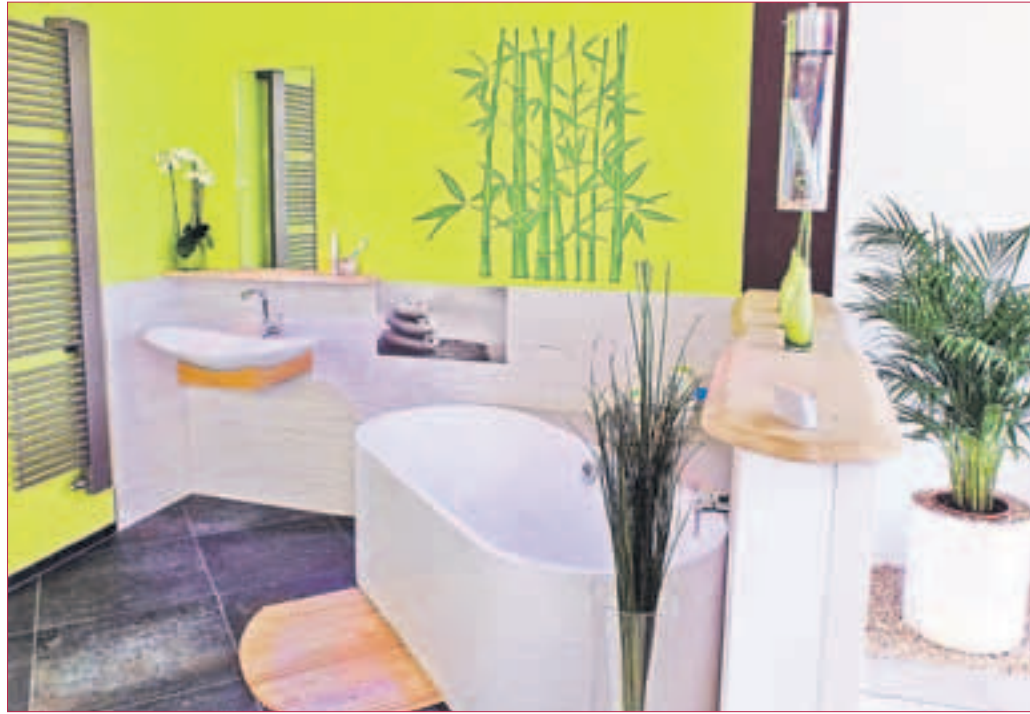
BÄDER IN VARIANTEN: Alt- oder Neubau, funktionelles Minibad, barrierefreies Badezimmer, luxuriöses Wohlfühl-Bad...