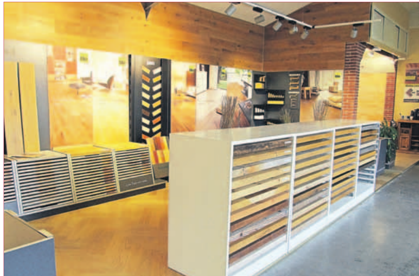
EIN BLICK in den Ausstellungsraum.