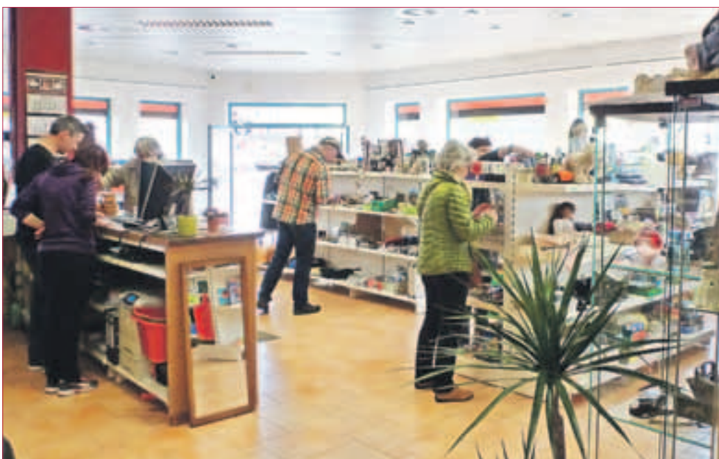
ANGEMIEETE REGALE: Hier stellen eine Menge Leute ihre Angebote aus und können sie außerdem ständig austauschen. Der Hol- und Bring-Service rundet das Angebot ab.