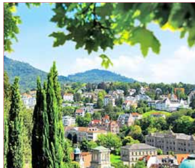
DIE STADTANSICHT VON BADEN-BADEN: Entdecken Sie die Schönheit der Region.

Außerdem ist ein Halbtagesausflug in den Schwarzwald, eine Ganztagesfahrt nach Straßburg mit Stadtführung, Besuch des Münsters und Bootsfahrt und einer Stadtführung in Baden-Baden geplant.