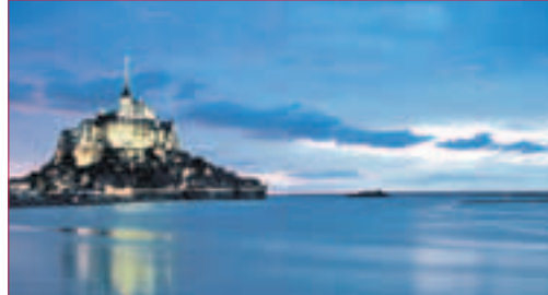
ROMANTISCHER FISCHEREIHAFEN in der Bretagne (Foto oben) MONT SAINT MICHEL (Foto unten)

Mit Gleichgesinnten im Bus zu verreisen hat seinen ganz eigenen Charme. Dabei spielt, neben einer perfekten Planung und Organisation auch ein abwechslungsreiches Programmangebot eine entscheidende Rolle. Was uns