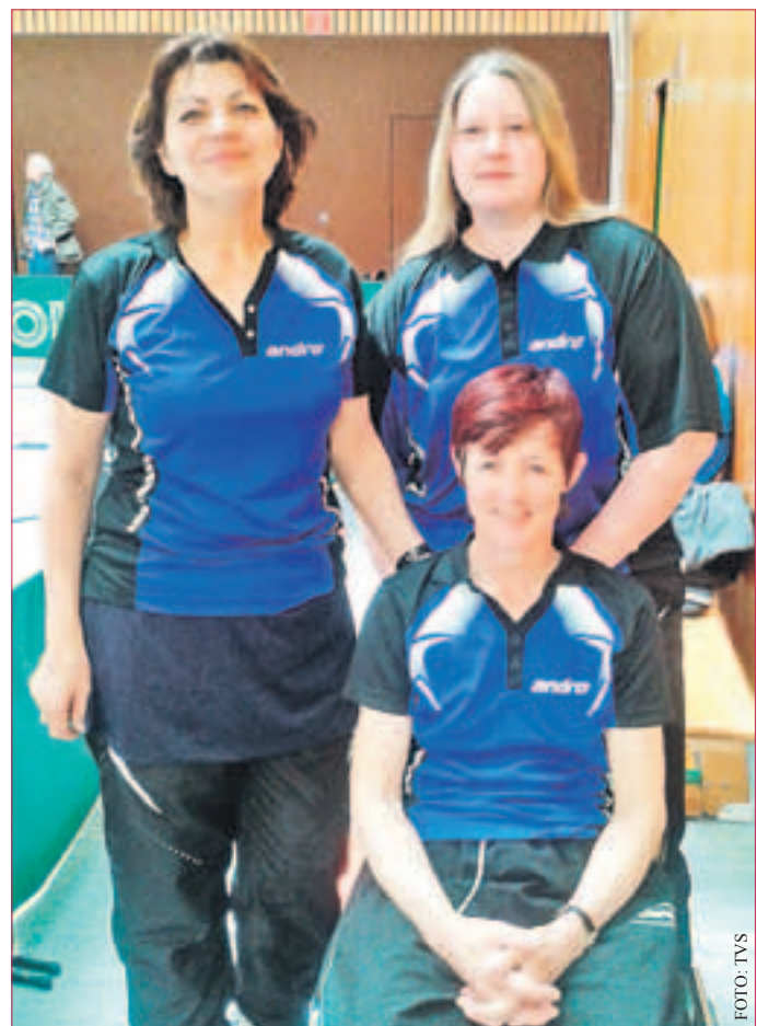
DIE TISCHTENNISDAMEN des Turnvereins Seeheim (TVS) gewannen am Wochenende beim Hessischen Pokalfinale in Lampertheim den Wettbewerb der Damen-zweiten Kreisklasse und den Hessenpokal. Damit qualifizierte sich der TVS für das deutsche Pokalfinale.

Die Seeheimer Bücherei verzeichnet 198 (im Vorjahr 186) neue Anmeldungen. Insgesamt gibt es 925 aktive Leser. Sie können aus 19.634 Medien wählen. Davon sind 377 DVD's und 605 Musikcassetten & CD's. Geliehen werden kann Gedrucktes aus den Bereichen Belletristik, Sachliteratur, Kinder-/Jugendliteratur, Zeitschriften. (fran)