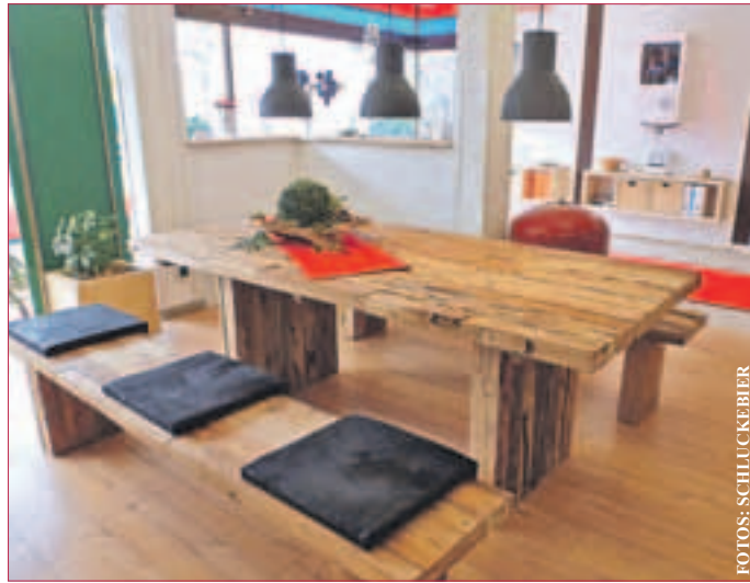
MASSGESCHNEIDERTE LÖSUNGEN sind Herausforderungen.

PFUNGSTADT-ESCHOLLBRÜCKEN. Das inhabergeführte, moderne Unternehmen im Handwerk der Heizungs-, Sanitär- und Klimatechnik besteht seit nunmehr fünf Jahren und ist für seine zuverlässige und fachgerechte Installation von Heizungs- und Sanitäranlagen im Rhein-Main Gebiet prädestiniert.