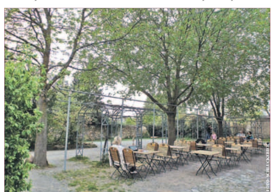
CAFÉGARTEN: Blick in den mit Bäumen und Strüchern bewachsenen Cafégarten „Haus der Vereine“ in Eberstadt

Verschiedene Angebote hält der Cafégarten in der Woche für den Gast bereit. So wird an jedem Dienstag eine Tasse Kaffee für 1,- € ausgedient und an jedem Montag und Donnerstag eine große Pizza (28cm Durchmesser) für 5,-€. Für zu Hause ist es auch jederzeit möglich, Pizza mitzunehmen.