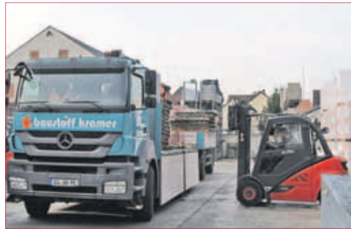
GESCHÄFTIG geht es zu auf dem Lagerhof.