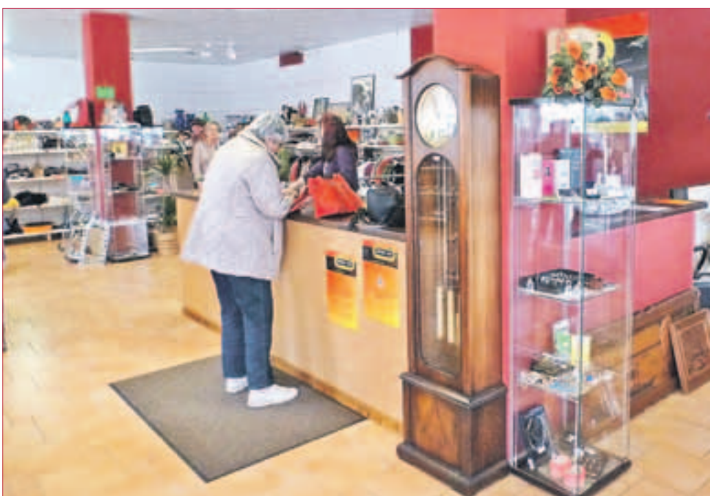
BRINGS-UNS IN GRIESHEIM: Das Geschäft bietet die unterschiedlichsten Angebote