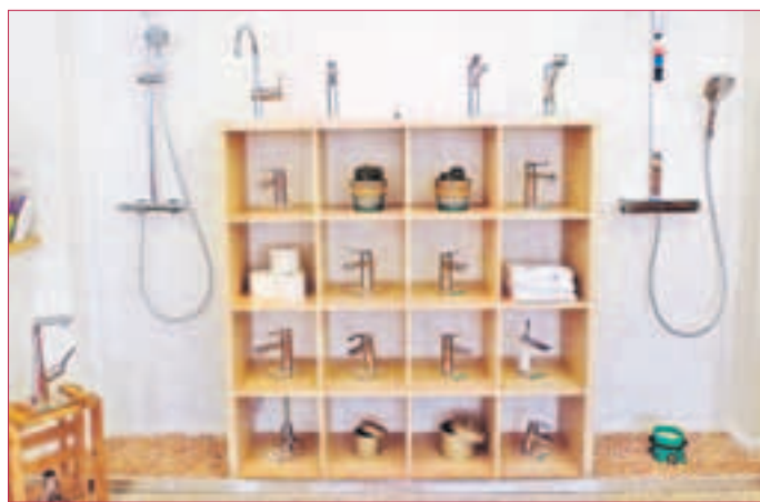
FAIRE PREISE, Know-How und fachgerechte Installation.