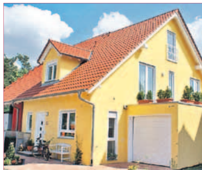
BEISPIEL EINES EINFAMILIENHAUSES , schlüsselfertig erstellt von der Schwager-Baubetreuung GmbH