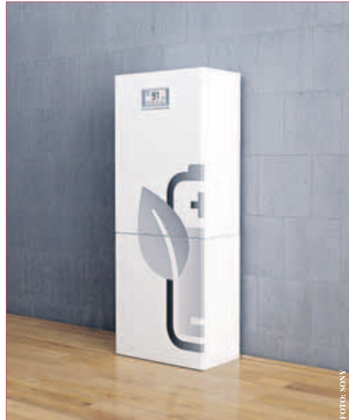
VERBINDUNG MIT EINEM MIKRO-BHKW: Eine wachsende Zahl von Kunden möchten ihre Wärme- und Stromerzeugung in die eigene Hand nehmen und ihre Photovoltaik-Anlage plus Speicher mit einem Mikro-BHKW verbinden.

die individuellen Bedürfnisse des jeweiligen Haushalts anpassen. Dank der Entladetiefe von 100 Prozent ist die gesamte Ladekapazität der Batterie nutzbar. Wie die vorhergehende Generation auch, erfüllt die neue Sonnenbatterie eco die Anforderungen des „Sicherheitsleitfadens für Li-Ionen-Hausspeicher“ und beweist somit ihre herausragende Sicherheit und Qualität.