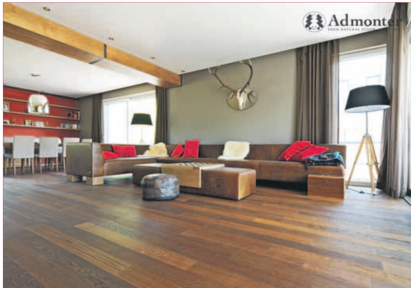
WUNDERVOLLES PARKETT: 2bond Eiche medium Deutschland.

richtigen Entscheidung. Und der Kunde bekommt leihweise große Muster, die er in seinem Heim prüfen kann. Manches sieht in den eigenen vier Wänden doch anders aus als beim Verkaufsgespräch. Eine gute zusätzliche Möglichkeit: es gibt einen Raumplaner online. Da sieht man, wie der Fußbodenbelag in verschiedenen Wohnsituationen wirkt. Bei einer Vor-Ort-Besichtigung wird sich viel Zeit genommen, um die optimale Vorgehensweise und Verlegung mit dem Kunden abzustimmen. – Der Schwerpunkt liegt hier bei Parkett gehobener Qualität. Verkauft und verarbeitet werden ökologische Produkte aus dem Euroraum. Selbstverständlich führt die Firma Untergrundarbeiten aller Art aus. Drei Mitarbeiter sind für die fachgerechte Verlegung zuständig.