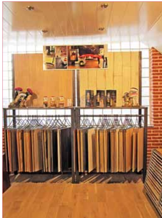
MUSTER in allen Variationen.

Gräfenhäuser Straße 55 64293 Darmstadt Tel. 06151-860300 Fax 06151-8603019 E-Mail kontakt@parkett-darmstadt.de Internet www.parkett-darmstadt.de