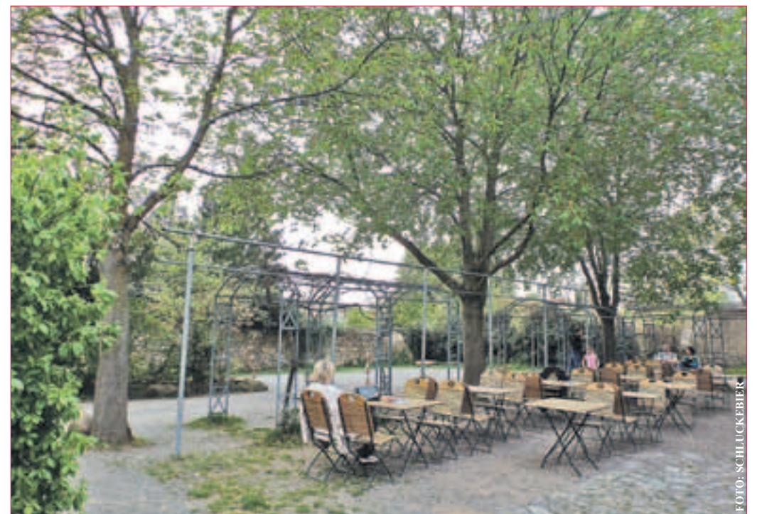
CAFÉGARTEN: Blick in den mit Bäumen und Sträuchern bewachsenen Cafégarten „Haus der Vereine“ in Eberstadt

Betti und Sakis Zisi Oberstraße 16 64297 Darmstadt-Eberstadt Öffnungszeiten: Montag – Samstag 16-22Uhr Sonntag und Feiertag 12-22Uhr Gasthaus „Zum goldenen Hirschen“ Heidelberger Landstraße 252 64297 Darmstadt-Eberstadt Tel. 06151-55979 Öffnungszeiten: Montag-Samstag 15-24Uhr Sonntag und Feiertag: 17-24Uhr