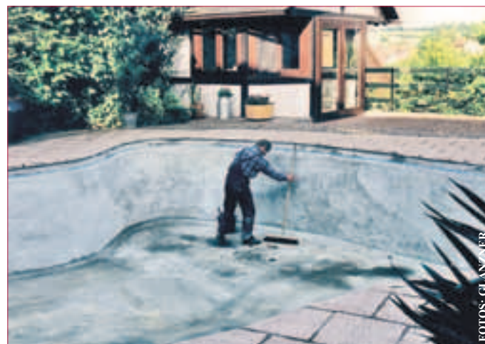
GRÜNDLICHE VORBEREITUNGEN zur Abdichtung werden vorgenommen.

Nummer 1 bei Schwimmbadsanierungen und lässt sich in jeder Beckenform aufbringen. Ob Fertig-, Metall- oder gar gemauerten Bassins sowie bereits gefliesten Becken, sie sind nach der Beschichtung garantiert dicht, egal ob Außen- oder Innenpool. Optisch bietet das Material große Vielfalt, denn beinahe jeder Farbton ist möglich und lässt selbst das veraltete Becken in neuem Licht erstrahlen. Da steht am Ende der Freude am nassen Sport nichts mehr im Wege. Die Sanierung verläuft nach einem einfachen Schema: Nach einer gründlichen Vorbereitung des Untergrundes wird eine GFK-Beschichtung aufgebracht. Sie verbindet sich mit dem Fundament. Es ist ein Verfahren, das in etlichen weiteren Bereichen zum Einsatz kommt, z.B. wenn Terrassen, Balkone oder Garagendächer undicht sind. Selbst in der Industrie hat sich die GFK-Beschichtung be-