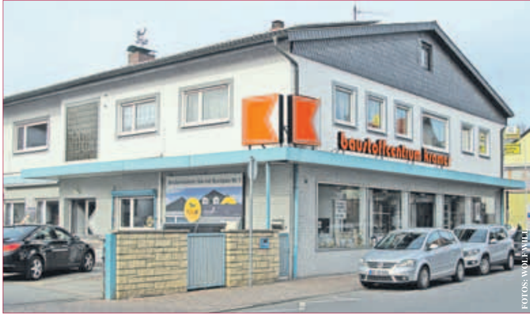
ZENTRAL GELEGEN: in der Ortsmitte von Crumstadt befindet sich das Firmengebäude.