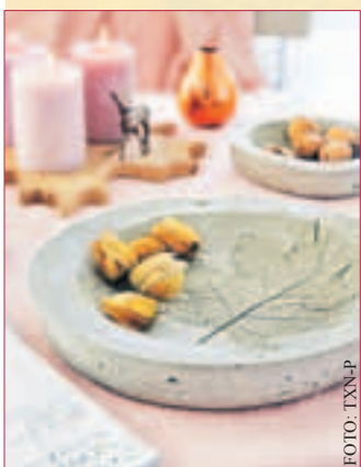
ECHTER HINGUCKER: Schale in Steinoptik mit Blattmaserung ist einfach anzufertigen.

Mit einem doppelseitigen Tesaklebeband werden ein oder mehrere Blätter mit schön ausgeprägter Blattstruktur von unten an den Boden der kleineren Schüssel geklebt. Dann beide Schüsseln mit Speiseöl bestreichen – die größere von innen, die kleinere von außen, damit sie sich später gut lösen. Blitzbeton nach Anleitung anrühren und die Masse sofort in die größere Schüssel geben. Anschließend die kleine Schale mit dem aufgeklebten Blatt mittig darauf setzen und circa zwei Minuten festhalten, bis die Masse zu trocknen beginnt. Ist der Beton durchgetrocknet, kann er als fertige Schale aus der Form genommen werden. www.tesa.de/ideen . (tm-p)