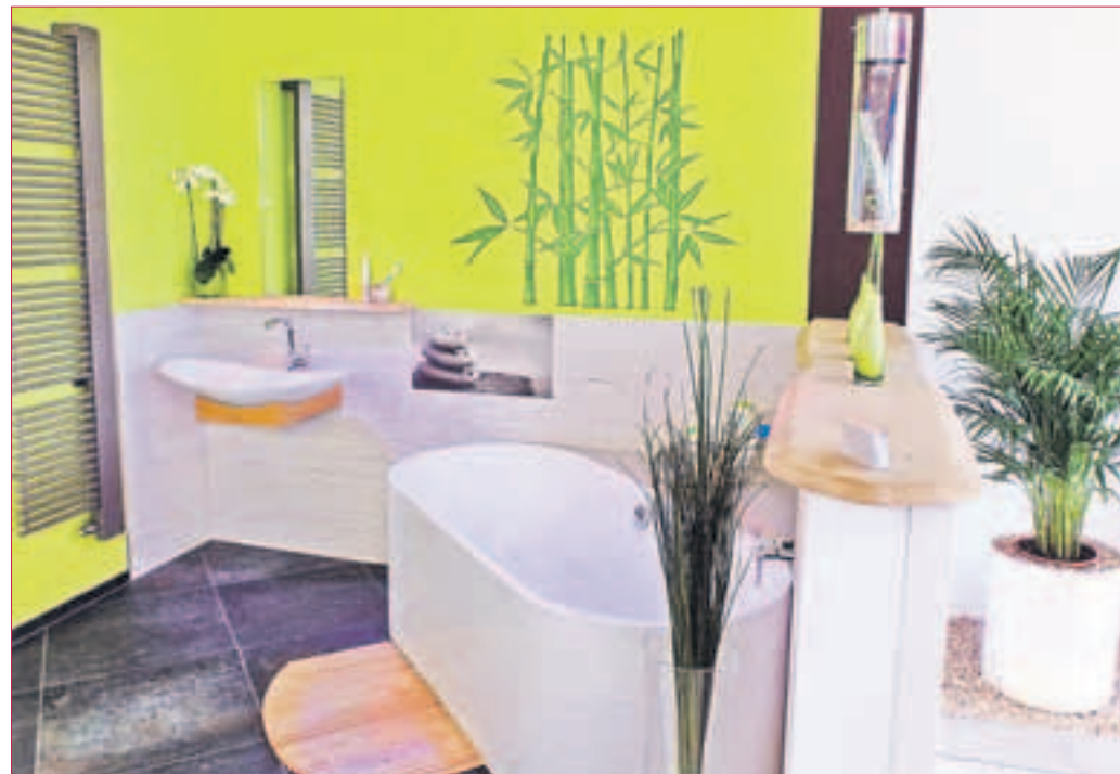
BÄDER IN VARIANTEN: Alt- oder Neubau, funktionelles Minibad, barrierefreies Badezimmer, luxuriöses Wohlfühl-Bad...