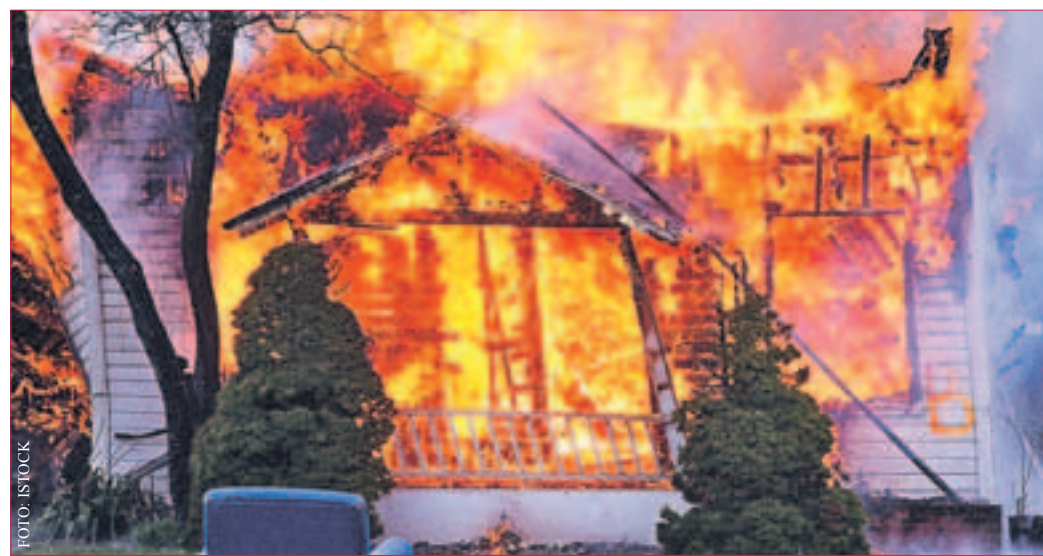
RAUCHMELDER SIND PFLICHT: Die Gefahr liegt im Rauch, nicht in der Flamme. Drei bis sechs Atemzüge können schon tödlich sein.