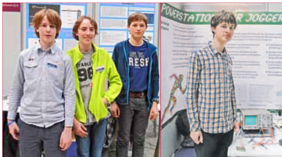
4 GRUPPEN DES SCHULDORFS BERGSTRASSE qualifizierten sich für den Landeswettbewerb, der auch dieses Jahr wieder bei der Firma Merck in Darmstadt ausgetragen wurde.

Mit 4 Beiträgen im Landeswettbewerb Jugend forscht dabei