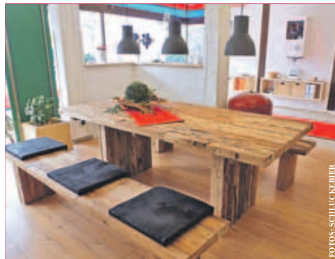
MASSGESCHNEIDERTE LÖSUNGEN sind Herausforderungen.

PFUNGSTADT-ESCHOLLBRÜCKEN. Das inhabergeführte, moderne Unternehmen im Handwerk der Heizungs-, Sanitär- und Klimatechnik besteht seit nunmehr fünf Jahren und ist für seine zuverlässige und fachgerechte Installation von Heizungs- und Sanitäranlagen im Rhein-Main Gebiet prädestiniert.