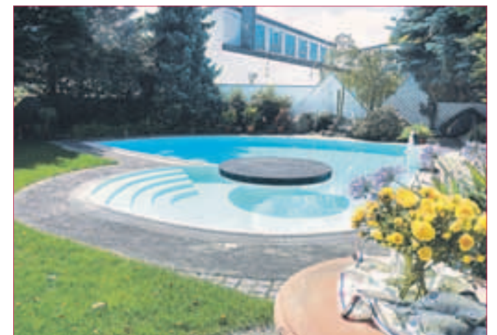
DAS SCHMUCKSTÜCK Ihres Hauses lädt ein zum Relaxen