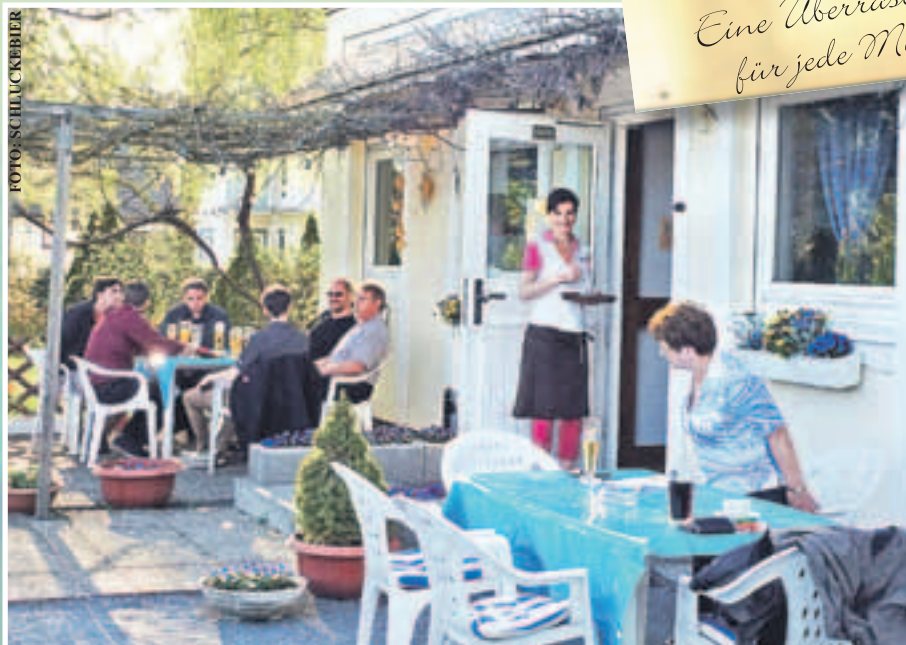
GROSSE TERRASSENFLÄCHE in Grün mit dem Blick auf die Bergstraße vor dem Lokal.

Am Muttertag: Eine Überraschung für jede Mutti!