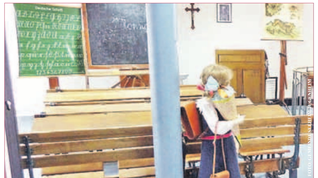
DIE SPANNENDE BILDUNGSGESCHICHTE darzustellen, ist ein Teil des Auftrags und der Ziele des neuen kommunalen „Schulmuseum Seeheim-Jugenheim“.

Das Schulmuseum ist sonntags von 15 bis 17 Uhr geöffnet. Gruppenführungen können auch zu anderen Zeiten unter 06257- 82468 bzw. info@museumbergstrasse.de vereinbart werden.