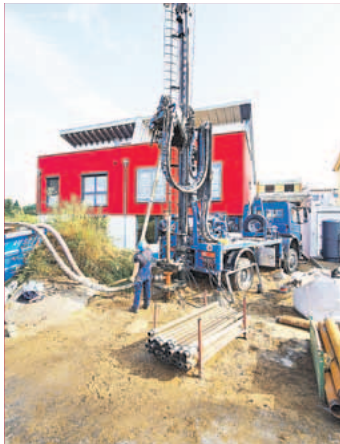
BOHRUNG für Vaillant.