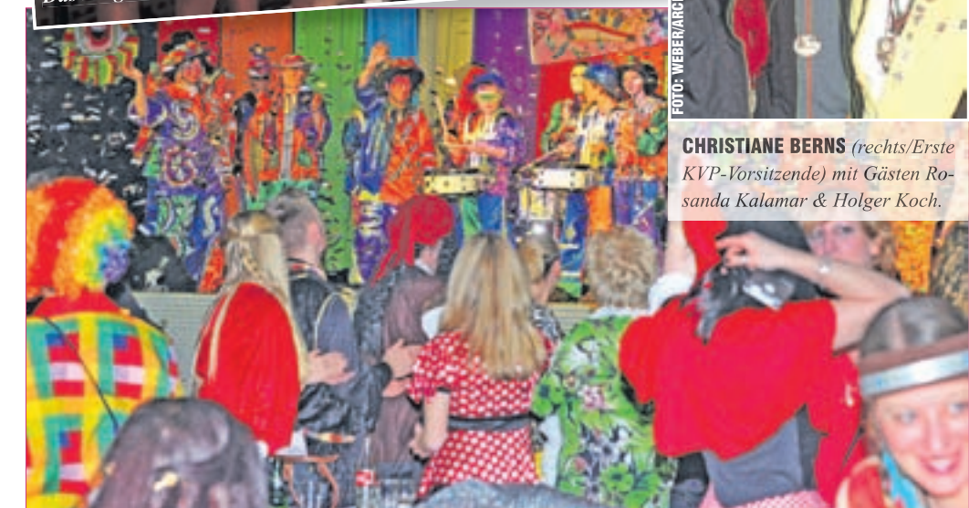
Die MODAUCHAOTEM bringen Stimmung in den Saal

ist Rosenmontagszug in Wiesbaden/Frauenstein von 13:11-17:11 Uhr. Die Aufstellung zum Umzug um 11:45 Uhr ab Sportplatz Frauenstein.