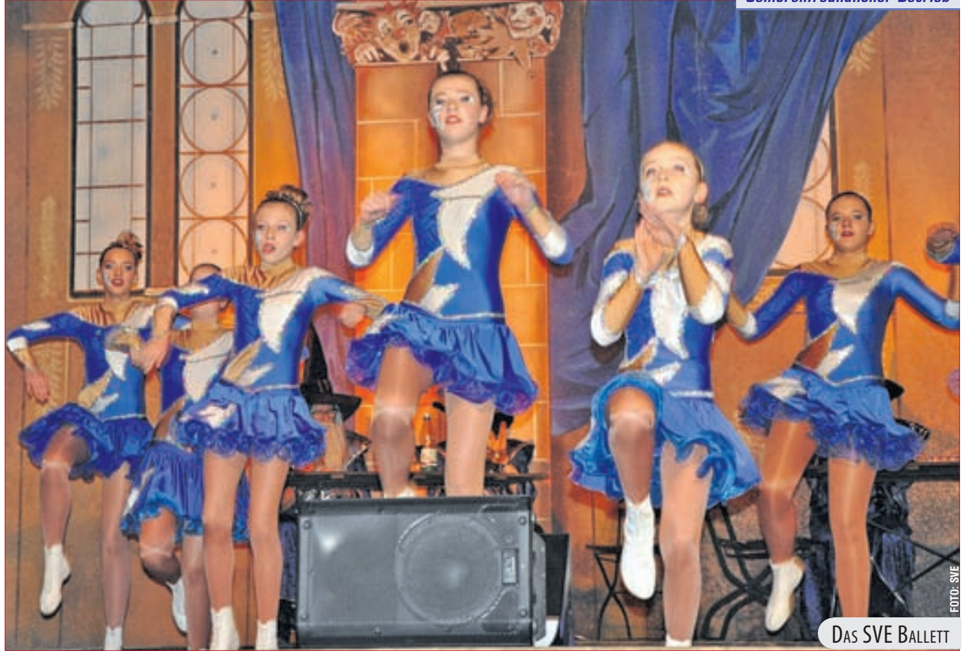
DAS SVE BALLETT