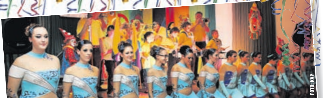
VOM GARDETREFFEN bis zur Fastnachtsbeerdigung: Das Programm der KVP - mit dabei sein ... des is scheee!