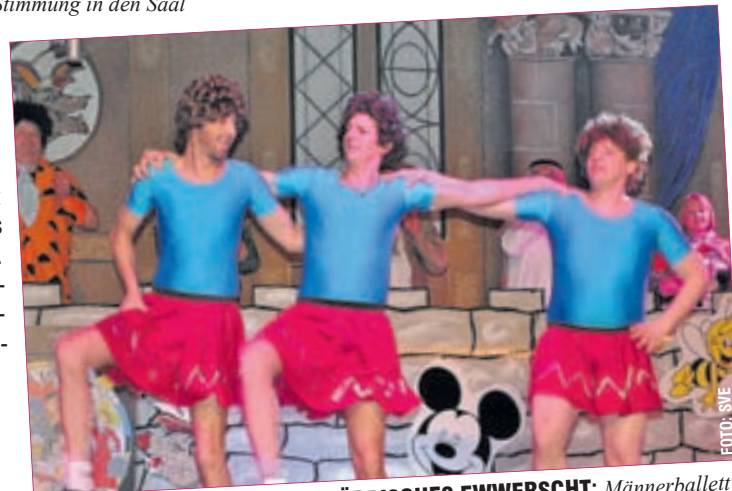
NÄRRISCHES EWVERSCHT: Männerballett

Am Di, den 9. Februar, ist Fastnachtsumzug von 14:00 bis 16:00 Uhr in Erbach im Odenwald. Am Sa., den 20. Februar ist KVP-Heringsessen mit Fastnachtsbeerdigung im Pfungstädter Mühlbergheim. Info: www.kvp-1901.de .