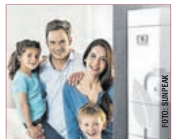
EXTRA LANGE LEBENSDAUER von 10.000 Ladezyklen macht Ihr Zuhause fit für die Zukunft.

umsonst eines der marktführenden Speichersysteme in Deutschland. Einstiegspreis ab 5.475 Euro inkl. Mehrwertsteuer | Extra lange Lebensdauer von 10.000 Ladezyklen | Komplettes und anschlussfertiges Speichersystem | 10 Jahre Garantie auf alle Teile* | Sichern Sie sich jetzt noch die Speicherförderung der KfW