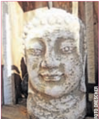
DER WEG ist oft das eigentliche Ziel und dazu gehört der erste gestaltete Schritt.

äußern. Ebenfalls zu berücksichtigen sind auch seelische Belastungen, die sich ebenfalls negativ auf