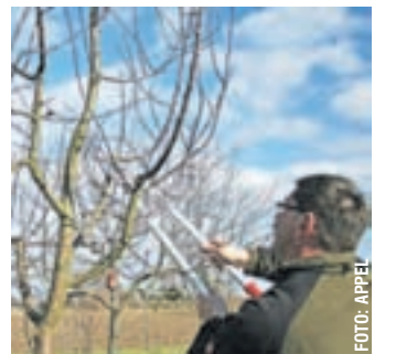
EIN SCHNITT muss immer überlegt durchgeführt werden.

fördern? Was bedeutet organisch düngen? Am 05.03. folgt dann das nächste Seminar von „Gärtnern für Anfänger – Frühlingsarbeiten“. Die erste Frühlingssonne lockt in den Garten. Welche Arbeiten bereiten meinen Garten auf einen pflegeleichten Sommer vor? Höchste Zeit für Sträucherschnitt, Stauden teilen,