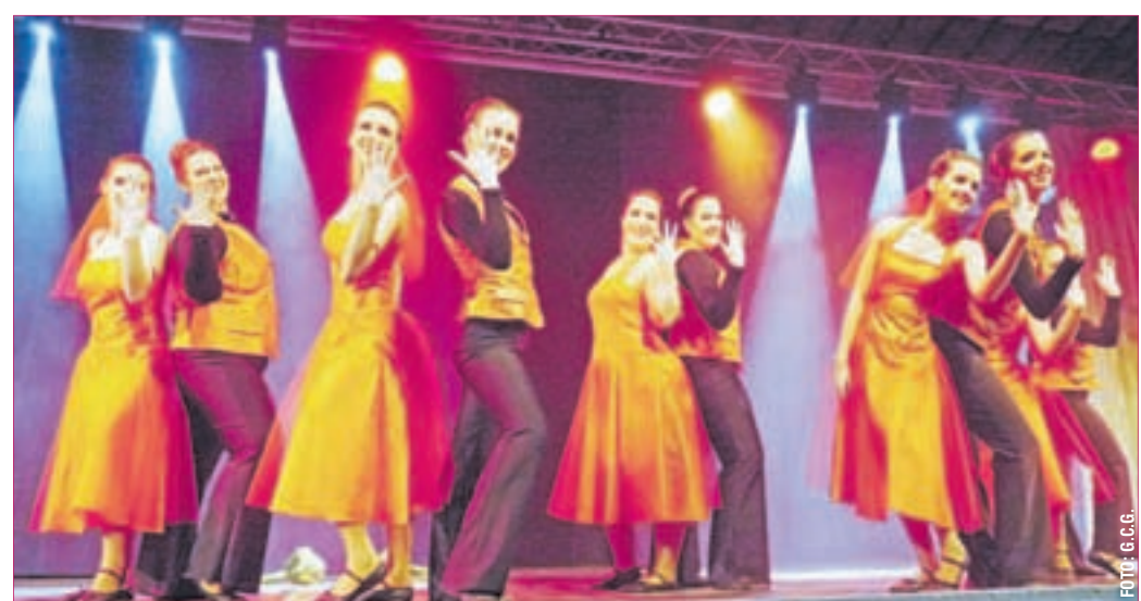
Flying Steps beim Schautanz der G.C.G.

nicht alle reservierten Karten benötigt werden, muss dies bis spätestens einen Tag vor dem ersten Ausgabetermin gemeldet werden. Ansonsten müssen alle Karten bezahlt werden. In allen Vorverkaufsstellen können die Karten nur per Barzahlung erworben werden.