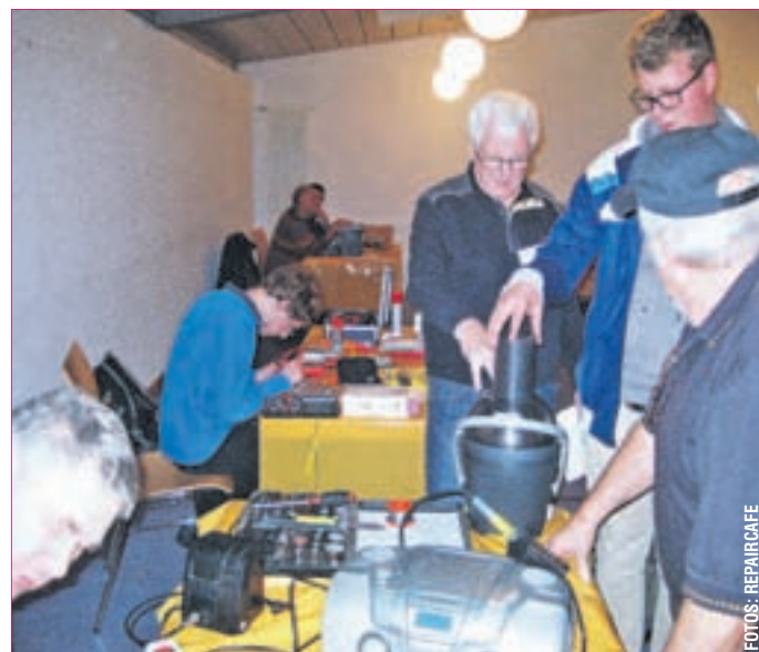
EHRENAMTLICHE „EXPERTEN“ sind gerne behilflich.

PFUNGSTADT/ESCHOLLBRÜCKEN. Wieder gut besucht war am Samstag, 19. Dezember 2015 von 15 bis 18 Uhr das Repair-Café im Bürgerheim Eschollbrücken.