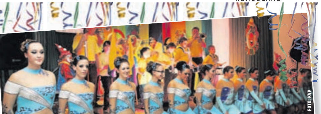
VOM GARDETREFFEN bis zur Fastnachtsbeerdigung: Das Programm der KVP - mit dabei sein ... des is scheee!