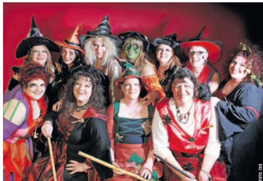
KURZE NÄRRISCHE CVS-KAMPAGNE: Die Kinderfastnacht findet vom 7.-9. Feb. 16 in der Hegelsberghalle Griesheim jeweils 15 Uhr mit Kinderanimationen statt. Das Foto zeigt die Damen11er, die bereits am 08. Januar 2016 mit der 4. Damensitzung starteten. Der CVS freut sich auf eine kurze aber umso närrischere Kampagne und auf viele Fastnächter, die man in der Hegelsberghalle begrüßen darf. Mehr Info zu den Veranstaltungen des Tanzsport- u. Carneval Verein St. Stephan erhalten Interessierte auf www.cvs-griesheim.de .