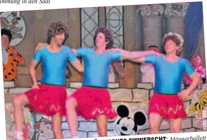
NÄRRISCHES EWVERSCHT: Männerballett

Am Di, den 9. Februar, ist Fastnachtsumzug von 14:00 bis 16:00 Uhr in Erbach im Odenwald. Am Sa., den 20. Februar ist KVP-Heringsessen mit Fastnachtsbeerdigung im Pfungstädter Mühlbergheim. Info: www.kvp-1901.de .