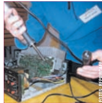
ALLTAGSGEGENSTÄNDE werden in angenehmer Atmosphäre gemeinschaftlich repariert.

Repair Cafés, Reparatur-Initiativen oder auch Reparatur-Treffs organisieren Veranstaltungen, bei denen defekte Alltagsgegenstände in angenehmer Atmosphäre gemeinschaftlich repariert werden. Elektrische und mechanische Haushaltsgeräte, Unterhaltungselektronik, aber auch Textilien, Fahrräder, Spielzeuge und andere Dinge. Neben einem Bügeleisen und einer Nachttischlampe konnten einige andere Geräte durch ehrenamtliche „Experten“ repariert werden. Auch eine „antike“ elektrische Schreibmaschine wurde zur Reparatur gebracht. Auch hier konnte der