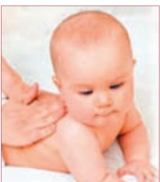
BETREUUNG in der Schwangerschaft

Jeden ersten Dienstag im Monat informiert das Mutter-Kind-Zentrum in einem einleitenden Vortrag über das Spektrum der geburtshilflichen Abteilung der Frauenklinik. Ärzte, Hebammen, Kinderärzte und Kinderkrankenschwestern sprechen über die Betreuung in der Schwangerschaft, unter der Geburt und im Wochenbett. Außerdem wird das Kurs-