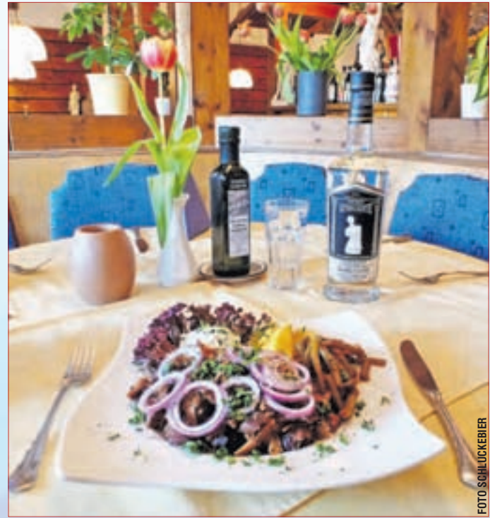
GYROS AM DREHSPIESS: kosten Sie unbedingt diese Spezialität des Hauses!

Restaurant Afrodite | Familie Arabatzis Rheinstraße 40 64665 Alsbach-Hähnlein OT Sandwiese Telefon: 06257-7908