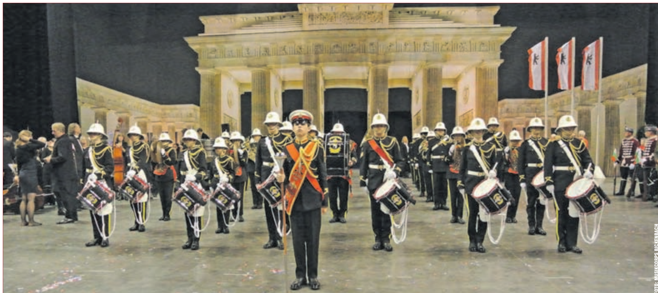
Gänsehaut garantiert: Zuletzt hatte das Musikcorps Bickenbach Auftritte beim Loreley Tattoo 2015. Es präsentiert vor heimischem Publikum ihre neue Show unter dem Motto „Everybody Needs Somebody“.