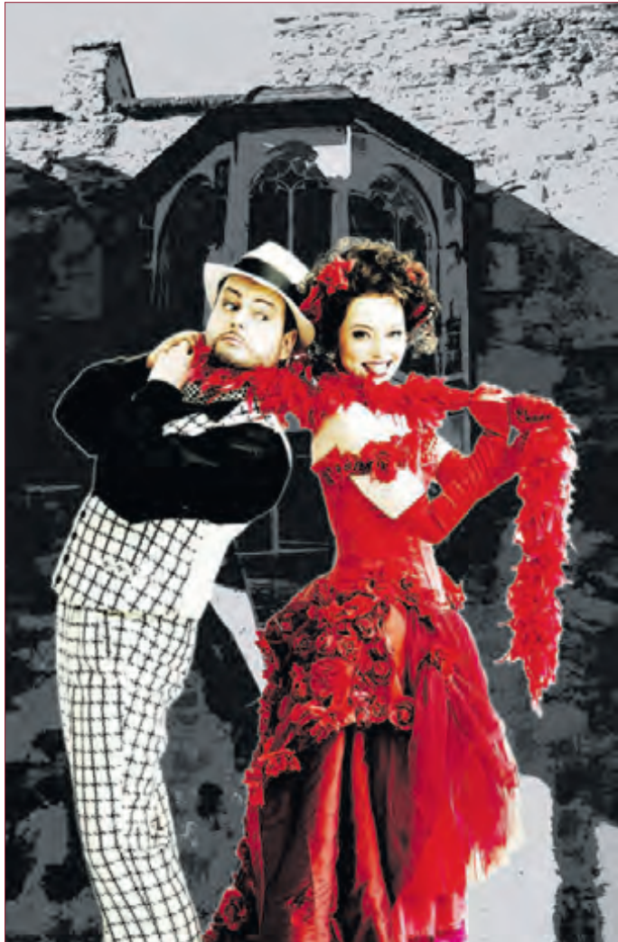
ANMELDUNGEN sind ab Anfang März möglich mittels der ausgelegten Flyer und über die Homepage www.kumani-web.de sowie ab sofort per Telefon unter der Rufnummer 06157-6322 und per Mail an info@kumani-web.de.

Für 75,00 Euro werden geboten Karten der besten Kategorie I, die bei Schlechtwetter zum Wechseln in den Saal berechtigen, die Fahrt im modernen Bus, die Stadtführung in Ladenburg, die Auf- und Abfahrt zum und vom Schloss mit der Bergbahn sowie ausreichend Pausenzeiten. Die Abfahrt vom Parkplatz am Bahnhof Pfungstadt ist um 14.00 Uhr, die Rückkehr wird etwa um Mitternacht erwartet. Anmeldeschluss ist der 12. April 2017. Bis dahin ist auch die Anzahlung von 50,00 Euro je Person zu leisten. Die Mindestteilnehmerzahl beträgt 30 Personen; sollte sie nicht erreicht werden, wird die Anzahlung umgehend zurück erstattet.