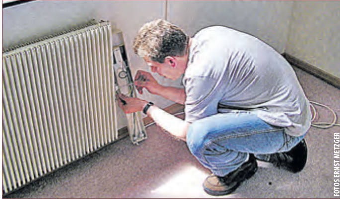
MONTAGE VOR ORT: Innerhalb eines Tages ohne Baustelle.

stützung, auch sog. „Infrarotstrahlung“) erhält, als es mit alten Nachts-