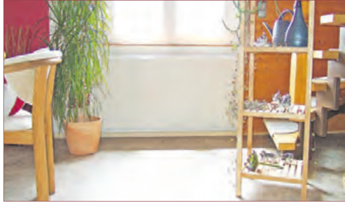
OPTISCH MODERNE, sparsame und hocheffiziente Elektroheizung.