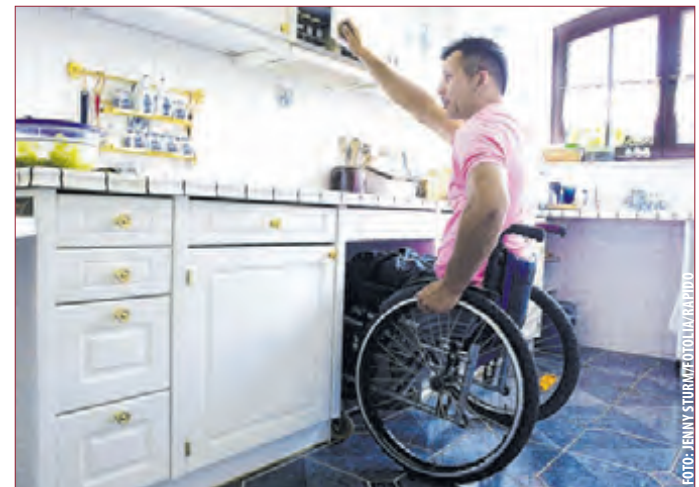
WOHNKOMFORT AUCH FÜR ÄLTERE UND KRANKE: vor allem die Unterschränke in der Küche sind für viele ein Problem, die sich tief bücken oder sogar hinknien müssen. Abhilfe schaffen nachrüstbare Schubladen von Rapido, die den Alltag in der Küche deutlich einfacher machen. (tm)

Weitere Informationen bietet ein ausführliches eBook, das unter www.rapido-schubladen-shop.de gratis zum Download zur Verfügung steht. (tm)