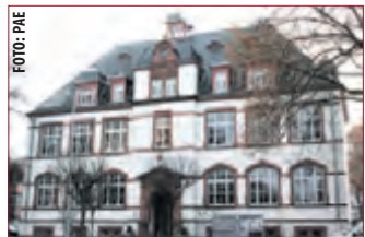
SEIT 40 JAHREN ist die alte Seeheimer Schule Rathaus für die Großgemeinde Seeheim-Jugenheim.

SEEHEIM-JUGENHEIM | Mit dem 40. Geburtstag der Großgemeinde begann das neue Jahr. Am 1. Januar 1977 trat die bis dahin größte Gebietsreform Hessens in Kraft. Die beiden selbstständigen Gemeinden Seeheim und Jugenheim wurden zur Gemeinde Seeheim vereint. Nachdem die Zeiger der Uhren in der Silvesternacht 1976/1977 auf 0 Uhr sprang, hatten alte Postleitzahlen und Orts-schilder ausgedient. Vieles musste neu organisiert werden: Die Gemeindeverwaltungen wurden zusammengelegt, Wahlen für die neue Gemeindevertretung mussten vorbereitet und die Skeptiker überzeugt werden. Zwischen Weihnachten und Sylvester 1976 wurde die Jugenheimer Verwaltung in das Seeheimer Rathaus eingegliedert. Die neue Gemeinde umfasste jetzt die ehemals selbstständigen Gemeinden Seeheim und Jugenheim und die Ortsteile Malchen, Ober-Beerbach, Steigerts, Stettbach