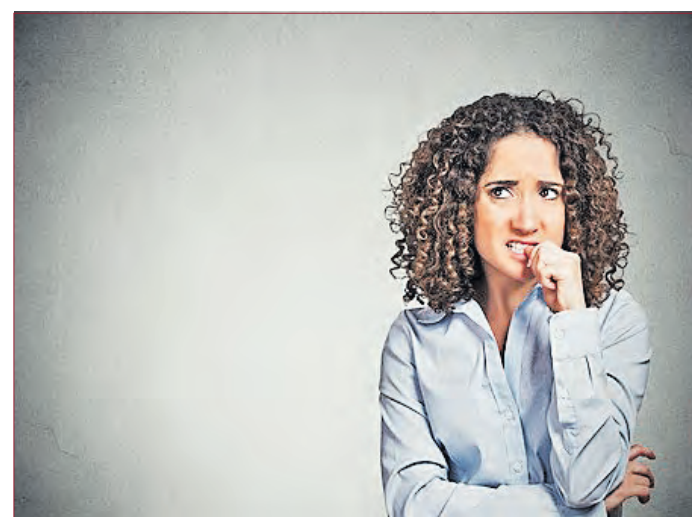
WENN STRESS über das Wissen siegt.