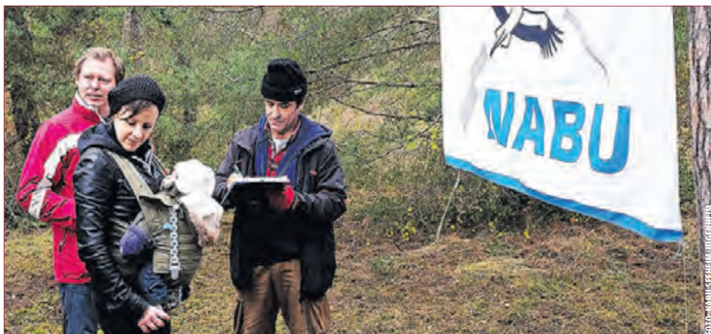
MIT VIELEN HELFERN wurde das mühsame Geschäft zum ersten Mal umsetzbar.

Mit der Ausstellung wollen sie die Besucher auf Entdeckungen in nahe und ferne Länder und Kulturen mitnehmen. Zu sehen ist die Bilderschau zu den Öffnungszeiten der Bücherei: Mi. von 9-11 Uhr und 16-19 Uhr sowie Do. von 14.00-18 Uhr. Der Eintritt ist frei. Letzter Ausstellungstag ist der 30. März. (Frankensteiner)