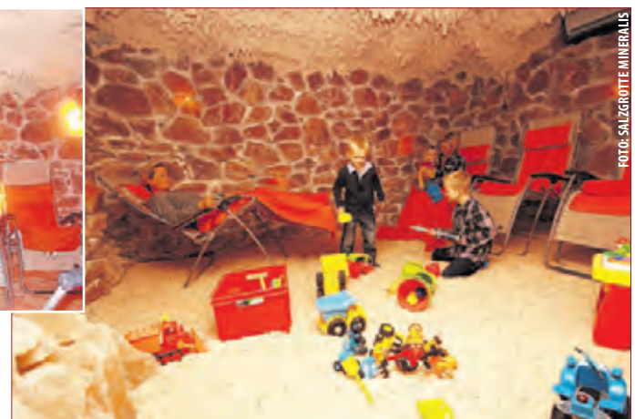
KINDER-SALZGROTTE mit viel Platz und Spielzeug für die Kleinen.

SALZGROTTE ÖFFNUNGSZEITEN: Montags bis freitags von 9:00 bis 11:00 Uhr und von 16.00 bis 19:00 Uhr. MASSAGE: erfolgt an Wochenenden. FUSSPFLEGE: Mobil 0152-34026204.