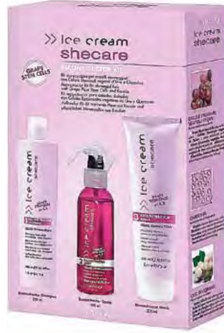
DAS GESAMTE SER FÜR SIE ZU HAUSE: Für 34,95 € können Sie Ihr Haar auch zu Hause verwöhnen.

Kommen Sie vorbei und tun Sie Ihrem Haar etwas Gutes! (Gina Pfau)