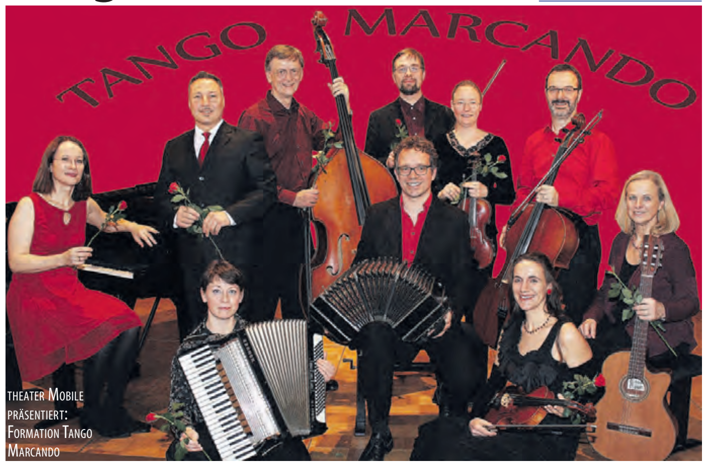
THEATER MOBILE PRÄSENTIERT: FORMATION TANGO MARCANDO