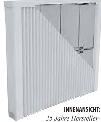
INNENSICHT: 25 Jahre Herstellergarantie auf Heiz- und Speicherelemente.