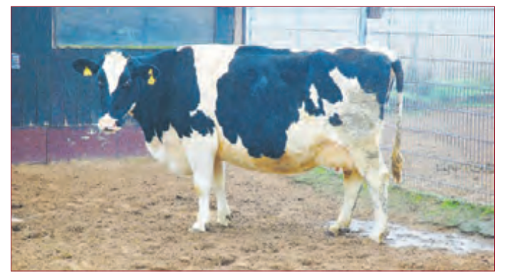
SCHNUCKEL geht's richtig gut auf der Keller Ranch.

woch, Samstag: 14 bis 16 Uhr, Sonntag: 10 bis 11.30 Uhr. Spendenkonto: Frankfurter Volksbank eG, IBAN: DE 6350 1900 0000 0045 8970, BIC: FVBDEFF (Ingrid Gänkel)