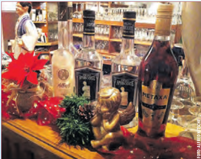
GYROS AM DREHSPIESS: Kosten Sie unbedingt diese Spezialität des Hauses!

Eine Tisch-Reservierung unter der Rufnummer 06257-7908 ist insbesondere für die Zeit um Ostern sehr zu empfehlen, denn wir rechnen wieder mit einem großen Zuspruch für unsere jahreszeitlichen Spezialitäten, mit denen wir Sie wieder überraschen wollen. Sie haben etwas zu feiern und scheuen den Stress des „do-it-yourself“? Kein Problem mit dem Team des Restaurants Afrodite . Denn auch im Nebenraum für geschlossene Gesellschaften erwarten Sie die gleichen hausgemachten und frisch zubereiteten Köstlichkeiten mit den passenden Getränken wie im Restaurant selbst. Entspannt die Seele bau-