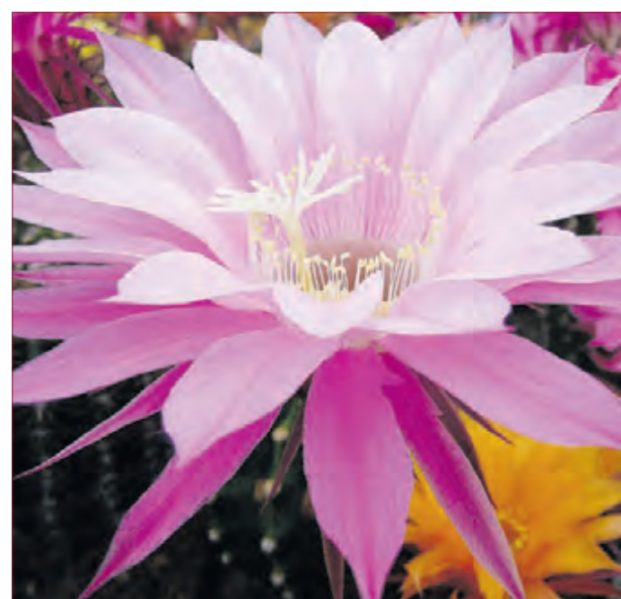
ARBEITS- UND REFLEXIONSEBENE als Methode für jeden Einzelnen, der sich mit seinen Problemen und Konflikten auseinandersetzen möchte.