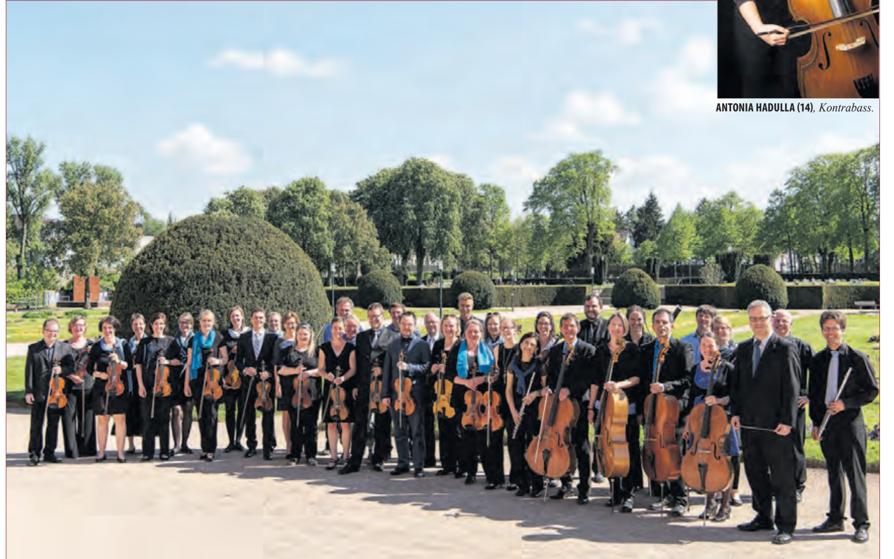
KAMMERORCHESTER-TU DARMSTADT im Darmstädter Orangeriegarten.