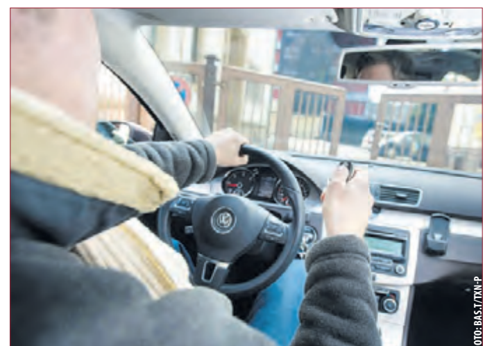
GARAGEN- UND HOFTORE mit einem Antrieb nachzurüsten, ist ein günstigerer Weg zu mehr Komfort als die bestehende Anlage komplett auszutauschen.