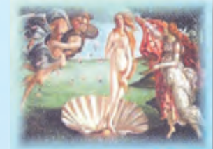
Ein Stück Griechenland ganz in Ihrer Nähe. Hier können Sie die Sorgen des Alltags vergessen.

Griechische Spezialitäten Restaurant Afrodite - seit 1989 - mit großem naturschönen Biergarten