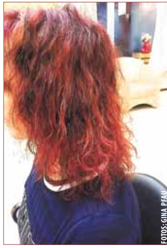
DIE LEICHTE DAUERWELLE wird wieder zum Trend. Die unterschiedlichen Intensitäten der Wellen können Sie selbst bestimmen.

Ca. 3 Monate werden die Locken/Wellen sichtbar sein. Der große Vorteil einer Dauerwelle ist der natürliche und gepflegte Look. Wenn Sie also Lust auf was Neues haben, sind Sie bei Inhaberin Frau Stork und ih-