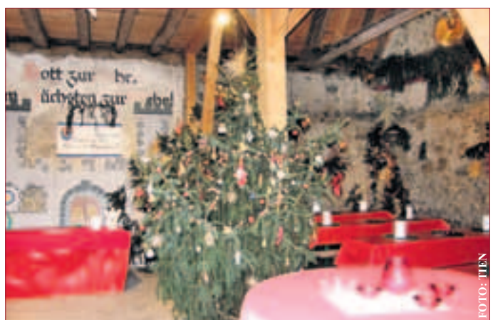
Die schön geschmückte Scheune lädt alle herzlich ein