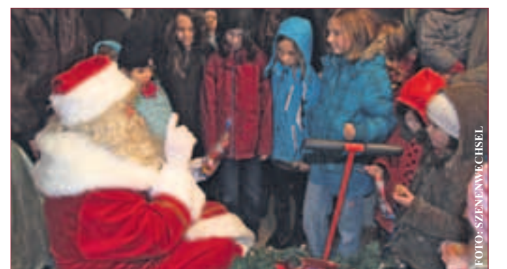
„Ward Ihr alle auch schön brav?“

amt, Förderverein Diakonie Nördliche Bergstraße e.V., Frauen- und Familienzentrum SzenenWechsel e.V. Ort: Altes Forstamt Jugenheim, Hauptstraße 15.