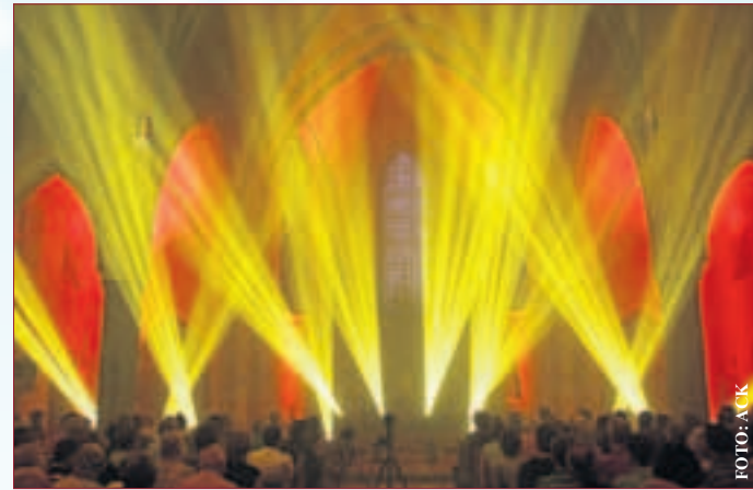
Highlight zur „Nacht der Kirchen“ 2011: Licht-Performance in St. Josef.

Öffnungszeiten des Weihnachtsmarktes vom 26. November bis zum 23. Dezember: Montag bis Donnerstag 10.30 bis 21 Uhr, Freitag und Samstag 10.30 bis 22 Uhr, Sonntag 11.30 Uhr bis 21 Uhr. (Darmstadt Marketing)