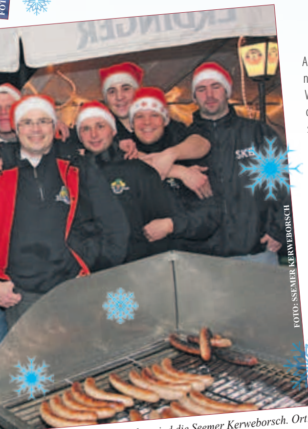
Die drei Damen vom Waffelstand verstehen es jedes Jahr aufs Neue ihre Kundschaft zu begeistern.

Am 1. und 2.12.2012 auf dem Weihnachtsmarkt in Biebesheim (Albert-Hammann-Str.), am 8. und 9.12.2012 auf dem Weihnachtsmarkt in Gernsheim (Schöfflerplatz), am 22. und 23.12.2012 auf dem mittelalterlichen Weihnachtsmarkt in Biebesheim (an der Rheinhalde) oder stöbern Sie in aller Ruhe durch den Online-Shop unter: www.Second-Hand-for-Dogs.de . Sie freut sich auf Ihren Besuch!