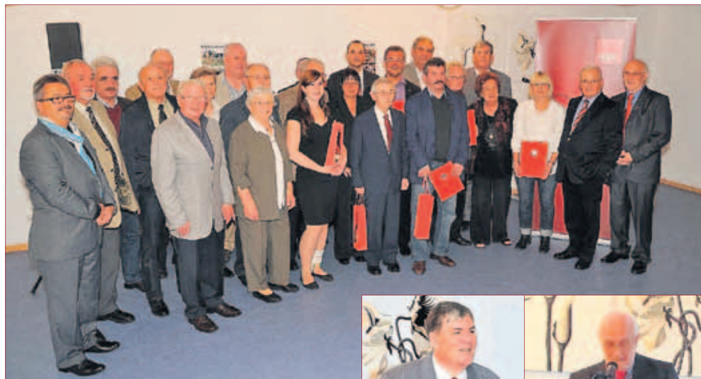
Gruppenbild der Jubilare