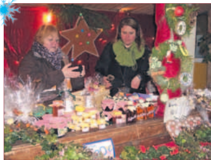
Weihnachtlich geschmückte Buden bieten Selbstgemachtes und Leckeres.

Der Reinerlös der Veranstaltung wird, wie in den 27 Jahren zuvor, an soziale Einrichtungen weitergegeben. Dieses Mal werden u.a. der „Verein für krebskranke und chronisch kranke Kinder Darmstadt e.V.“ sowie die Kinder- und Jugendfeuerwehren in Mühlthal vom Traisaer Nikolausmarkt bedacht. Die „Darmstädter Tafel“ wird erneut vom Erlös der Verlosung profitieren.