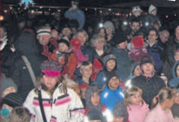
Höhepunkt des Nikolausmarkts in Traisa ist seit nunmehr 28 Jahren der Auftritt des Nikolauses, der den lieben Kleinen bisher stets Geschenke mitgebracht hat.

kaufen Sie wollen mieten verkaufen Sie wollen vermieten