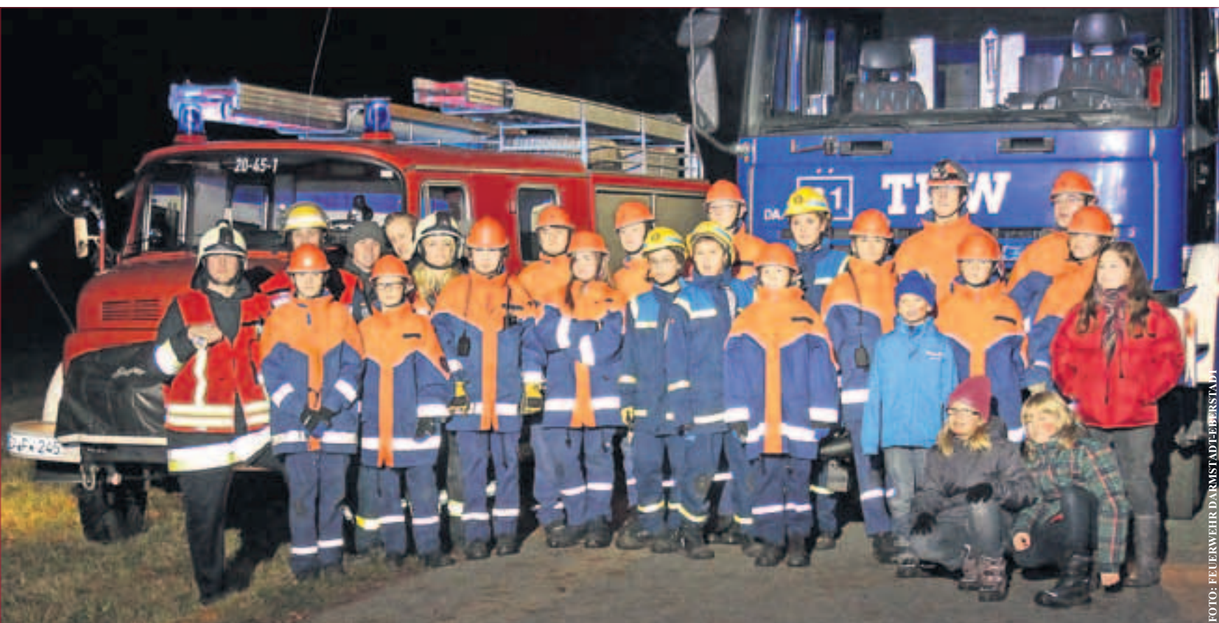
Verkehrsunfall mit vier verletzten Personen auf der rückseitigen Auffahrt (Mühlthal) zum Frankenstein. So lautete das „Einsatzszenario“ für die diesjährige gemeinschaftliche Abschlussübung der Jugendfeuerwehr Darmstadt-Eberstadt und der THW Jugend Darmstadt Mitte November an der rund 20 Jugendliche im Alter von 10–17 Jahren teilnahmen. Neben der Rettung der verletzten Personen aus den beiden verunglückten PKWs, standen die Erstversorgung der Verletzten und die Brandbekämpfung an einem der beiden PKWs im Vordergrund der einständigen Übung. Die Abschlussübung setzt den Schlussschritt des Sommerhalbjahres 2012, für die Jugendlichen geht es jetzt ins Winterhalbjahr (2012/2013) mit Unterrichten und Freizeitaktivitäten in Ihren Gerätehäusern. Im Anschluss an die Übung gab es für alle Beteiligten noch eine Stärkung im Gerätehaus der Freiwilligen Feuerwehr Eberstadt. Alexander Wobbe (Wehrführer), Dominik Paul (Jugendwart THW) und Marcus Sattler (Jugendwart JFE) bedankten sich in Ihren Grußworten bei den Teilnehmern und Ausrichtern der Abschlussübung und Ihr damit verbundenes Engagement in der Jugendarbeit.