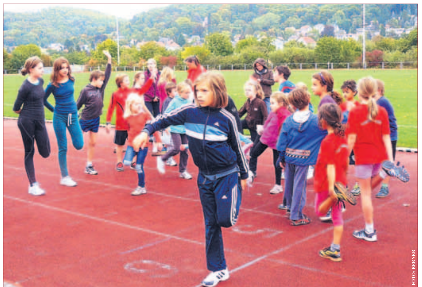
Kürzlich veranstaltete der Turnverein Seeheim (TVS) im Christian Stockstadion seine diesjährigen Leichtathletik-Ortsmeisterschaften. 39 Kinder und zehn Erwachsene kämpften in den Kategorien Lauf, Sprung und Wurf oder Stoß um die besten Ergebnisse in ihrer Altersklasse. Unterstützt wurden die Athleten durch zahlreiche Eltern, die zusammen mit den Kampfrichtern für eine familiäre Betreuung sorgten.