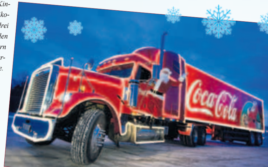
In einem mobilen Karaoke-Songstudio kann jeder Besucher den neuen Song oder beliebte Weihnachtsklassiker singen.

ter Stube bis zum Foto- und Filmstudio. „Gemeinsam machen wir Weihnachten zum Fest“ lautet die Botschaft, mit der Coca-Cola und Santa Claus einladen, zusammen mit den Liebsten Weihnachtsfreude zu erleben und zu teilen. Ein besonderes Highlight in diesem Jahr ist „Something in the Air“ – der erste weltweite Coca-Cola Weihnachts-sung zum Mitmachen. Alle Termine und Stationen der Tour sind auf www.coke.de abrufbar. (frankensteiner)