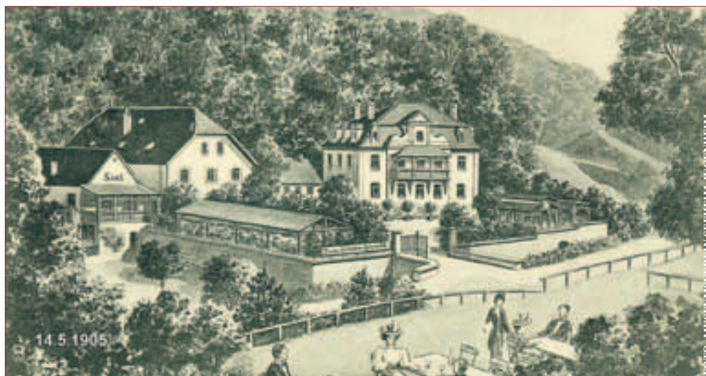
Jugenheim „Zum kühlen Grunde“, 1904

Gewinnen Sie 3x2 Eintrittskarten. Einfach eine Postkarte an die Frankensteiner Rundschau, Bgm.-Lang-Str. 9, 64319 Pfungstadt schreiben. Stichwort: „Staae Weisen“. Einsendeschluss ist der 09.12.2012 (Poststempel), Ihre Telefonnummer nicht vergessen. Die Gewinner werden angerufen. Die Karten liegen an der Kasse am 15. Dezember bereit. Viel Glück!