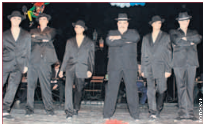
SVE feierte Karneval im Stil der 30'er Jahre.