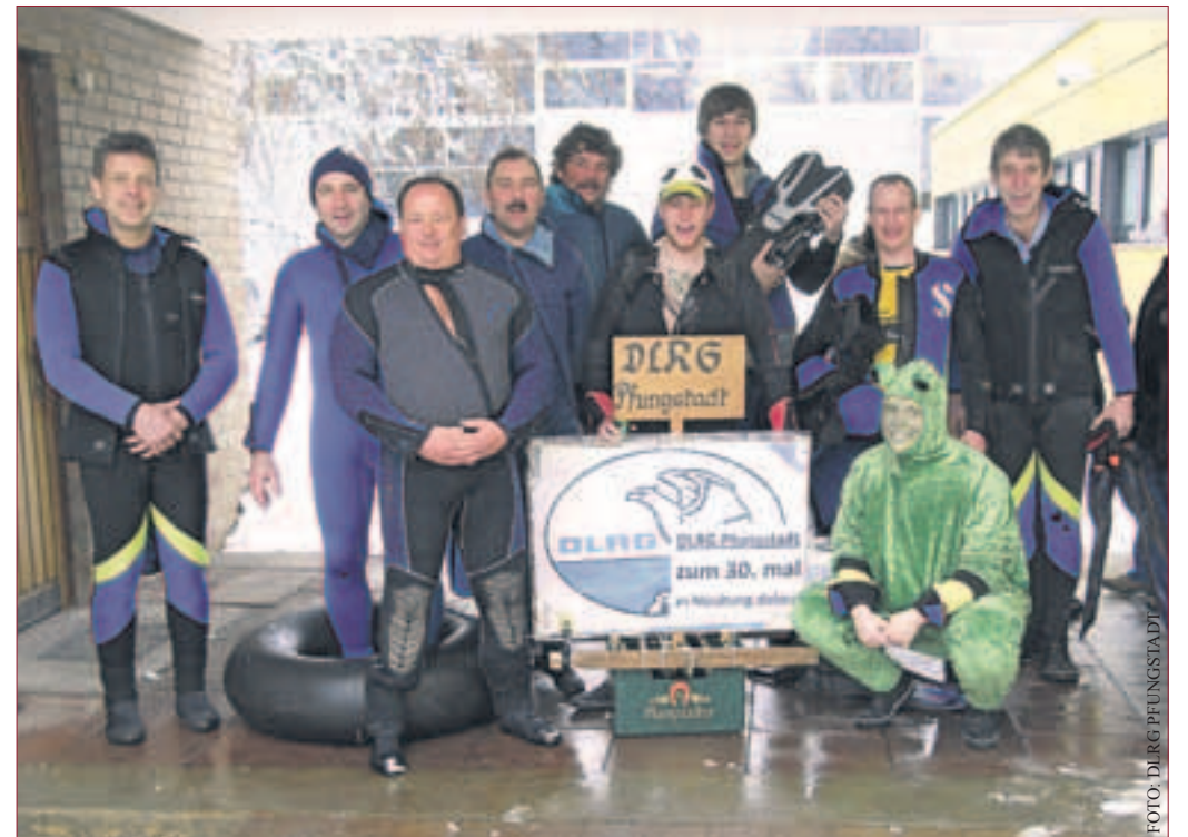
Die Schwimmer der DLRG Pfungstadt vor dem Start zum diesjährigen Neujahrsschwimmen in Neuburg an der Donau.

unentwegte tauchten auch nochmal ins Neuburger Nachtleben ab. Abschluss des diesjährigen Schwimmens bildete das Frühstück bei der Wasserwacht in der Mehrzweckhalle, wo auch die Schwimmer der DLRG Pfungstadt sich nochmal verpflegten, ehe es wieder auf die Heimreise ging.