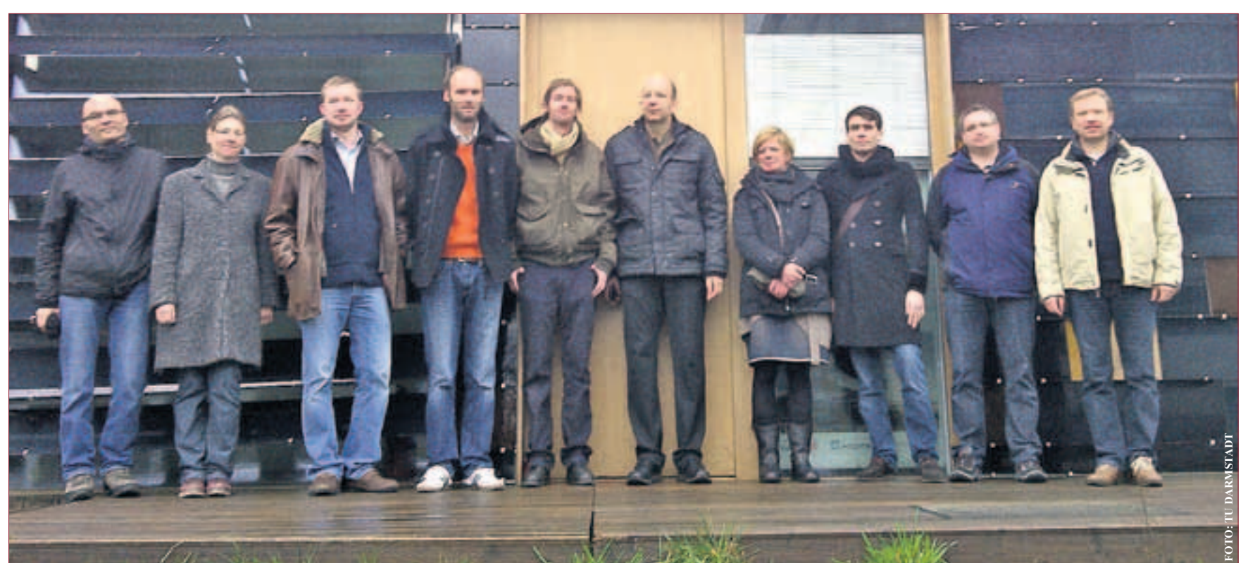
Nach der Prüfung besichtigten die Teilnehmer das Gewinnerhaus des „Solar Decathlon“ 2009 auf dem Campus der TU Darmstadt.

Wohngebäude-Kurses bestanden, 11 die der Weiterbildung zu Nichtwohngebäuden. Die Zertifikatslehrgänge zu Bestandsgebäuden erfüllen die Anforderungen der Staatlichen Zentralstelle für Fernunterricht (ZFU) und die der Energieeinsparverordnung (EnEV) 2009. Zudem berücksichtigt der Wohngebäude-Kurs die Kriterien für eine „Energiesparberatung vor Ort“. Bei der Erarbeitung der Inhalte werden die Teilnehmer kontinuierlich von den Tutoren der TU Darmstadt unterstützt. Auch beim Zukunftsthema „Vom Passiv- zum Plus-Energiehaus im Neubau“ haben die Veranstalter die Nase vorn: Sie bieten hierzu den ersten Lehrgang überhaupt an. Nähere Informationen, Demo-Versionen der Lehrgänge sowie eine Liste der „Energieberater TU Darmstadt“ finden Sie unter: www.energieberater-ausbildung.de