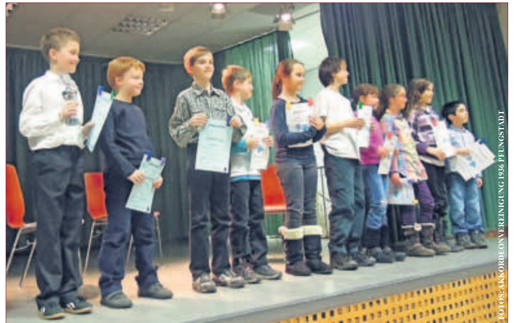
Preisverleihung – Siegerehrung, hier die Akkordeonschüler der Altersgruppe 1.