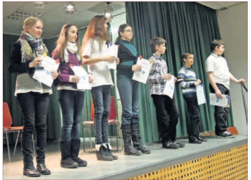
Preisverleihung – Siegerehrung, hier die Akkordeonschüler der Altersgruppe 3.