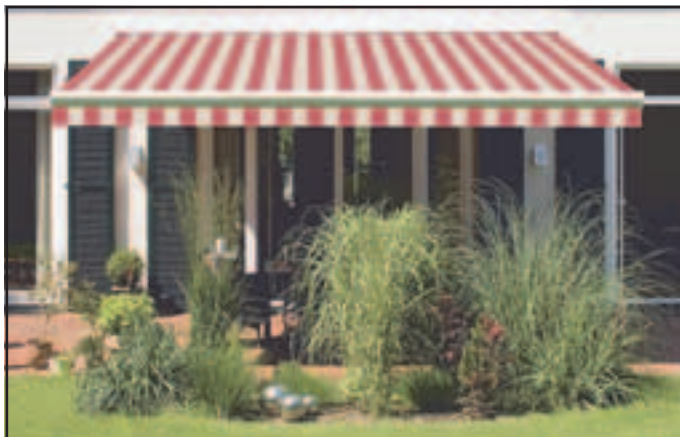
Markisen-Winteraktion bis 20. März 2011