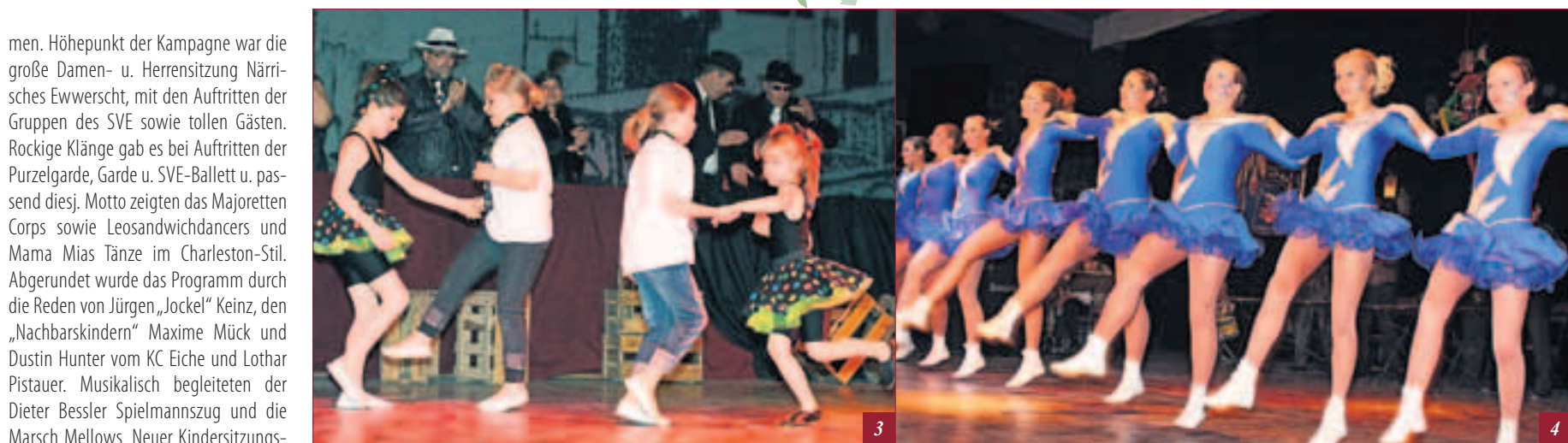
1 Die Majorettes. 2 Das Damenkomitee. 3 Die Purzelgarde. 4 Die Gardemädchen.