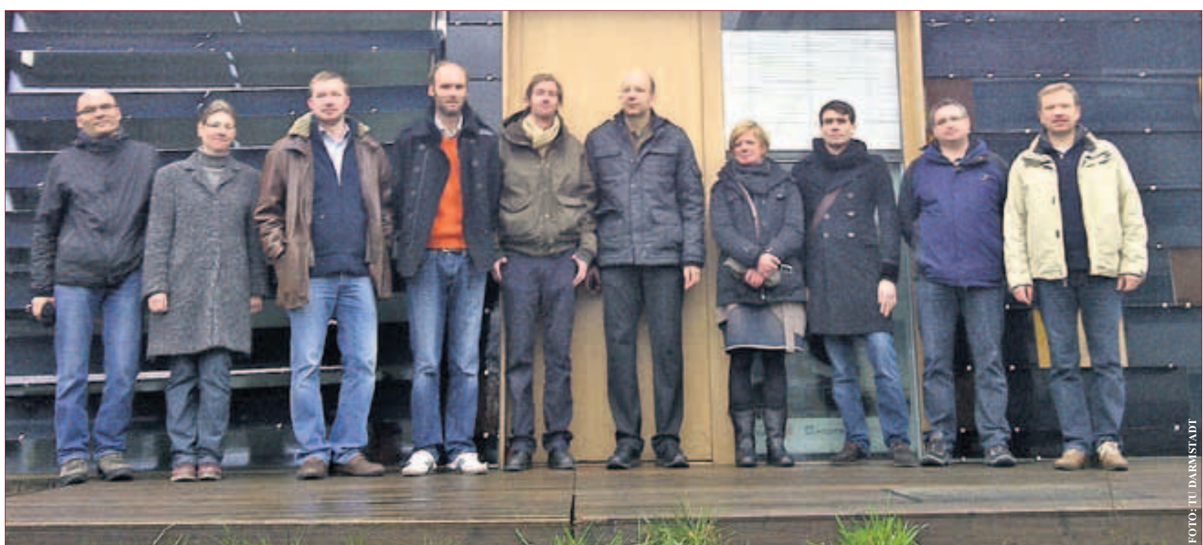
Nach der Prüfung besichtigten die Teilnehmer das Gewinnerhaus des „Solar Decathlon“ 2009 auf dem Campus der TU Darmstadt.

Wohngebäude-Kurses bestanden, 11 die der Weiterbildung zu Nichtwohngebäuden. Die Zertifikatslehrgänge zu Bestandsgebäuden erfüllen die Anforderungen der Staatlichen Zentralstelle für Fernunterricht (ZFU) und die der Energieeinsparverordnung (EnEV) 2009. Zudem berücksichtigt der Wohngebäude-Kurs die Kriterien für eine „Energiesparberatung vor Ort“. Bei der Erarbeitung der Inhalte werden die Teilnehmer kontinuierlich von den Tutoren der TU Darmstadt unterstützt. Auch beim Zukunftsthema „Vom Passiv- zum Plus-Energiehaus im Neubau“ haben die Veranstalter die Nase vorn: Sie bieten hierzu den ersten Lehrgang überhaupt an. Nähere Informationen, Demo-Versionen der Lehrgänge sowie eine Liste der „Energieberater TU Darmstadt“ finden Sie unter: www.energieberater-ausbildung.de