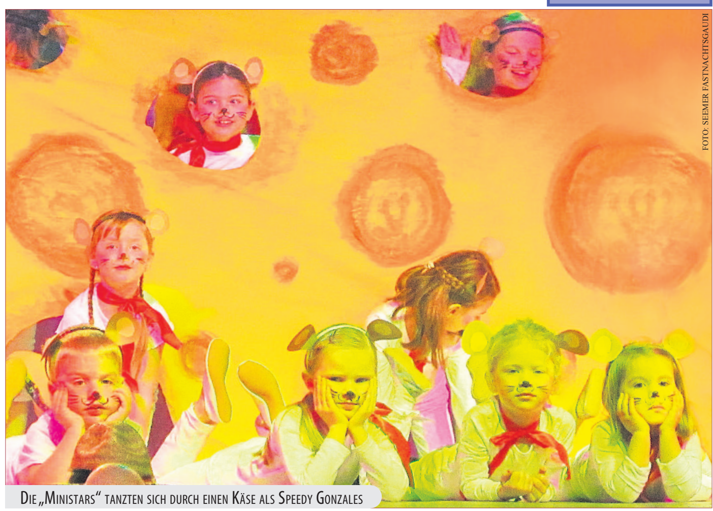
DIE „MINISTARS“ TANZTEN SICH DURCH EINEN KÄSE ALS SPEEDY GONZALES

mern mit stehenden Ovationen gefeiert. Ein weiteres Highlight des Abends war die Seemer Hymne, extra von der Seemer Fastnachtsgaudi geschrieben. Sie wurde mehrmals angestimmt und fleißig von allen mitgesungen. Die Stimmung in der Halle war wieder nährisch gut, das Publikum schunkelte zu Karnevals-Liedern und zog mit einer riesigen