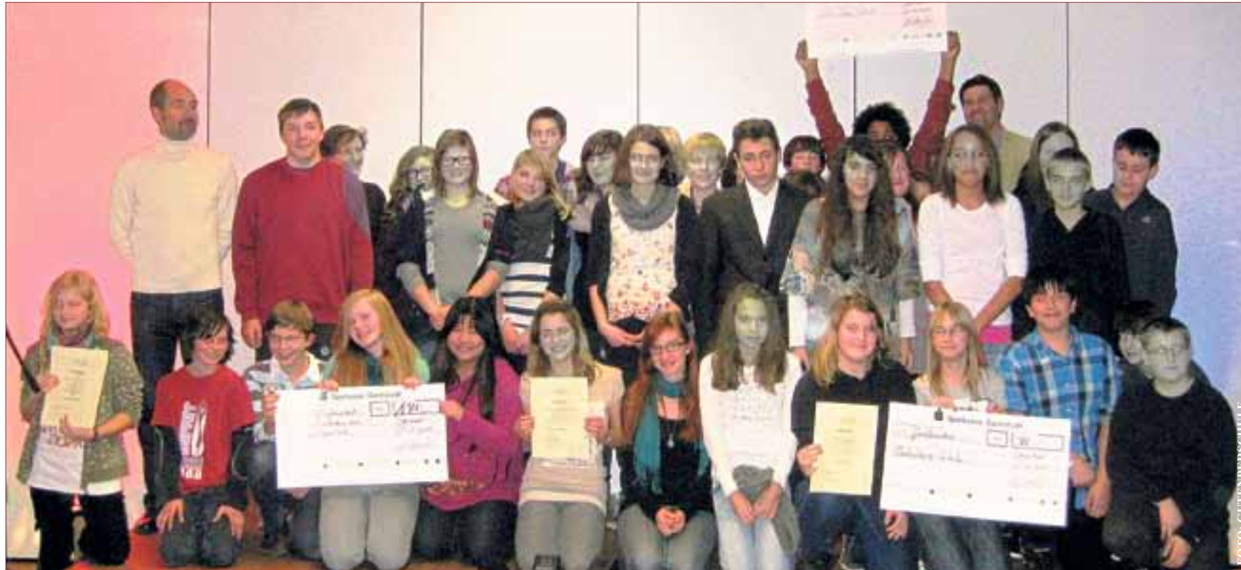
Die Preisträger „sozial gewinnt“ von der Gutenbergschule.