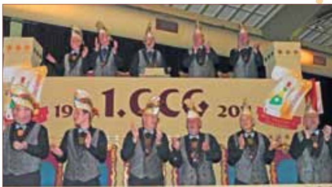
Komitee der 1. G.C.G.