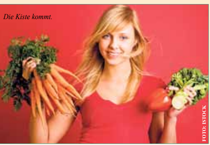
Die Kiste kommt.

Neben Gemüse und Obst sind viele weitere Produkte im Angebot: Kartoffeln, Eier, Milch, Milchprodukte, Brot und Backwaren, Wurst und Fleisch und ein komplettes Naturkostsortiment. Weitere Informationen über den Betrieb und die Lieferbedingungen finden Sie im Internet unter www.diegemuesebox.de oder telefonisch: 06158-941740.