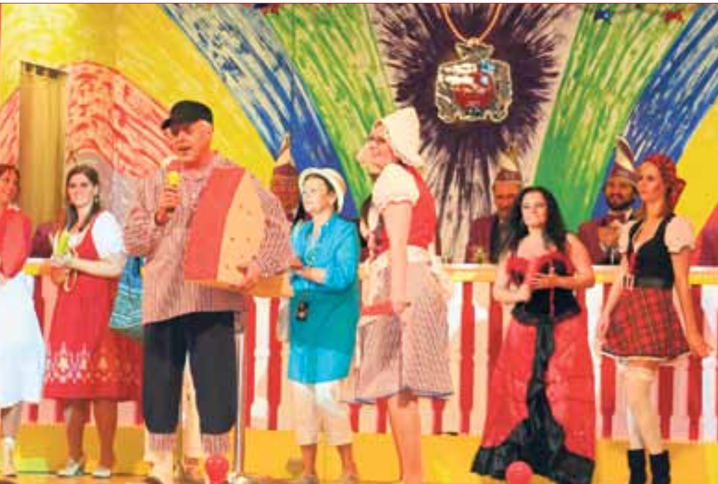
Foto oben: Erste Balkhäuser Verunsicherung, Foto unten: Das Finale.

22. Januar 2012 jeweils von 10:00 bis 11:00 Uhr in der Bürgerhalle Balkhausen. Nachbestellungen unter Tel.: 06257 62424 oder www.bcc-balkhausen.de .