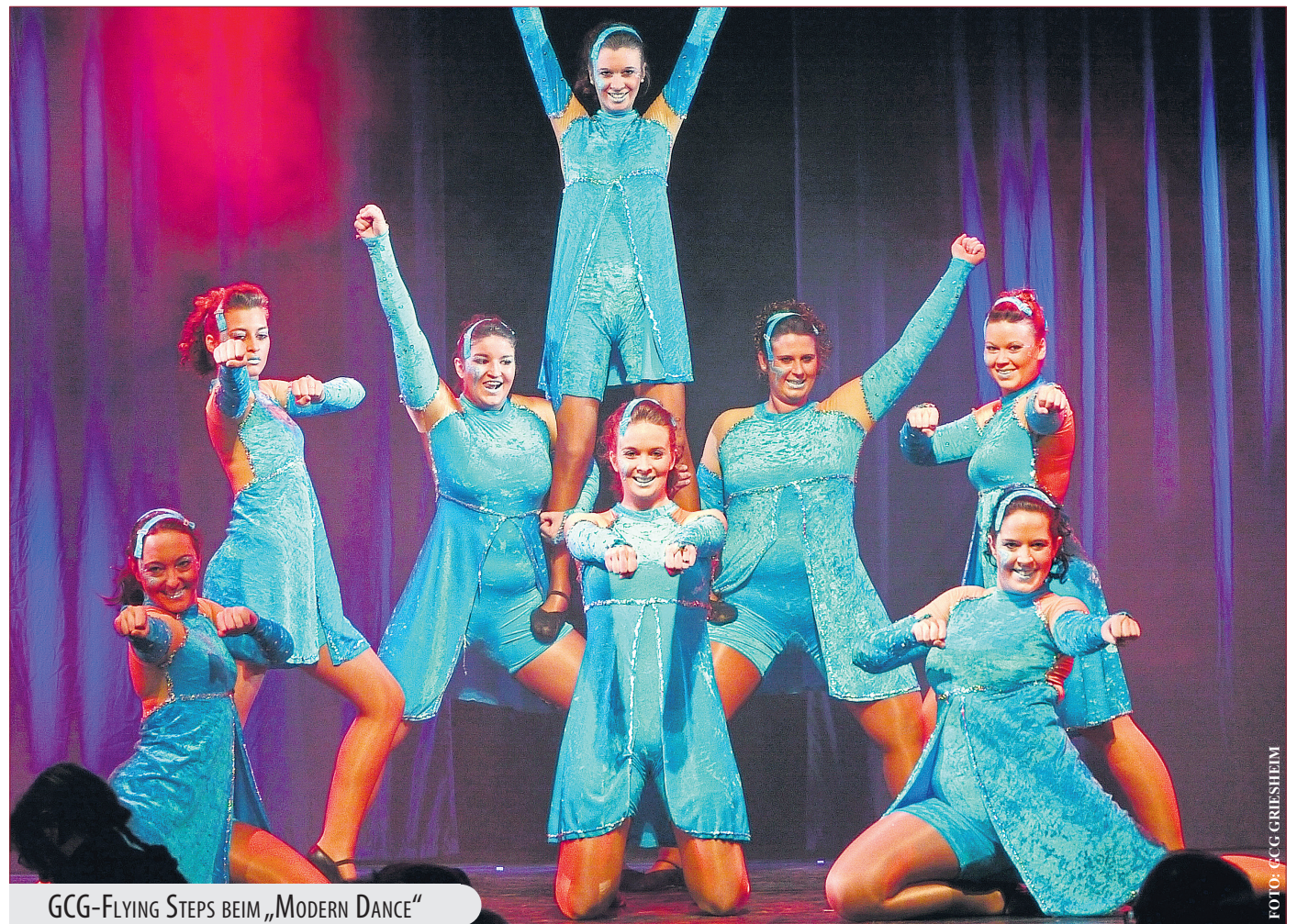
GCG-FLYING STEPS BEIM „MODERN DANCE“