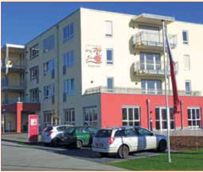
Das Haus verfügt über 144 Betten, davon 48 in Doppel- und 48 in Einzelzimmern. Eine Besonderheit der Einrichtung ist der Beschützte Wohnbereich mit 25 Bewohnern.

Wer möchte sich ehrenamtlich engagieren?