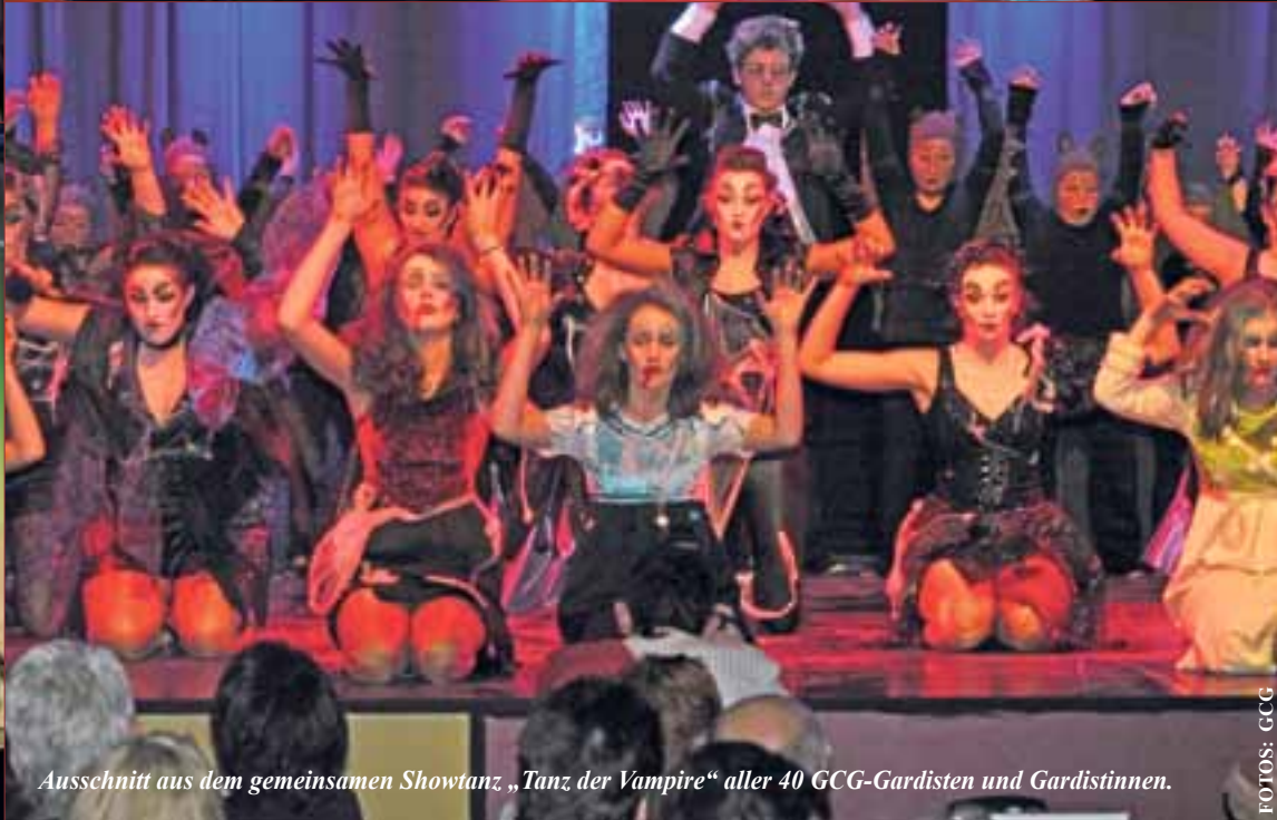
Ausschnitt aus dem gemeinsamen Showtanz „Tanz der Vampire“ aller 40 GCG-Gardisten und Gardistinnen.