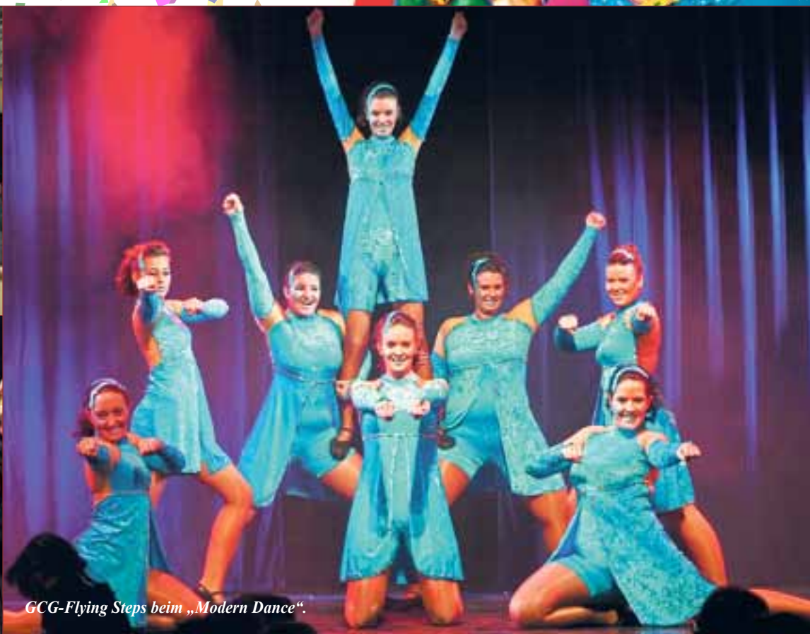
GCG-Flying Steps beim „Modern Dance“.