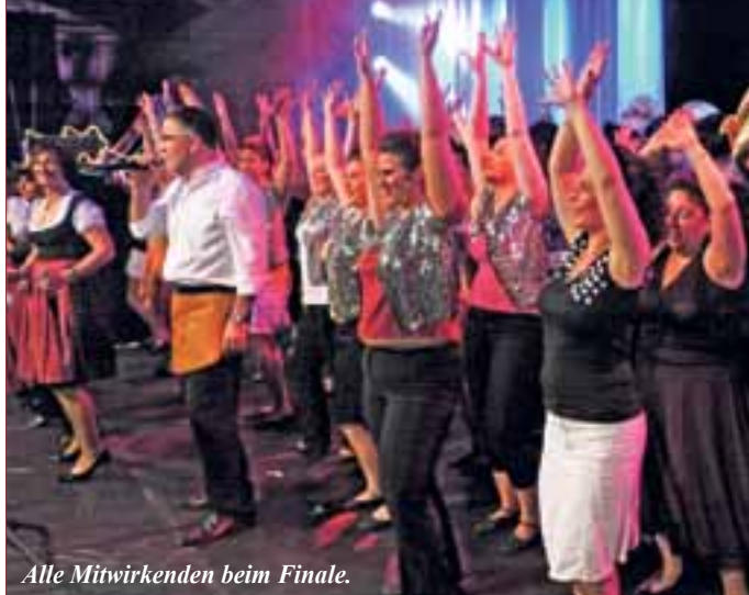
Alle Mitwirkenden beim Finale.