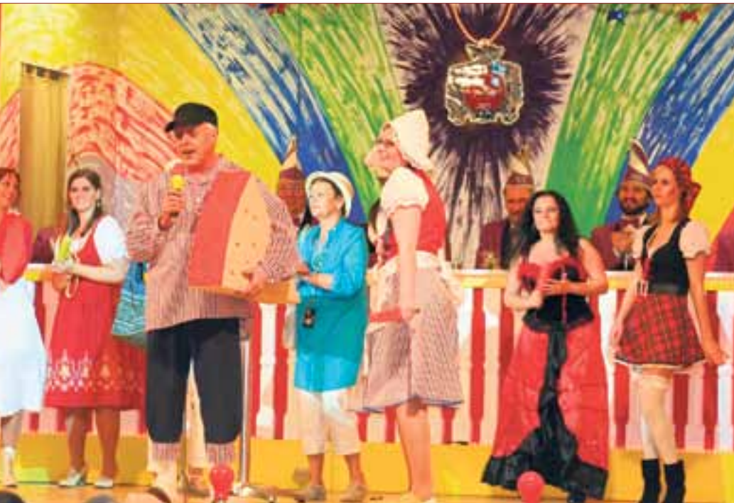
Foto oben: Erste Balkhäuser Verunsicherung, Foto unten: Das Finale.

derfastnacht findet am Dienstag, den 21. Februar um 14:00 Uhr statt. Der Eintritt ist frei. Kartenvorverkauf zum Preis von 8,00 € für die Prunksitzungen ist am 15. und 22. Januar 2012 jeweils von 10:00 bis 11:00 Uhr in der Bürgerhalle Balkhausen. Nachbestellungen unter Tel.: 06257 62424 oder www.bcc-balkhausen.de .