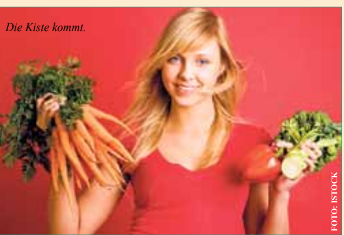
Die Kiste kommt.

Neben Gemüse und Obst sind viele weitere Produkte im Angebot: Kartoffeln, Eier, Milch, Milchprodukte, Brot und Backwaren, Wurst und Fleisch und ein komplettes Naturkostsortiment. Weitere Informationen über den Betrieb und die Lieferbedingungen finden Sie im Internet unter www.diegemuesebox.de oder telefonisch: 06158-941740.