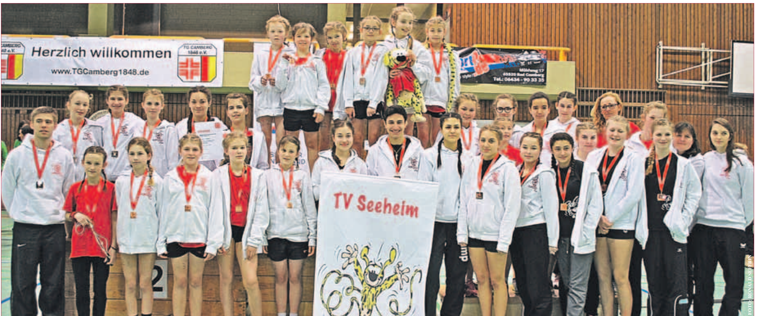
ROPIDZ HOLEN SILBER UND BRONZE - Seeheimer Seilspringer bei den Hessischen Mannschaftsmeisterschaften. Großartige Ausbeute der „Ropidz“ bei den Hessischen Mannschaftsmeisterschaften im Februar 2014! Mit 6 Teams und 5 Medaillen können die „Ropidz“ nach den Hessischen Mannschaftsmeisterschaften stolz auf sich sein. Mit dem größten Starterfeld zeigten sie wieder einmal, dass neben dem Wettkampfsport auch die Nachwuchsarbeit im TV Seeheim ganz groß geschrieben wird. Mit voraussichtlich 4 Teams treten die Seeheimer im März bei den Deutschen Mannschaftsmeisterschaften in Dettingen an. Auf dem Foto sind alle Teilnehmer/innen zu sehen.