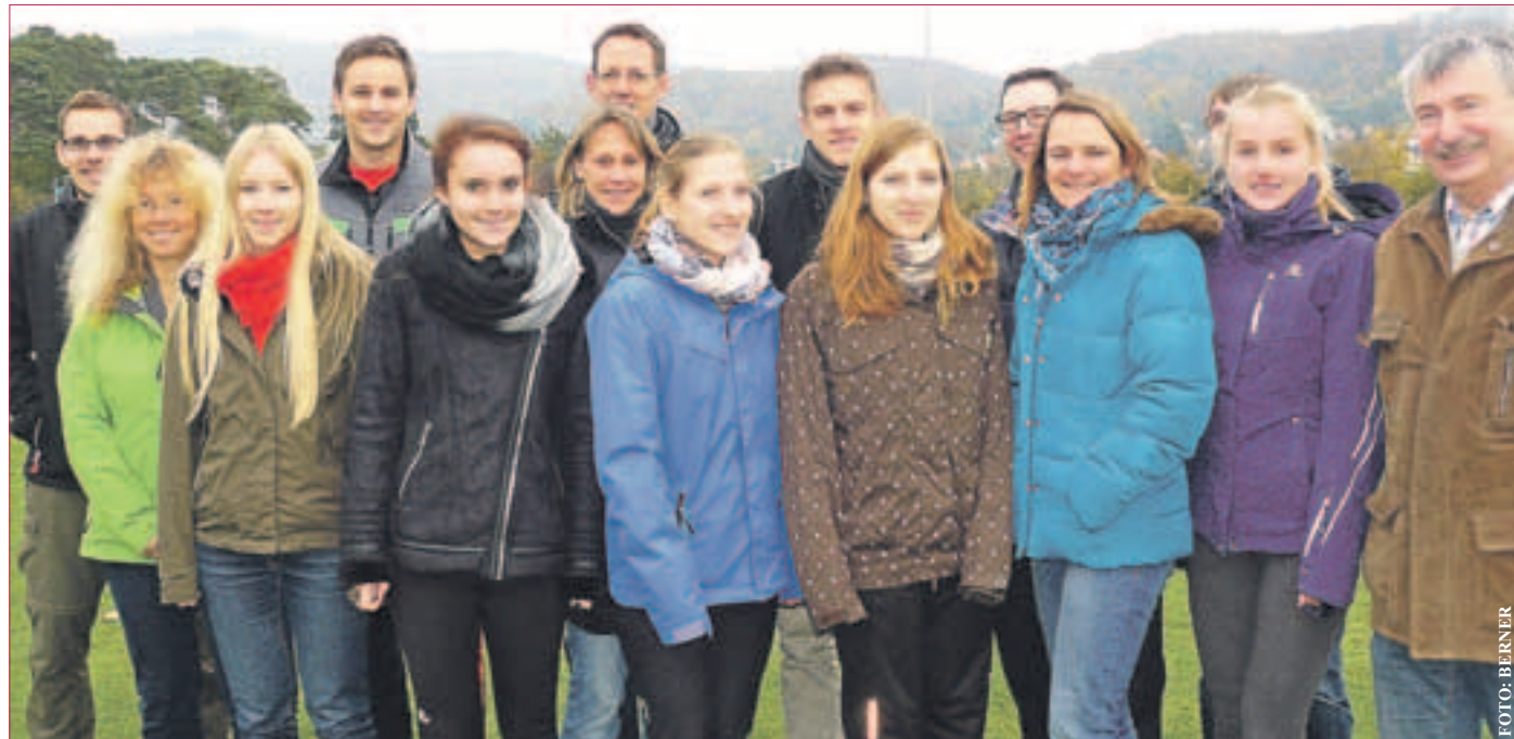
DIE KAMPFRICHTER sind bei Kreis- und Hessischen Meisterschaften, aber auch bei Vereinswettkämpfen einsatzberechtigt