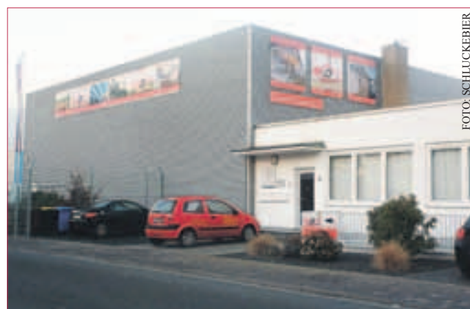
FIRMENGELEND K&D Überdachungen in Rüsselsheim

Kontakt: K&D Überdachungen Kobaltstraße 6 65428 Rüsselsheim Tel.: 06142 – 70106-91 Fax: 06142 – 70123-82 E-Mail: info@kd-ueberdachung.de Internet: www.kd-ueberwachung.de