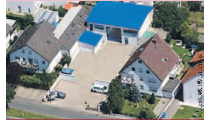
FIRMENGELÄNDE aus der Vogelperspektive

Die technische Dienstleistungs-firma Stork Haustechnik GmbH & Co. KG ist in mittelständischen, aber auch in Großunternehmen gefragt. Man arbeitet in den Bereichen Instandhaltung von Heizungs/Sanitäre Anlagen in verschiedenen Regionen des Rhein Main Gebietes. Aufgabe ist die Einhaltung des laufenden Betriebes der Auftraggeber.