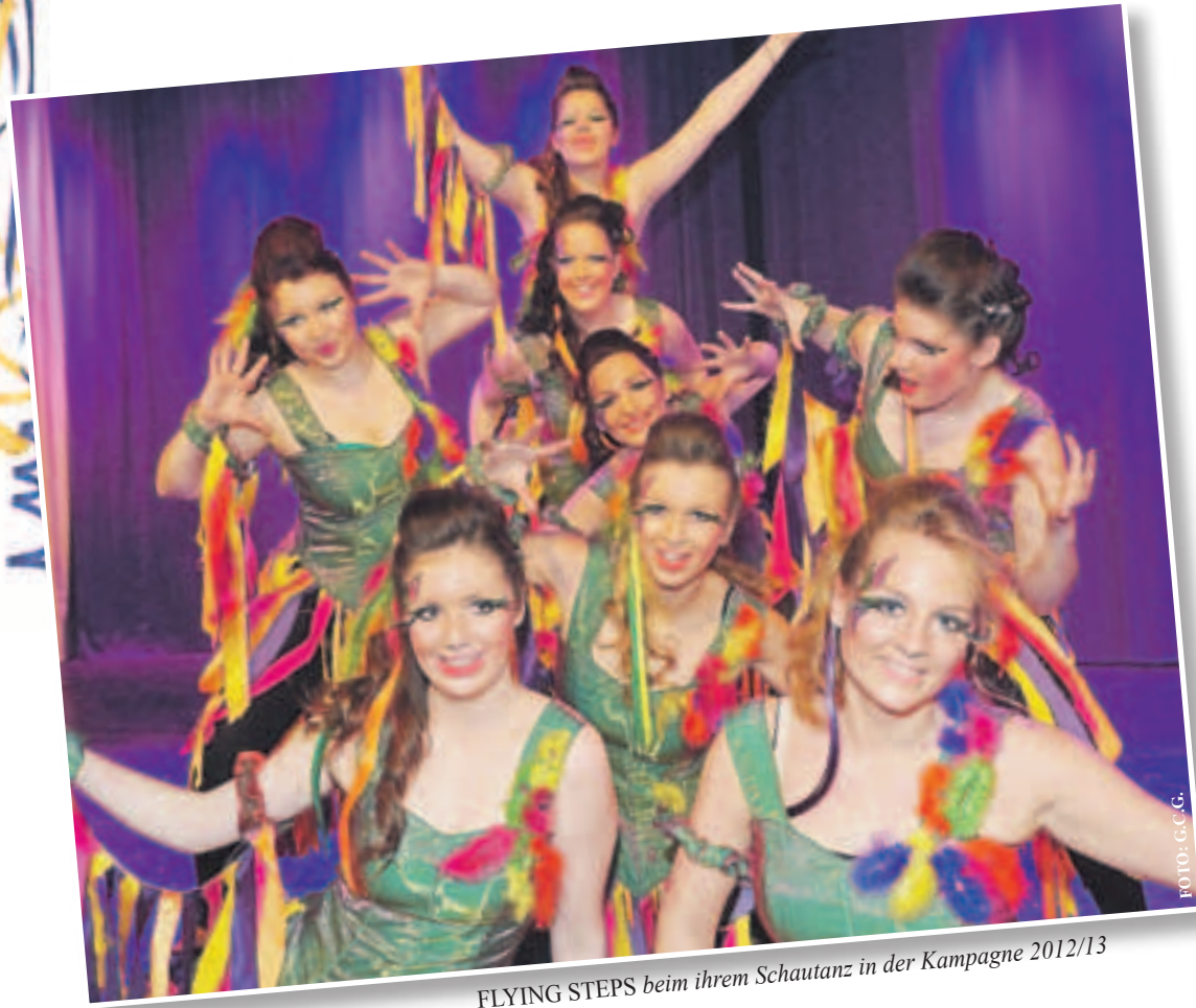
FLYING STEPS beim ihrem Schautanz in der Kampagne 2012/13

Kontakt: info@1gcg-griesheim.de oder Telefon: 06155-4946.