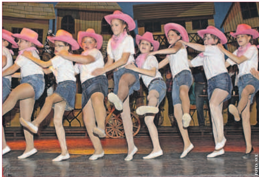
DIE PURZELGARDE vom SVE

EBERSTADT. Nach der erfolgreichen Kampagne-Eröffnung bereitet sich die SVE Karnevalabteilung nun auf die heiße Phase der närrischen Zeit vor, denn 2014 stehen einige Highlights an: