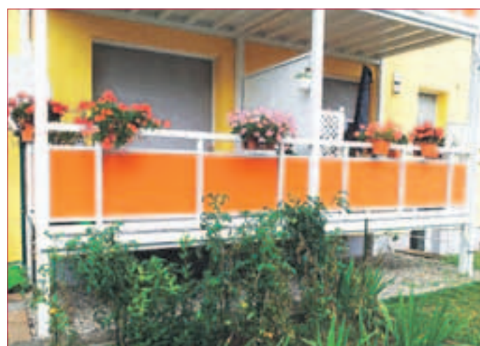
VORSTELLBALKON aus Aluminium. Viele Konstruktionen aus Holz werden im Laufe der Zeit morsch. Balkone können kostengünstig aus Aluminium angebaut werden.

GERNESHEIM. Hersteller von Balkonen, Überdachungen und Geländern in Aluminium. Die Firma L&S Vertriebsgesellschaft mbH ist der Spezialist zur Herstellung von Bauelementen aus Aluminium rund um das Haus. Das Angebot reicht von Alu-Balkonsystemen, Geländersystemen sowie Überdachungen. Alle Systeme können in Selbstmontage oder auch mit Hilfe des Montagesservice der Firma L&S aufgebaut werden.