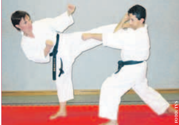
KARATESPORT fördert die Ausdauer und den Gleichgewichtssinn.

Mitzubringen ist bequeme Sportkleidung. Die Teilnahme stellt den größten Teil der Vorbereitung auf die1. Gürtelprüfung zum 9. Kyu dar. Infos: 0176 566 659 58 oder 0172 670 6800 oder www.karate-seeheim.de.