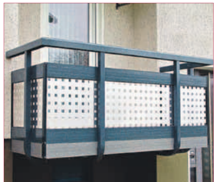
MODERNES ALUMINIUMGELÄNDER mit Lochblech. Neueste Technik durch unterseitige Befestigung

Alle Systeme sind auf den jeweiligen Bedarf angepasst, sind statisch berechnet und ETB geprüft. Das Material Aluminium ist ein wetterbeständiges Metall welches nicht rostet und auch keinen Anstrich benötigt. Die Firma L&S gewährt auf seine Konstruktionen 12 Jahre Garantie.