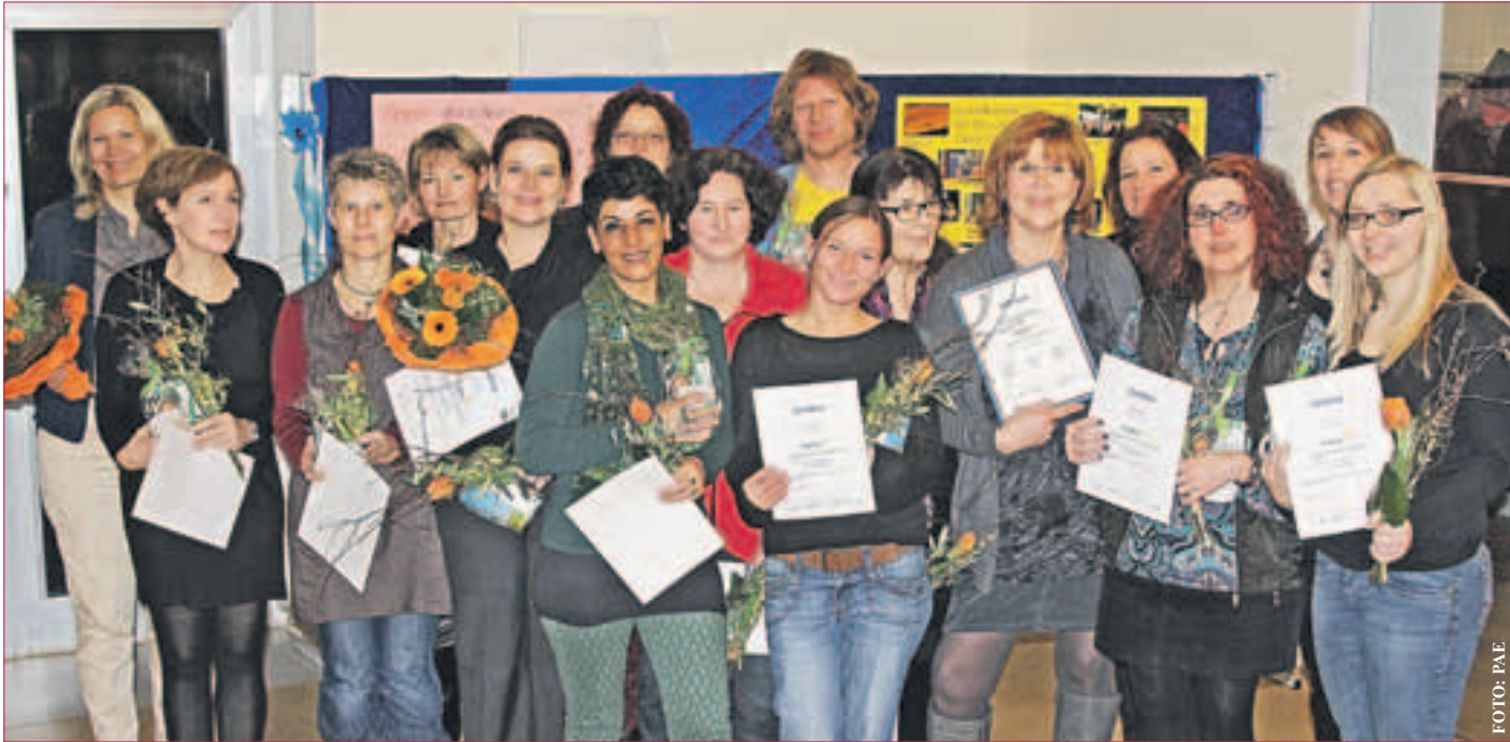
18 FACHKRÄFTE der kommunalen Kindertagesstätte „Windrad“ erhielten das Papilio-Zertifikat von ihren Trainerinnen.