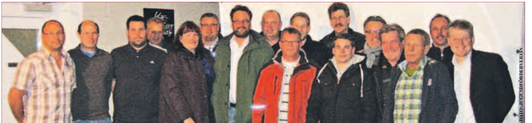
DIE GRÜNDUNGSMITGLIEDER des Jugendfördervereins

Es besteht für jeden, der die Jugendarbeit fördern möchte die Möglichkeit, freiwillig mit einem Jahresbeitrag ab 12 € den Verein zu unterstützen. Nach Erteilung der