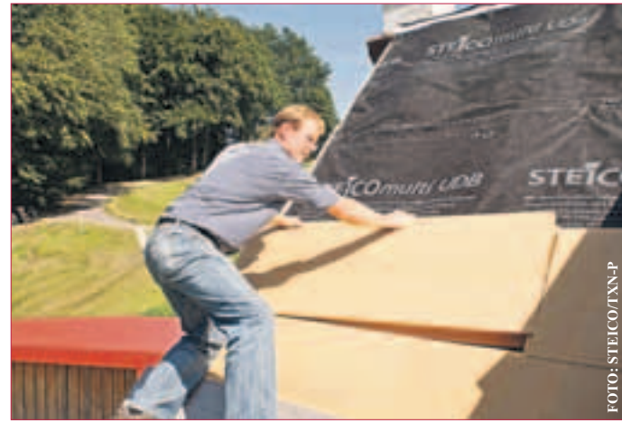
ÖKOLOGISCHES DÄMMSYSTEM: Holzfaser-Dämmplatten halten die Wärme im Haus. In Kombination mit entsprechendem Systemzubehör lassen sich wind- und dampfdichte Dachkonstruktionen realisieren, die hoch wärmedämmend sind und dauerhaft sicher funktionieren.

Wenn das Eigenheim im Winter zu kalt und im Sommer zu heiß ist, hilft die nachträgliche Dämmung von Dächern und Fassaden. Ähnlich wichtig ist auch die Luft- und Dampfdichtheit des Gebäudes, denn sie gewährleistet, dass die Wärme nicht durch Ritzen und undichte Anschlüsse „herausgeblasen“ wird. Wer hier spart, riskiert Wärmeverluste und Bauschäden. Der Dämmspezialist Steico hat deshalb sein Sortiment an Holzfaser-Dämmstoffen um speziell entwickelte Gebäude-Abdichtungsprodukte erweitert. Dampfbremsen und Luftdichtheitsbahnen gehören ebenso dazu wie spezielles Systemzubehör für die sichere Montage. Alle Komponenten sind optimal auf das Dämmstoffsoriment des Herstellers abgestimmt. Die Abdichtungsprodukte schützen nicht nur das Innere des Gebäudes vor Wär-