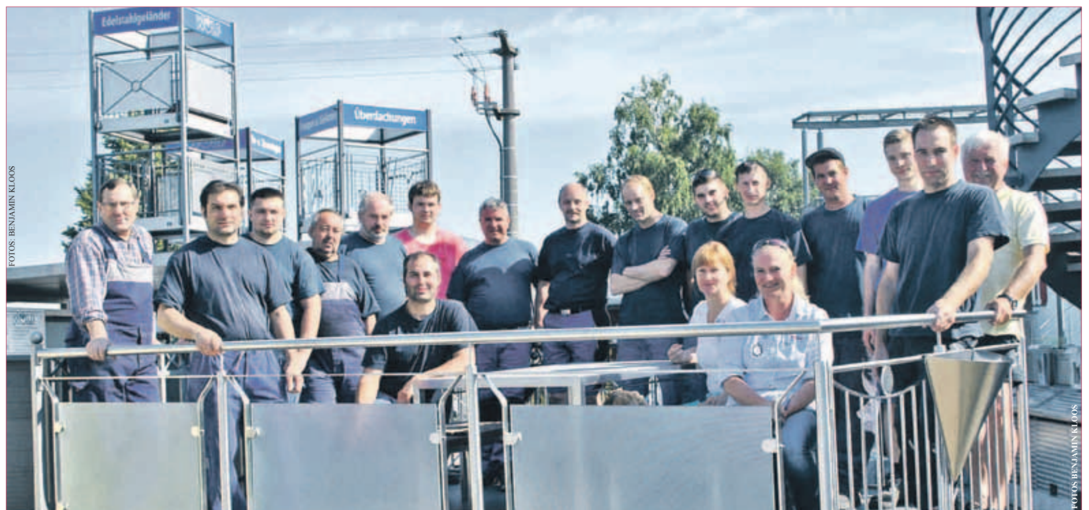
ALLE 32 MITARBEITER der Gerhard Wolf GmbH stehen den Kunden kompetent und mit ausgezeichnetem Service zur Seite.