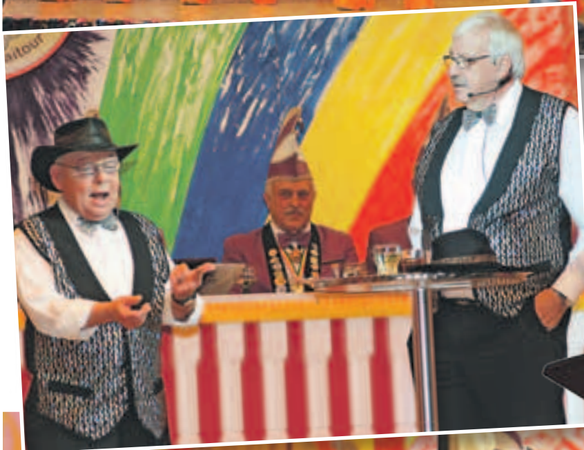
GROSSER UND KLANNER