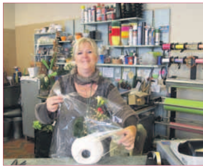
MIT VIEL SORGFALT UND LIEBE – werden die Blumen verpackt.

...dann stände Frau Büschel jetzt hier nicht für ein Gespräch bereit. So aber gibt es die „Villa Flora“, Blumen und Geschenke, für floristische Ge-