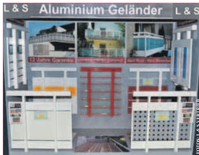
DIE VIELFALT von unseren Aluminium Geländern. Viele viele Farben sind möglich. Auch Holzdesign.

Die Nummer 1 in Deutschland mit über 50 verschiedenen Systemen