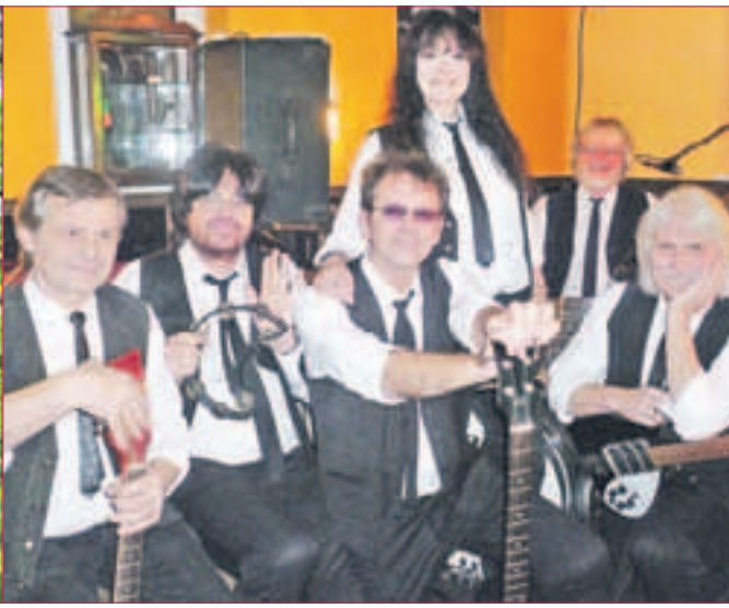
BRANDY BEATLES COMPLETE Band