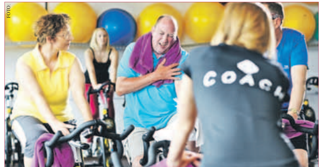
„BEI VERDACHT AUF EINEN SCHLAGANFALL muss schnell gehandelt und unter der Nummer 112 der Rettungsdienst alarmiert werden“, so Little. „Nur so können Gehirnzellen vor dem Absterben gerettet und spätere Beeinträchtigungen gemindert werden.“

Die Johanniter empfehlen daher eine regelmäßige Auffrischung von Erste-Hilfe-Kenntnissen, um im Ernstfall auch richtig helfen zu können. Infos zum Kursangebot der Johanniter gibt es im Internet unter www.juh-da-di.de oder telefonisch unter Telefon 06155-600 00 oder 06071-209 60.