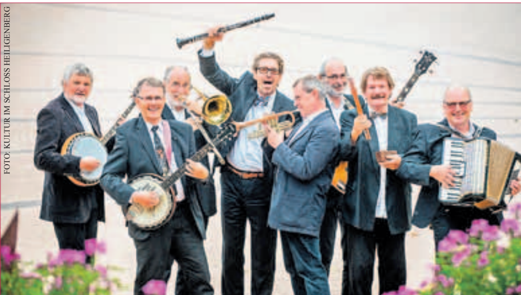
DIE ORIGINAL BLÜTENWEGJAZZER beweisen Kreativität mit dem Einsatz „exotischer“ Instrumente (z. B. Waschbrett).