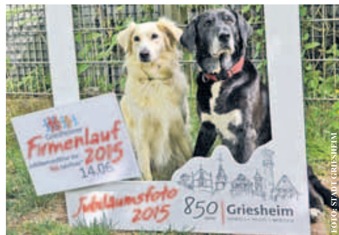
DER „GRIESHEIMER FIRMLAUF – DIE JUBILÄUMSEDITION“ FINDET IN DIESEM JAHR AM SONNTAG, DEN 14. JUNI 2015 UM 11.00 UHR STATT. Der Lauf bietet die ideale Möglichkeit in der Festsommitag zu starten. Anschließend bietet das tolle Programm des Jubiläumssommitags beste Möglichkeiten diesen Sonntag mit der ganzen Familie in der Griesheimer Innenstadt zu feiern. Jeweils ein Euro vom Startgeld geht diesmal wieder an das Tierheim. Anmeldungen sind weiterhin unter www.griesheimer-firmenlauf.de möglich.