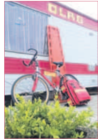
FÜR ERSTE-HILFE sorgt das neue Sanitätsmaterial, das die DLRG Pfungstadt dank Spenden in diesem Jahr anschaffen konnte.

Bei den Arbeiten machte den Lebensrettern allerdings der hohe Wasserstand einen Strich durch die Rechnung. So konnten die Arbeiten nicht komplett abgeschlossen werden und müssen nun noch innerhalb des nor-