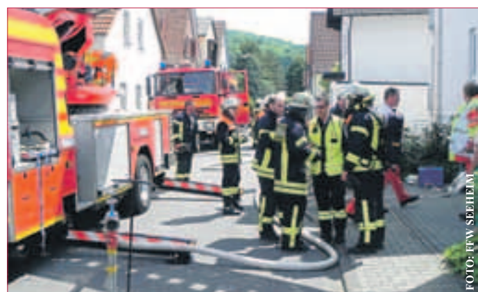
URSACHE DER RAUCHENTWICKLUNG: ein Kochtopf auf dem Herd mit köchelndem Essen.

Dass sich die Rauchmelderpflicht bewährt, bewies ein Einsatz der Freiwilligen Feuerwehren Seeheim und Jugenheim