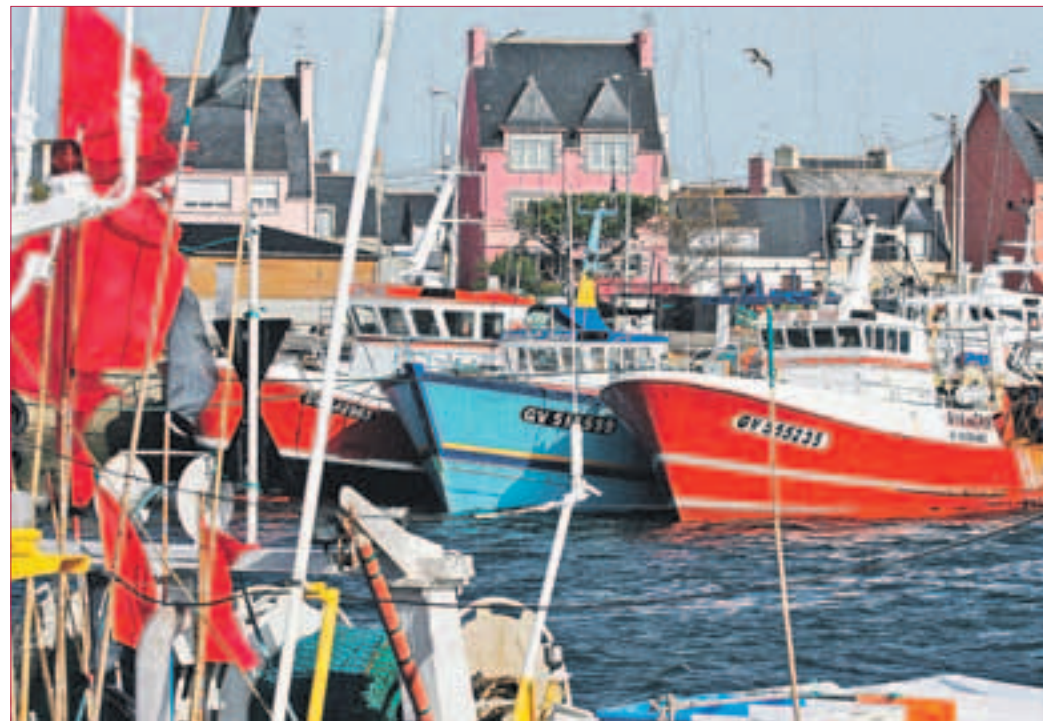
ROMANTISCHER FISCHEREIHAFEN: Sehen Sie Fachwerkhäuser und Bau- und Denkmäler und kosten Sie maritime Gerichte... erleben Sie schroffe Klippen mit tosenden Wellen. (Foto oben) MONT SAINT MICHEL in der Abenddämmerung (Foto rechts)

Omnibusbetrieb J. Brückmann OHG Pfungstädter Straße 176-180 64297 Darmstadt Tel. 06151-55271 www.brueckmann-reisen.