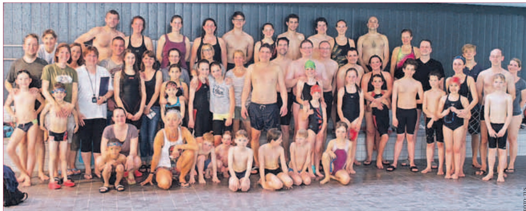
VEREINSMEISTERSCHAFTEN BEI DEN TUS SCHWIMMERN: Ende April wurden bei den TuS Schwimmern die Vereinsmeisterschaften ausgetragen. Die „Kleinen“ (bis Jahrgang 2006) mussten 25 m Brust, Rücken und Freistil schwimmen, während die „Großen“ (Jahrgang 2005 und älter) – bestehend aus Jugendliche und Masters - die gleichen Lagen über 50 m zu absolvieren hatten. Insgesamt nahmen 60 Schwimmerinnen und Schwimmer an den Meisterschaften teil und das erste Mal gab es zum Abschluss dieser die Möglichkeit zur Teilnahme an einer Familienstaffel (4 x 25 m). Diese Chance nutzen direkt zwölf Familien und auch die Trainer konnten es sich nicht nehmen lassen, eine Staffel zu bilden. Die Klärung der Frage, wer denn nun Vereinsmeister der Kinder-, Jugend- und Masterwertung ist, wird an der gemeinsamen Fahrradtour mit anschließendem Grillen am 19. Juli geklärt.