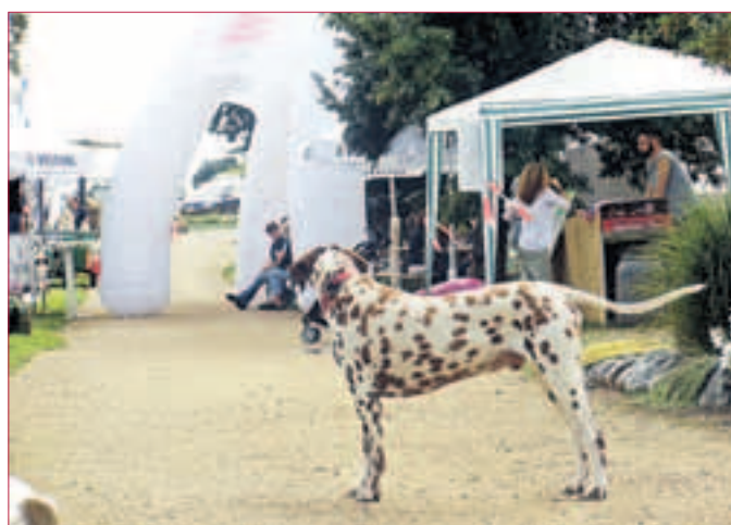
MENSCH & HUND: leckere Wildschweinwurst schmeckt jedem!