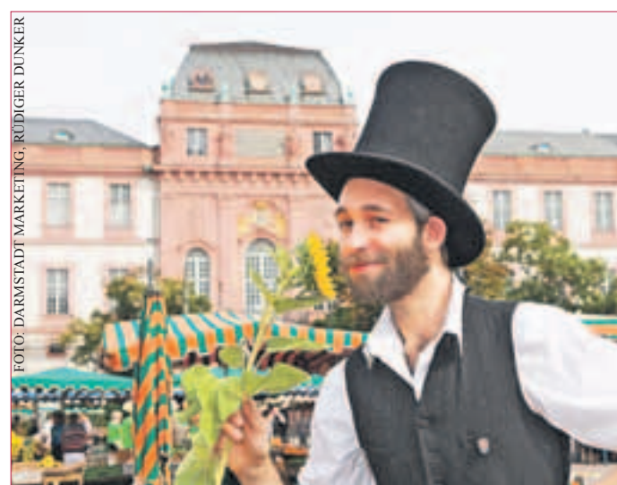
JEDEN LETZTEN SAMSTAG im Monat von 8-14 Uhr werden Aktionen geboten.

des Darmstadt Citymarketing e.V., des Eigenbetriebs Bürgerhäuser und Märkte sowie der Wissenschaftsstadt Darmstadt Marketing GmbH. (Frankensteiner)