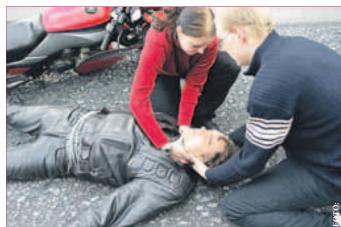
ERSTE HILFE-MASSNAHME: Bei Bewusstlosigkeit muss der Helm abgenommen werden, damit das Opfer nicht an Erbrochenem oder seinem eigenen Blut erstickt.

Biker tun gut daran, vorausschauend und defensiv zu fahren. Zudem sollten sie nicht zu lange auf gleicher Höhe mit Pkws fahren, weil sie damit im toten Winkel bleiben. Je unübersichtlicher sich die Verkehrslage für den Motorradfahrer darstellt, desto stärker sollte die Geschwindigkeit gedrosselt und die Bremsbereitschaft erhöht werden. Von vielen Fahrern unterschätzt wird die Bedeutung der richtigen Motorradkleidung. „Bei einem Sturz ist nur noch die Kleidung zwischen dem Fahrer und dem Asphalt. Textil- oder Lederkombi, Wirbelsäulenprotector, Stiefel, Helm und Handschuhe sind für die Sicherheit unverzichtbar. Jeder Motorradfahrer sollte in regelmäßigen Abständen prüfen, ob sein Kombi noch voll funktionsfähig ist und noch richtig sitzt. Besonders wichtig ist natürlich der Helm. Ein verkratztes Visier kann die Sicht bei Regen und Nacht stark beeinträchtigen und sollte deshalb unbedingt ausgetauscht werden“, so Little.