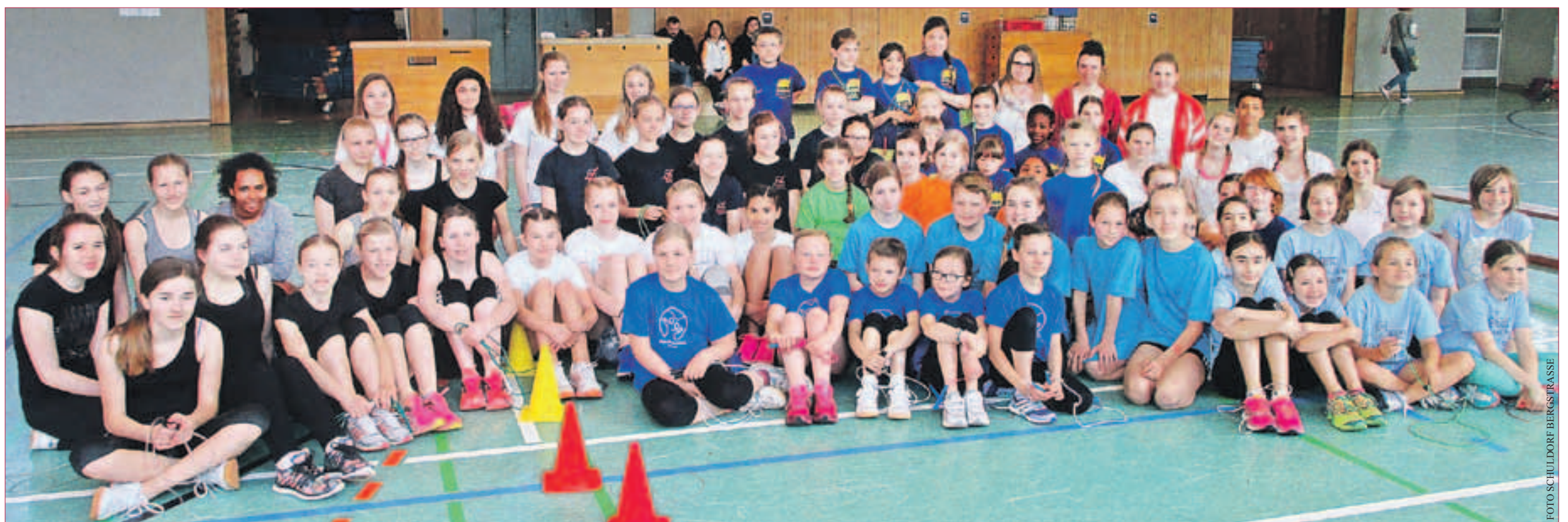
ERSTER PLATZ: Das Schuldorf konnte vor Melsungen auf den ersten Platz springen und somit die Goldmedaille sichern.

Für alle Veranstaltung ist eine formlose Anmeldung erforderlich. Diese kann per Mail unter info@gruenderberatungen.de oder telefonisch unter Darmstadt: 06151- 860 4714 oder im Gründerbüro Mannheim: 0621-84 10 182 abgegeben werden.