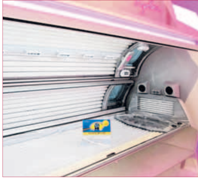
EINBLICK IN EINE KABINE mit dem neuesten Bräuner Ergoline AFFINITY-700. 160 m 2 Fläche besitzt die Studiofläche und hat 8 Kabinen.

Feldstraße 8 • 64331 Weiterstadt Telefon 0 61 51/2 11 40 www.suzuki-weiterstadt.de