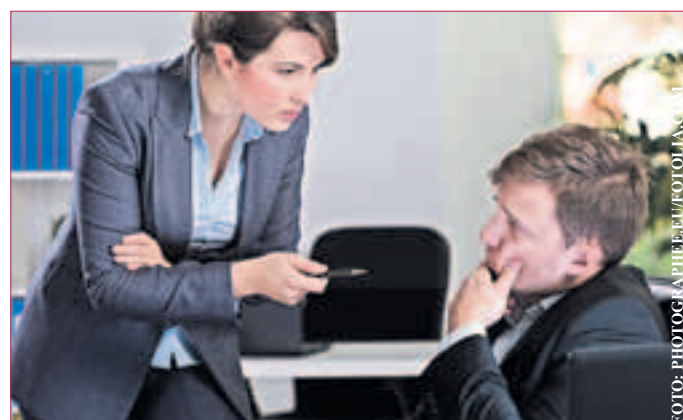
ANGESPANNTE ARBEITSATMOSPHÄRE: Probleme bei der Zusammenarbeit mit schwierigen Kollegen: Zu viel Stress am Arbeitsplatz wirkt sich häufig negativ auf das Privatleben aus.

Weitere Informationen zum Randstad Award und zur Studie gibt es unter www.randstad-award.de . (tm-p)