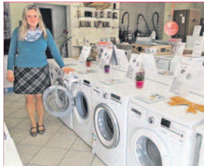
DIE FUNKTIONSWEISEN der einzelnen Waschmaschinen werden erklärt