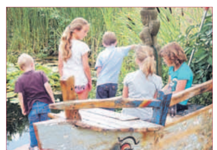
FRÖSCHE & KAULQUAPPEN: Kinder beobachten das bunte Leben am Teich.