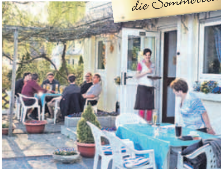
GROSSE TERRASSENFLÄCHE im Grünen mit dem Blick auf die Bergstraße vor dem Lokal. Frau Arabatzis bedient mit steter Liebesswürdigkeit die Gäste.