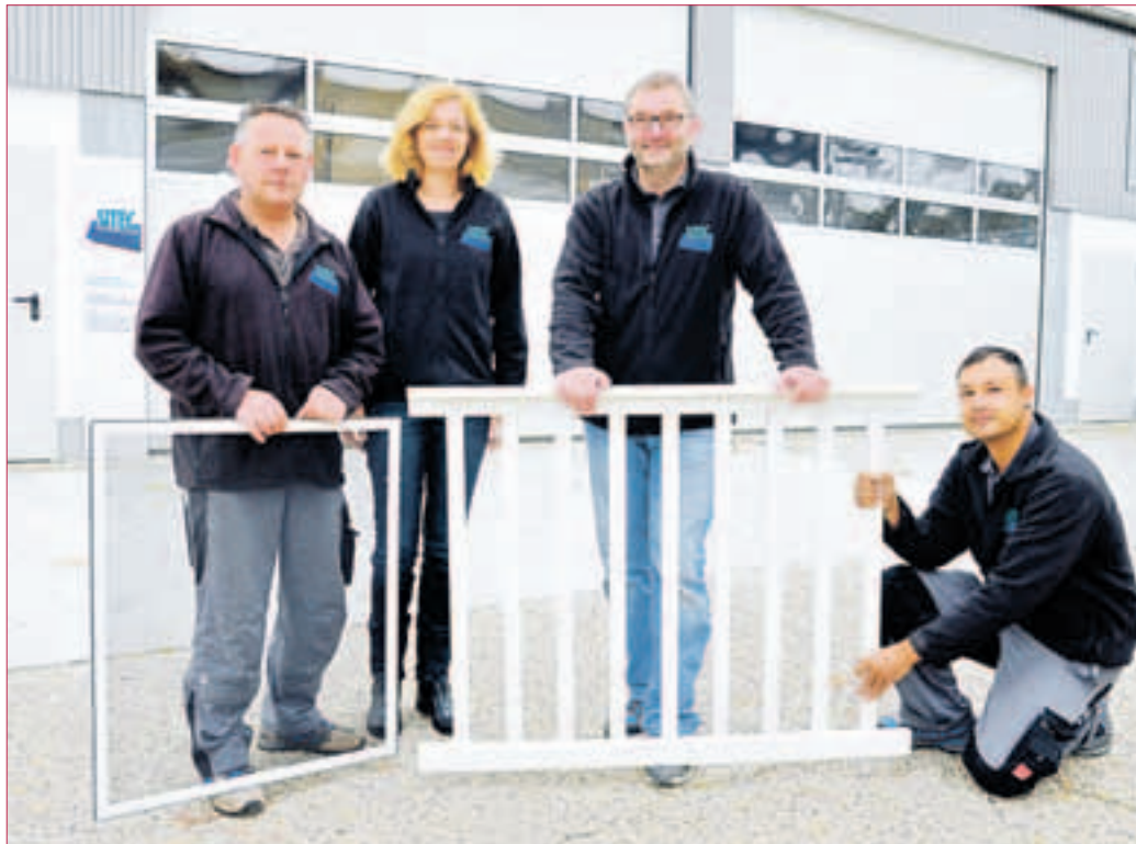
FAST ALLES WIRD AUTOMATISIERT: Kernkompetenz der Firma Sitec ist die Antriebstechnik.

ZWINGENBERG. Jetzt kommt die warme Jahreszeit. Da möchte man ins Freie. Und wenn es nur ein schöner Balkon ist, auf dem man die Sonne genießen kann. Sie haben noch keinen Balkon? Da kann Ihnen die Firma Sitec in Zwingenberg-Rodau ganz toll helfen. Sitec bietet Anbaubalkone aus pulverbeschichtetem Aluminium zu günstigen Preisen. Aluminium ist wartungsfrei, rostet nicht und bietet vielfältige Gestaltungsmöglichkeiten. Der Balkon kann in jeder Größe, entsprechend Ihren Wünschen, ohne Schweißnähte in allen RAL-Farben oder in Hol-