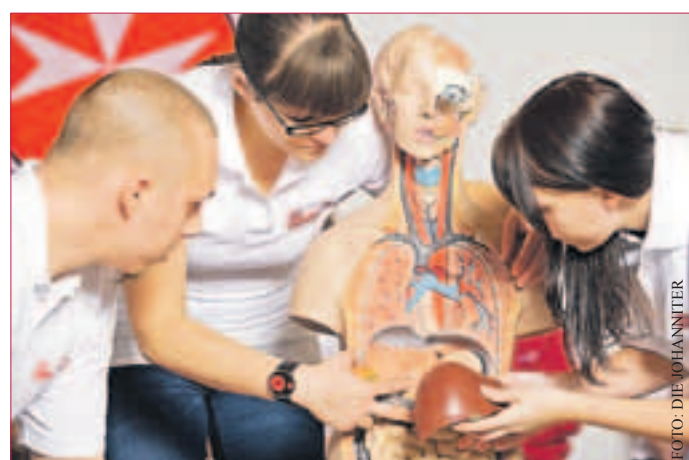
DIE JOHANNITER BIETEN FREIE STELLEN AN: In den nächsten Wochen und Monaten werden mehrere Stellen frei, weil die jetzigen Freiwilligen ins Studium oder in die Berufsausbildung wechseln.

„Egal, ob es Bundesfreiwilligendienst (BFD) oder Freiwilliges Soziales Jahr (FSJ) heißt, praktisch sind die Rahmenbedingungen für alle gleich“, erklärt Lehr. Beide Arten des Engagements laufen in der Regel über ein Jahr und werden mit einem Taschengeld entlohnt. Stellt der Dienstgeber keine Unterkunft, werden die Fahrtkosten erstattet. Die Verpflegung kann in einigen Fällen noch dazukommen. Außerdem werden die Freiwilligen natürlich sozialversichert und haben Anspruch auf Urlaub. Theoretisches Know-how und weitere Weiterbildungsmöglichkeiten werden in 25 Seminartagen vermittelt. Kontakt für weitere Auskünfte und Bewerbungen: Johanniter-Unfall-Hilfe, Telefon 06155-600 00 oder 06071-209 60. www.juh-da-di.de