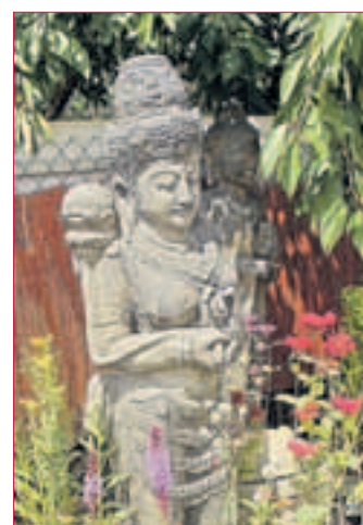
FIGUR Dewi Tara, die Sternengöttin