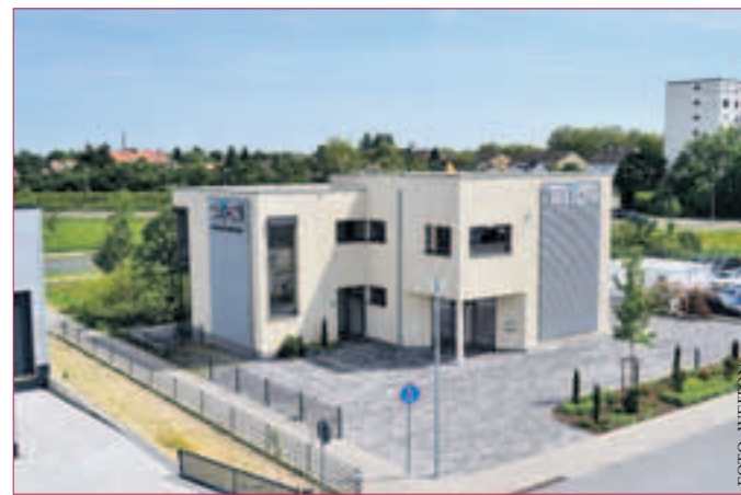
ÜBER 100 JAHRE FIRMEN-GESCHICHTE: Weton erbaute in dieser Zeit tausende Massivhäuser.

WETON Massivhaus GmbH Ernst-Rahlson-Straße 17 67227 Frankenthal Telefon: 06233-737744 Fax: 06233-7377410 Email: frankenthal@weton.de Internet: www.weton.de