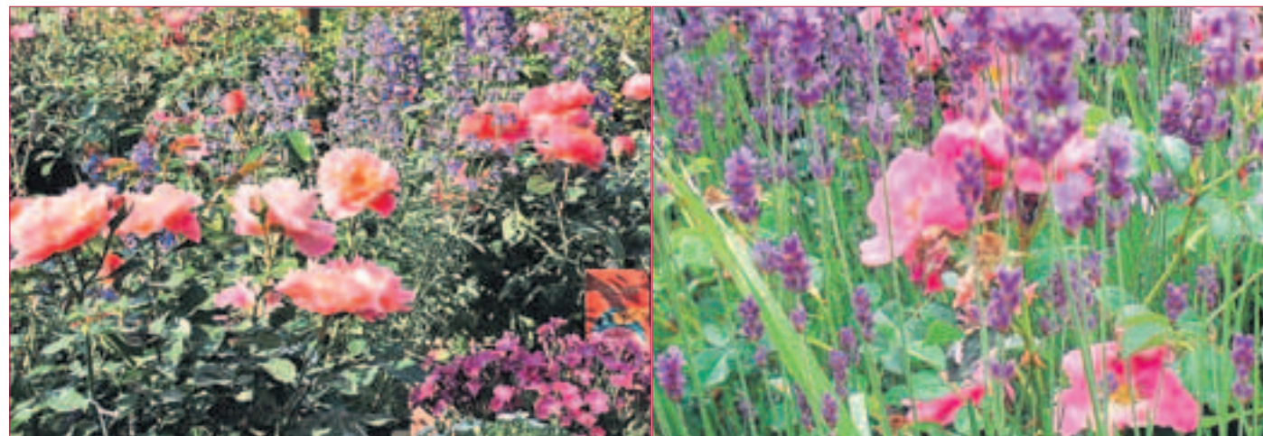
ROSENZEIT BEI APPEL! Rosige Vielfalt von Rosen und Stauden im Juni. Schauen Sie doch einfach mal vorbei. Es lohnt sich bestimmt!

Die Natur verwöhnt uns in diesem Jahr mit einer wunderbaren Rosenblüte. Passend dazu präsentiert APPEL zur sommerlichen Rosenzeit mehr als 150 Rosensorten, als Stammrosen, Solitärrosen und in verschiedenen Topfgrößen. Oft schon blühend und zu sofortigen Pflanzen im Garten geeignet. Im großen Staudensortiment finden sich viele Stauden, die mit ihren Blüten gleich den passenden Rahmen für die Rose abgeben. Vielleicht für einen „Blauen Garten“ mit Stauden, die den Rosen mit ihrem blauen Farbspiel ein romantisches Flair geben? Steinquendel (Calamintha), die Rittersporne (Delphinium), Glockenblumen (Campanula) und Storchschnabel (Geranium) oder Katzenminzen (Nepeta) sind hier bewährte Kombipartner. So kann schon im Laufe eines Wochenendes die neue – duftende – Wohlfühlecke im eigenen Garten entstehen.