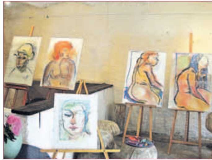
BILDER-AUSSTELLUNG bis 5. Juli einer einheim. Künstlerin im „Kuhstall“

etwa der Mittagstisch ab 5,50 Euro. Während der Aktionswochen steht Abwechslung auf dem Speiseplan: Die Biowochen vom 03.06 – 28.06.2015 stellen Gemüse und Salate, frisch vom Griesheimer Acker, sowie die Kräuter