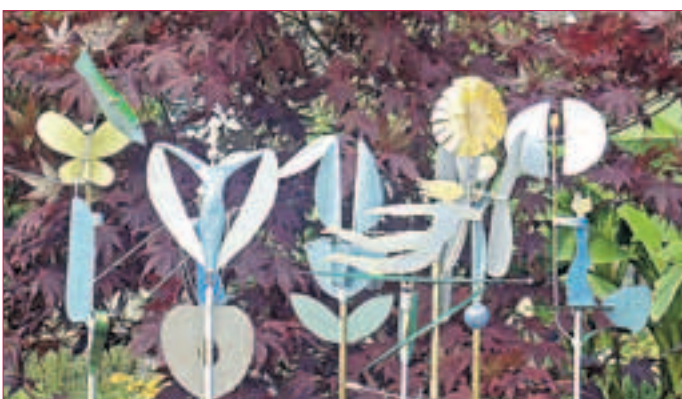
WINDOBJEKTE VON KÖHLER (unten); ROSA FERKEL locken Kinder an (oben)