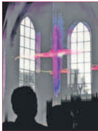
SPENDEN WILLKOMMEN: Das Projekt wird von der Kirche finanziert.

DARMSTADT. „Komm, sei Gast!“ – dieses Motto hat die Arbeitsgemeinschaft Christlicher Kirchen ACK Darmstadt bereits im vergangenen Jahr für die sechste Nacht der Kirchen in Darmstadt gewählt. Nun gewinnt es durch die Flüchtlingsdramatik im Mittelmeer und die Anschläge auf Asylbewerber-einrichtungen eine unerwartet aktuelle und fast körperlich spürbare Bedeutung. Wie muss den Menschen zumute sein, die der Perspektivlosigkeit ihrer Heimat auf untauglichen Booten entfliehen? Wie stark muss die Hoffnung sein, bei uns freundliche Aufnahme, Frieden und Menschlichkeit zu finden?